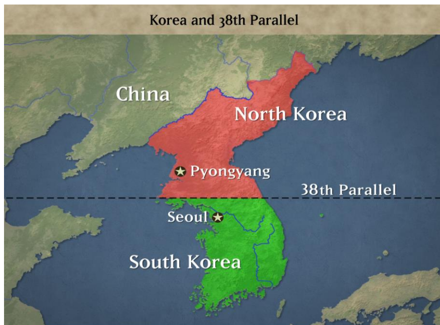
Slika 1. Karta koja prikazuje Sjevernu i Južnu Koreju prije početka rata

žrtvama. Ovo će biti samo jedan od razloga zbog kojeg će Sjeverna Koreja objaviti rat Južnoj, uz kontekst da žele zaštititi stanovništvo od južnokorejskog terora. 11