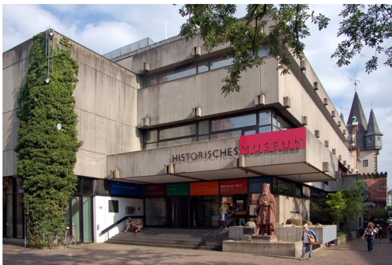
Slika 7. Frankfurtski povijesni muzej