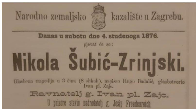
Slika 5 Poziv na Zajčevu operu u Zagrebu (A. SZABO, Hrvatski velikan Nikola Šubić Zrinski , 55.)

su se prijavile za natječaj objavljene su u kamenotisku pod nazivom Glazbeno Zrinska spomenica , kako bi bile dostupne javnosti. Također je, za 300. obljetnicu proslave, August Adelburg skladao operu Zrinyi . 100 Tada je napisana i poznata domoljubna pjesma U boj, u boj koju je napisao hrvatski književnik Franjo Marković. Stihovi ove pjesme uglazbljeni su u operu Nikola Šubić Zrinski skladatelja Ivan pl. Zajca, a ona je ujedno i najpopularnije hrvatsko glazbeno-scensko djelo. Zajčeva opera je prvi put izvedena 4. studenog 1876. godine u Zagrebu. Libreto za operu je napisao Hugo Badalić. 101 O važnosti ove opere u svrhu veličanja i odavanja počasti Nikoli Šubiću Zrinskom, svjedoči i podatak da je izvedena 1 317 puta. Osim što je opera bila najpopularnije djelo u cijeloj Hrvatskoj, postala je poznata u Europi i izvan nje. Poznata je čak u dalekom Japanu gdje se stihovi iz opere izvode kao himna muškog pjevačkog zbora kojom se odaje počast samurajskoj smrti junaka. Japanci su za napjev saznali 1919. godine kada su se hrvatski mornari nasukali pokraj Japana, vraćajući se u sastavu Austro-Ugarske vojske iz Sibira. Ondje su se zadržali u periodu od dva mjeseca i za to vrijeme su naučili lokalno stanovništvo pjesmu u boj, u boj! 102