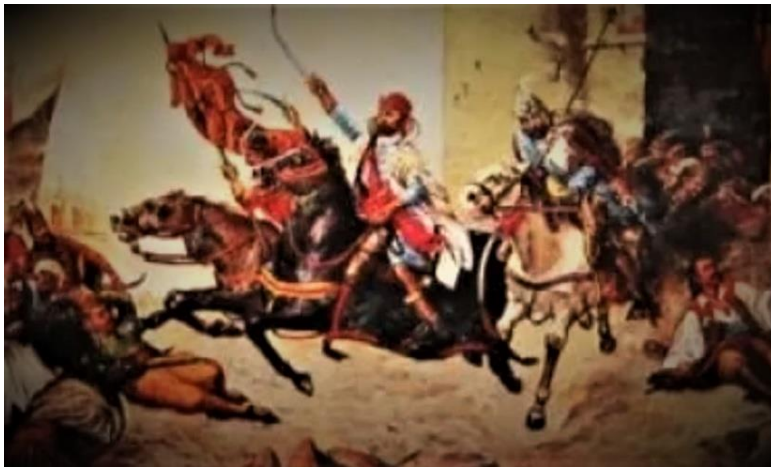
Slika 3 Oton Iveković, Juriš Nikole Zrinjskoga iz Sigeta, ulje na platnu, 1889. (A. SZABO, Hrvatski velikan Nikola Šubić Zrinski, 14.)

Turci su zauzeli vanjski dio Starog Grada, a branitelji Sigeta se povlače u unutarnji dio. Unutarnji dio grada nije bio zaštićen, a uz to Zrinski je imao malo teškog naoružanja te malo i nedovoljno hrane i vode. Još jednom turske snage pozivaju Zrinskog na predaju nezauzetog dijela grada, što on ponovno odbija. Nakon neuspjelog pokušaja turske vojske da nagovori Zrinskog na predaju, započinju napad na unutarnji dio Starog Grada. Grad počinje gorjeti nakon gađanja vatrenim strijelama. 58 „Kad je Zrinski vidio da mu grad gori i da u njemu više ne može ostati te mu je bolje poginuti boreći se s neprijateljem nego čekati da izgori, odluči provaliti iz grada.“ 59