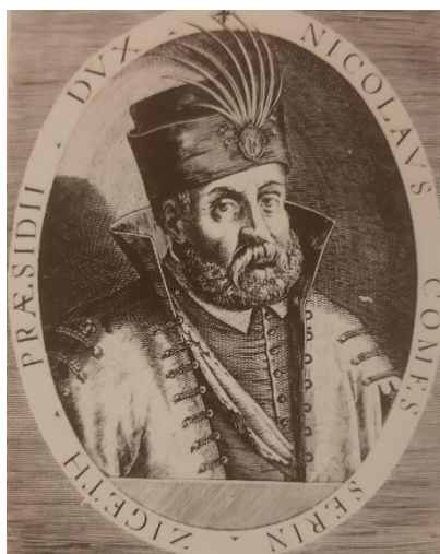
Slika 1 Nikola Šubić Zrinski

Ovdje je rođen Nikola Šubić Zrinski 1508. godine. Bio je sin Nikole III. Zrinskog i krbavske kneginje Jelene Karlović. 7 Već 1529. godine, kao dvadeset jednogodišnjak, istaknuo se u bitci protiv Turaka kod Beča. 8 Oženio se Anom Katarinom Frankopan i tim brakom stupio je u vezu sa plemićkom obitelji Frankopan i tako stekao njihove brojne posjede. Nakon smrti Ane Katarine oženio se pripadnicom češke aristokratske obitelji Evom Rosenberg. 9