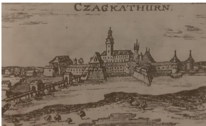
Slika 2 Čakovec u doba Zrinskih u 17. stoljeću (Agneza SZABO, Hrvatski velikan Nikola Šubić Zrinski , 27.)

Kada pričamo o arhitektonskom razvoju Starog Grada Čakovca, odnosno čakovečke utvrde, on se odvijao tijekom 13. i početkom 14. stoljeća. Čakovečka utvrda je u svom prvobitnom stanju bila drvena, a kasnije je od nje stvoren utvrđen plemićki grad. Od trenutka kada čakovečkim Starim Gradom gospodari obitelj Zrinski, utvrda i palača prolaze kroz modernizaciju pa se grade peterokutne kule, odnosno bastioni. Radi obrambene uloge podignuti su visoki bedemi i zidine te oko toga dvostruki vodeni opkop koji je dodatno štitio od neprijatelja, a uz to podignute su i dvije stražarnice na drvenom mostu koje su čuvale ulazak u utvrdu. Kasnije, sredinom 17. stoljeća, Nikola VII. Zrinski, praunuk Nikole Šubića Zrinskog, ponovno pokreće modernizaciju utvrde tako što je osmerokutnu bastionsku utvrdu odlučio preoblikovati u peterokutnu utvrdu. Taj naum Nikole VII. Zrinskog nije u potpunosti sproveden zbog njegove tragične smrti. Kako su se smirivale osmanske opasnosti od kraja 17. stoljeća, tako utvrda gubi svoju funkciju pa se tijekom 18. stoljeća južni dio zidina razgradio. 37