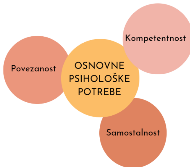
Slika 2: Osnovne psihološke potrebe pojedinca

Prikazane tri potrebe pokazale su se neophodne za normalno funkcioniranje prirodne tendencije za rastom i uspješnom integracijom u društvu, za socijalni razvoj i osobnu dobrobit. Pa se tako potreba za kompetentnošću odnosi na osjećaj sposobnosti i mogućnosti kontrole nad okolinom, potreba za povezanošću podrazumijeva osjećaj pripadnosti nekoj društvenoj skupini, identificiranje kao člana neke socijalne skupine, dok se potreba za samostalnošću odnosi na prirodnu tendenciju pojedinca za organizacijom i upravljanjem vlastitim ponašanjima te na ponašanje u skladu s doživljajem sebe i vlastitim uvjerenjima. Ovisno o tome u kojoj mjeri društveni kontekst dopušta i osigurava zadovoljavanje ove tri osnovne potrebe, intrinzična motivacija pojedinca za učenje i osobni razvitak može varirati. Uz to, ekstrinzična motivacija uz pomoć procesa internalizacije 2 može se pretvoriti u intrinzičnu, točnije rečeno osoba postaje autonomno motivirana (Deci, Ryan, 2000).