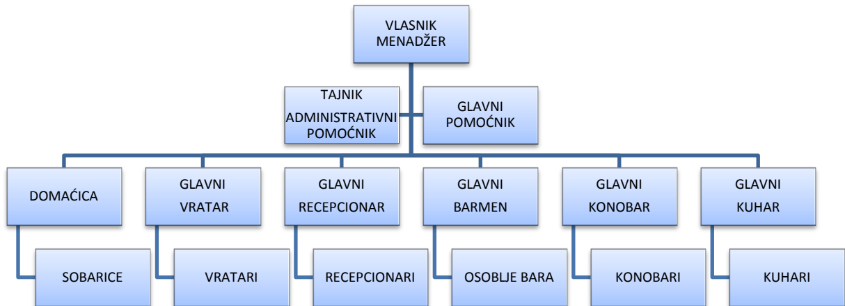
Graf 1. Organizacijska karta malog hotela