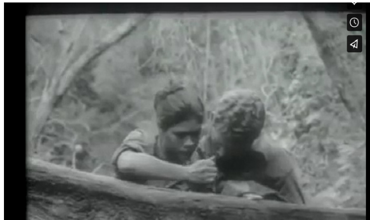
Imagen n°3. El Mexicano le enseña a Manuela a escribir (Manuela 24:30)

aspectos de la sociedad en cuanto a las mujeres (Mihaljević, 2016). Algunos de esos cambios podemos ver en la manera que el Mexicano trata a Manuela: no la humilla sino le ayuda aprender a leer, escribir y hablar sobre sus ideas y opiniones (Imagen n°3).