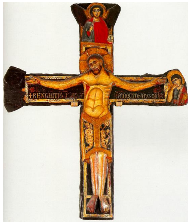
Slika 2. Zadarski majstor (?), Reljefno slikano raspelo, crkva Sv. Mihovila u Zadru, 13. stoljeće (izvor: E. HILJE, R. TOMIĆ, 2006., 95.)