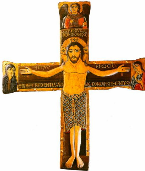
Slika 1. Nepoznati majstor, Reljefno slikano raspelo, Riznica samostana Sv. Frane u Zadru, 12./13. stoljeće (izvor: E. HILJE – R. TOMIĆ, 2006., 92.)