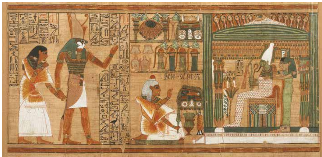
Slika 2. Primjer bogato ukrašene stranice iz Anijevog papirusa. (F. Scalf, 2017, 21.)

zbog svojih bogatih ilustracija. 13 Također, sadrži i razne upute na temelju kojih su se obavljali razni rituali, primjerice, vaganje srca pokojnika, što će biti kasnije objašnjeno.