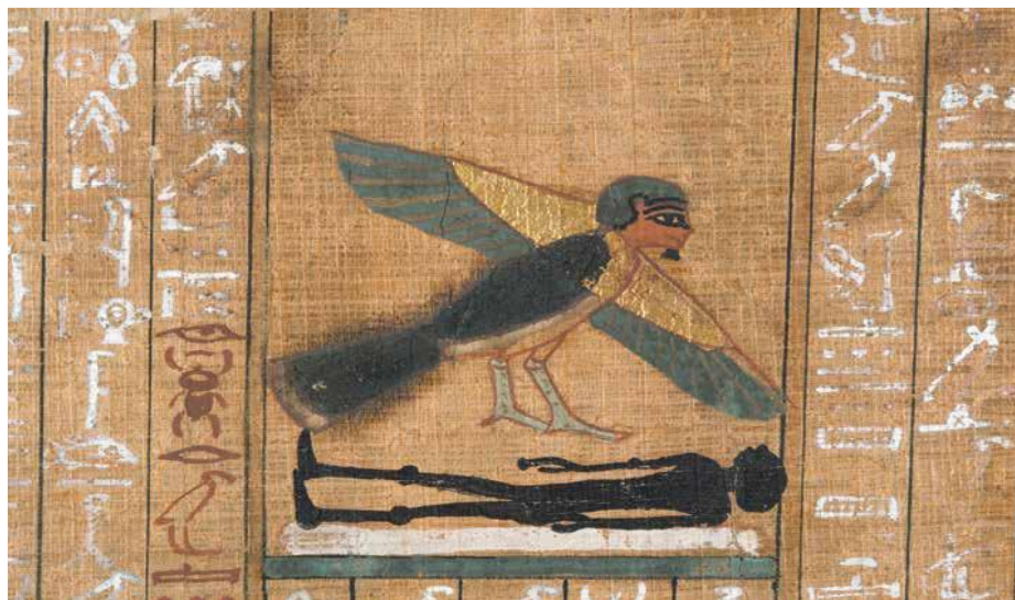
Slika 7. Pokojnikova duša u obliku ptice lebdi nad njegovim tijelom o čemu svjedoči čarolija 89. (I. Munro, 2017, 50.)

Iako su ove čarolije bile namijenjene zaštititi pokojnika, postojale su čarolije koje su koristili i živući. Njihov točan broj nije poznat, no smatra se da su koristili oko njih 50. Primjerice, prema čaroliji 20, ako je osoba izgovorila ovu čaroliju te okupala se natrijskoj vodi, osigurala si je stupanje prema zagrobnom svijetu. 142 Ovaj podatak nalaže da je njihova uloga bila ista – koristile su se za izvođenje rituala, za osobnu zaštitu te za pripremu u prelazak u zagrobni svijet. 143