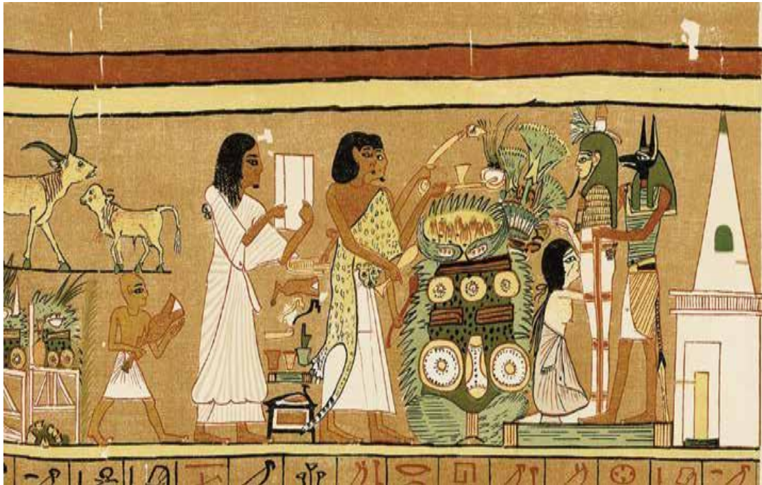
Slika 4. Ritual otvaranja usta pokojnika. (A. Kucharek, 2017, 124.)