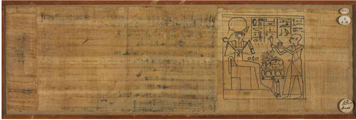
Slika 1. Prikaz stranica egipatske Knjige mrtvih . (H. Kockelmann, 2017, 67.)

Standardna veličina papirusa je varirala između 30 i 50 centimetara, a za konačno formiranje svitka, bilo je potrebno povezati stranice kojima je često dodana još jedna traka papirusa kako bi se dodatno ojačao, odnosno kako bi se spriječilo ispadanje stranica. 3 Upravo je na takav način nastala i egipatska Knjiga mrtvih , ali sam proces je bio nešto kompliciraniji nego pri stvaranju ostalih svitaka. No, o tome će više biti rečeno u slijedećim poglavljima.