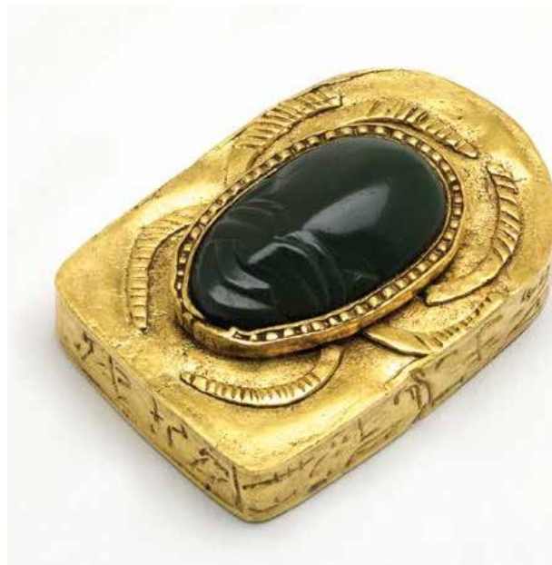
Slika 3. Amulet skarabeja s vidljivo ispisanim čarolijama. (P. F. Dorman, 2017, 39.)

Likovi životinja su s vremenom istisnuti iz uporabe, a njih su zamijenili amuleti geometrijskih oblika. Kao takvi, imali su značajniju ulogu u religijskim tekstovima, a samim time i u Knjizi mrtvih jer su korišteni za komunikaciju s bogovima te za njihovo pružanje zaštite pokojniku u zagrobnom životu. Jedan od najvažnijih amuleta koji je predstavljen u Knjizi mrtvih još od ranog razdoblja je srce. Srce je imalo važnu ulogu u pokojnikovu zagrobnom životu te je bilo posebno mumificirano i čuvano u kanopi, a prema Knjizi mrtvih , pokojniku je podareno novo srce koje bi mu omogućilo slobodu. 72