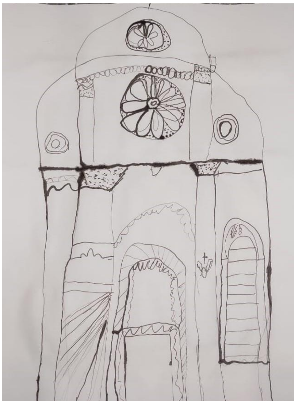
Slika br. 12 Primjer djelomično uspješnog rada

Rad ovog učenika ocijenjen je kao djelomično uspješan. Jasna je kompozicija likovnog djela, no učenik nije kadrirao točno određeni element katedrale, već njeno čitavo pročelje. Od crta po toku vidljive su ravne i zaobljene, dok po karakteru jasno se ističu debele, tanke, kratke i duge crte. Prikaz samog pročelja je djelomično uspješno prikazan, naime predložen je portal i rozeta te prozor samo s desne strane što utječe na pojavu asimetrije. Kompozicija likovnog djela ne obiluje potrebnim detaljima, ali je uklopljena u format papira. Kontrast mokro-suho je uspješno izveden na samo jednom dijelu likovnog rada.