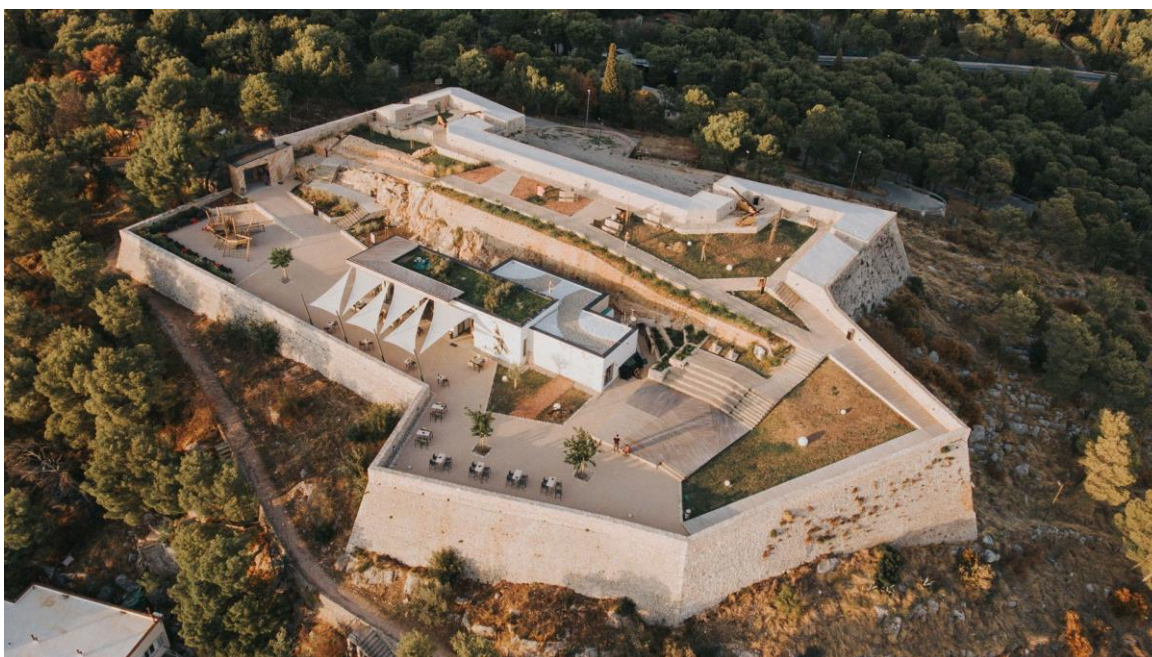
Slika br. 5 Tvrđava Barone