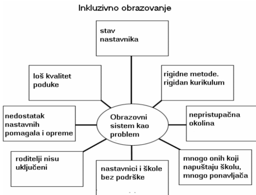
Slika 2. Inkluzivno obrazovanje. Cerić, 2004

sadržaja u radu. Na taj način se sustav prilagođava potrebama djeteta tako da svako dijete ima pravo i mogućnosti ravnopravno sudjelovati u obrazovanju. Neke od sastavnica inkluzivnog obrazovanja jesu: uvažavanje svih učenika te nastavnog i školskog osoblja na jednaki način, sudjelovanje svih učenika, savladavanje prepreka u učenju, razvijanje suradnje, mijenjanje politike, prakse i kulture u školama tako da pogoduju svim učenicima, različitosti se postavljaju kao prednost, a ne prepreka, spoznaja kako je inkluzivno obrazovanje samo jedan aspekt inkluzije u društvu (Karamatić Brčić, 2011 navedeno u Booth. Ainscow, 2002). Ovakav pogled na inkluzivno obrazovanje predstavlja veliki napredak spram koncepta integracije jer u ovom sustavu sudjeluju svi, a kako se mijenja odgojno-obrazovni sustav, tako se mijenja i cjelokupno društvo i zajednica.