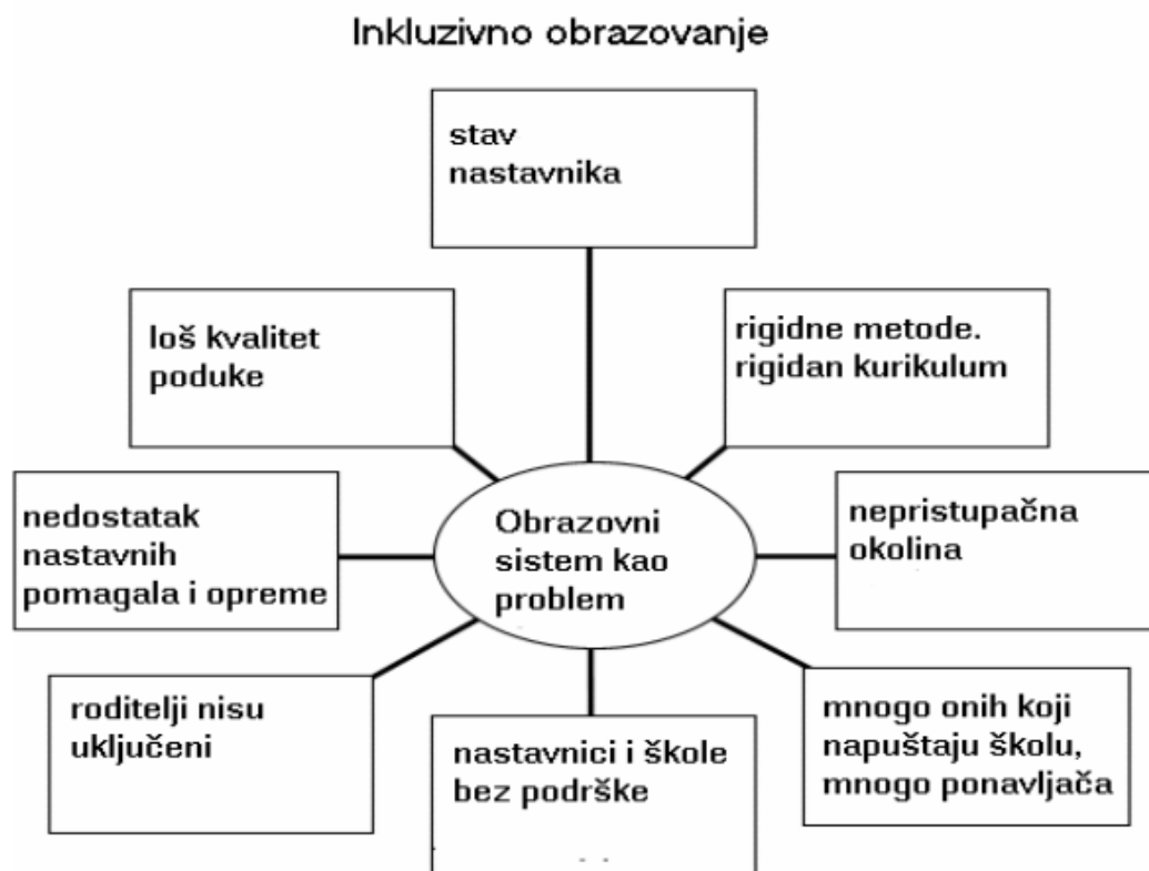
Slika 2. Inkluzivno obrazovanje. Cerić, 2004

sadržaja u radu. Na taj način se sustav prilagođava potrebama djeteta tako da svako dijete ima pravo i mogućnosti ravnopravno sudjelovati u obrazovanju. Neke od sastavnica inkluzivnog obrazovanja jesu: uvažavanje svih učenika te nastavnog i školskog osoblja na jednaki način, sudjelovanje svih učenika, savladavanje prepreka u učenju, razvijanje suradnje, mijenjanje politike, prakse i kulture u školama tako da pogoduju svim učenicima, različitosti se postavljaju kao prednost, a ne prepreka, spoznaja kako je inkluzivno obrazovanje samo jedan aspekt inkluzije u društvu (Karamatić Brčić, 2011 navedeno u Booth. Ainscow, 2002). Ovakav pogled na inkluzivno obrazovanje predstavlja veliki napredak spram koncepta integracije jer u ovom sustavu sudjeluju svi, a kako se mijenja odgojno-obrazovni sustav, tako se mijenja i cjelokupno društvo i zajednica.