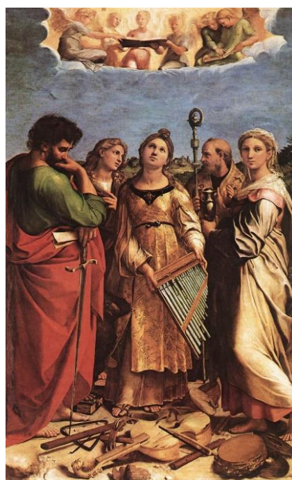
slika 3. Rafael, Ekstaza svete Cecilije , 1514.