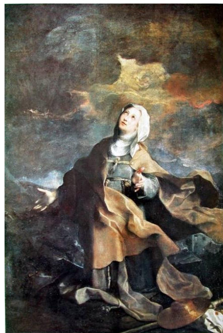
slika 19. Barocci, Bl. Michelina Metelli, 1590. – 1600., Vatikan, Pinakoteka