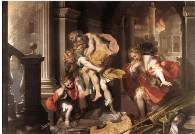
slika 17. Barocci, Bijeg Eneje iz Troje , 1598. Galerija Borghese, Rim