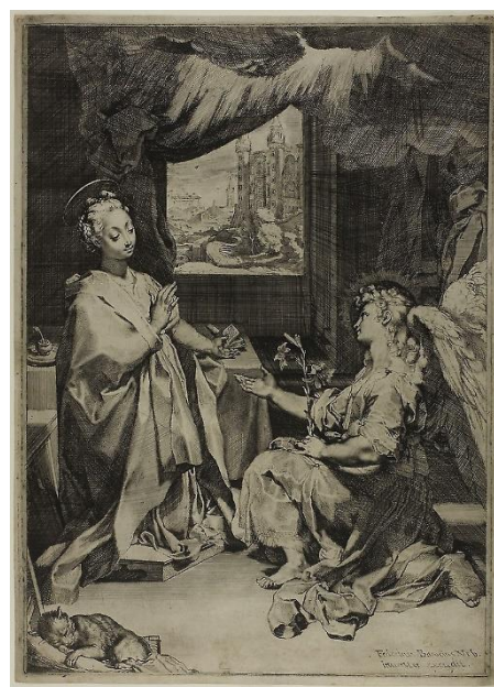
slika 15. Barocci, Navještenje , 1584., British Museum, London