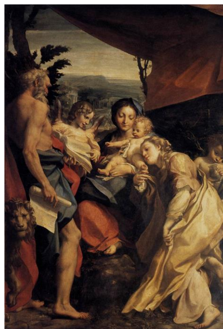
slika 9. Correggio, Madonna di San Girolamo , 1528. Nacionalna Galerija Parma