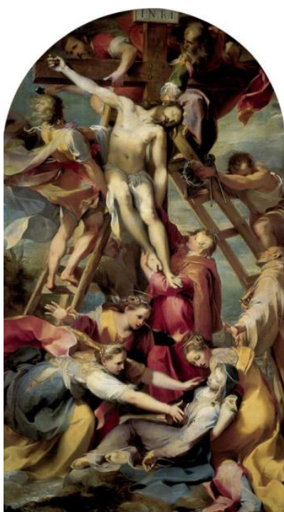
slika 10. Barocci, Skidanje sa križa , katedrala San Lorenzo, Perugia, 1567. – 69.