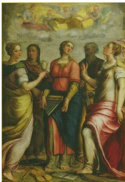
slika 1. Barocci, Sveta Cecilija sa svecima

1556., katedrala u Urbinu