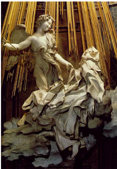
slika 18. G. L. Bernini, Ekstaza sv. Tereze , 1647-52. Kapela Cornaro, Santa Maria della Vittoria, Rim