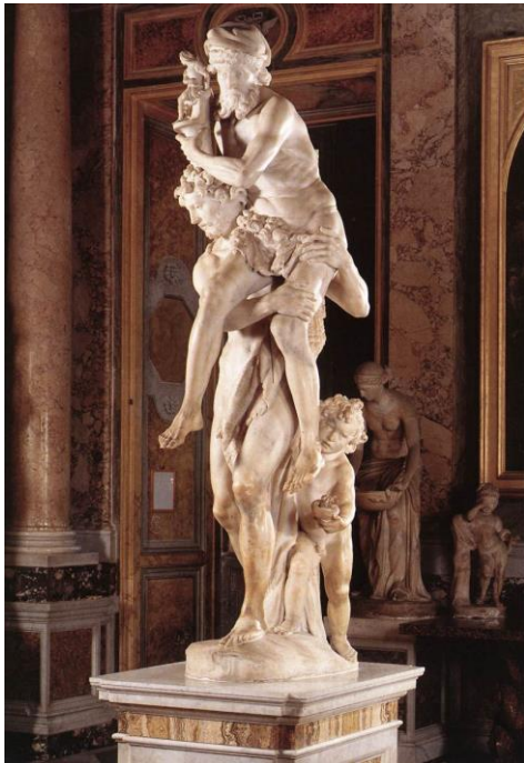
slika 16. G.L. Bernini, Eneja, Anhiz i Askanije 1618-19., Galerija Borghese, Rim