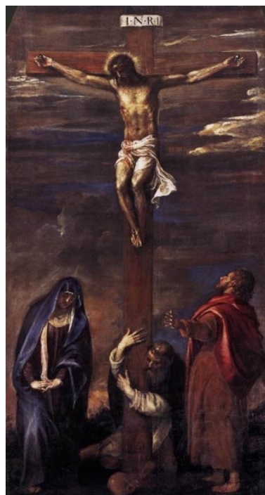
slika 7. Tizian, Raspeće , San Domenico, Ancona, 1558.