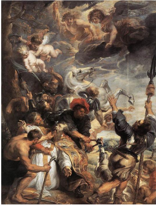
slika 20. Rubens, Mučeništvo sv. Livina , 1633.