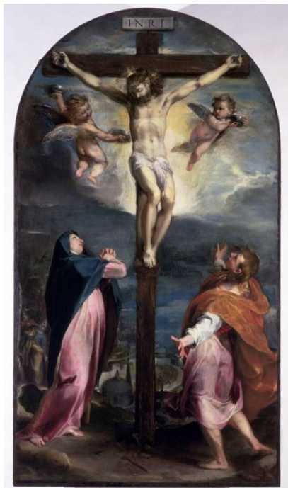
slika 6. Barocci, Raspeće , 1566./67., Nacionalna galerija, Urbino