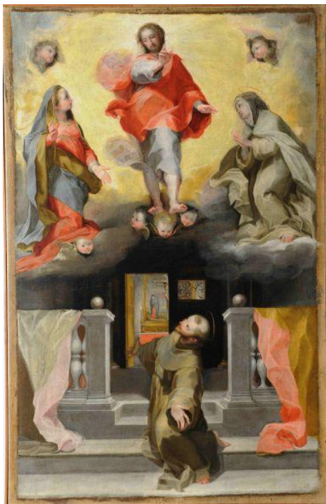
slika 24. Barocci, Oproštenje Franje Asiškog , 1574./76., San Francesco, Urbino