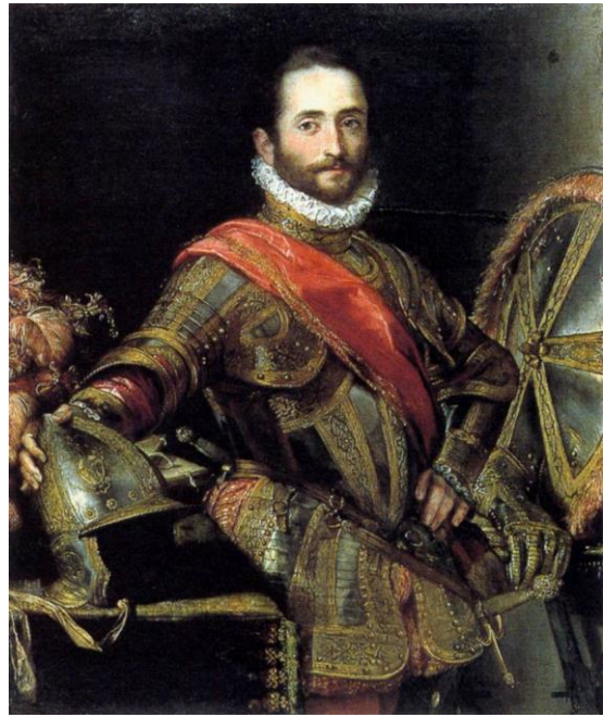
slika 23. Barocci, Portret Francesca II della Rovere 1572., Uffizi, Firenca