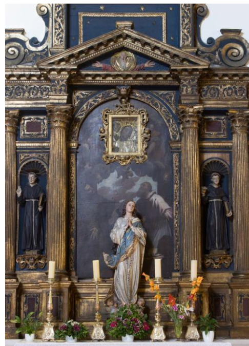
slika 23. Matteo Ponzone, oltarna slika, nakon 1635. sv. Frane Asiški i sv. Jerolim , crkva Sv. Frane, Šibenik