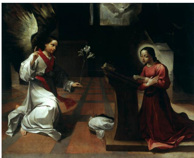
slika 14. Lodovico Carracci, Navještenje , 1583. – 84. Nacionalna Pinakoteka, Bologna