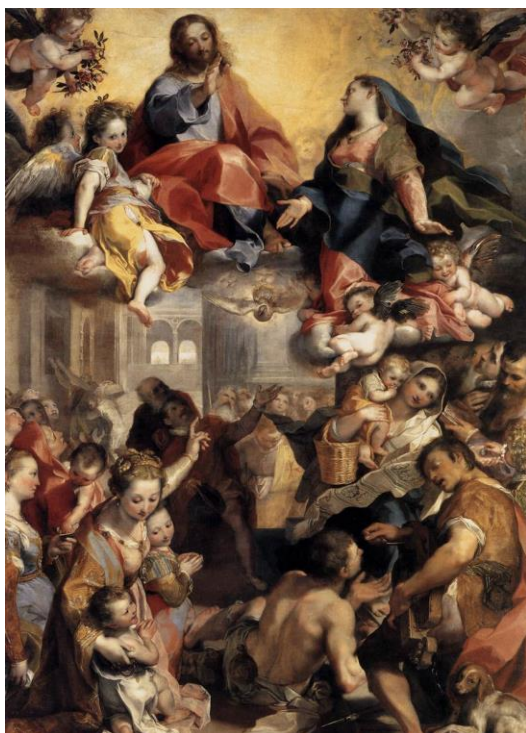
slika 12. Barocci, Madonna del Popolo , 1575. – 79. Galerija Uffizi, Firenca