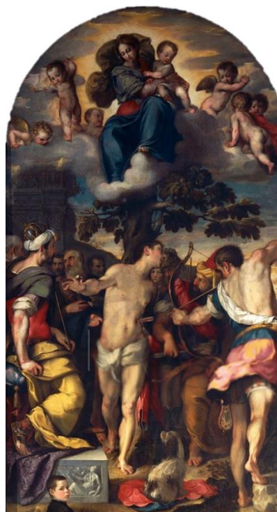
slika 5. Barocci, Martirij sv. Sebastijana , 1558., katedrala u Urbinu