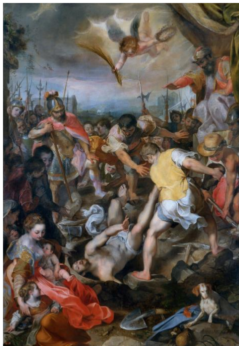
slika 21. Barocci, Mučeništvo sv. Vitalisa , 1580. – 83., Pinakoteka