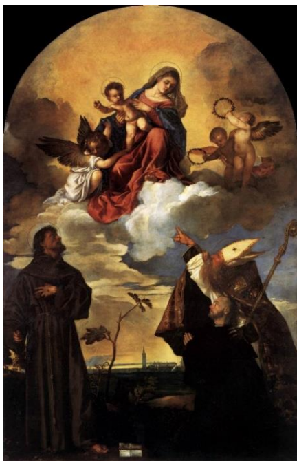
slika 4. Tizian, Pala Gozzi , 1520., Museo Civico, Ancona