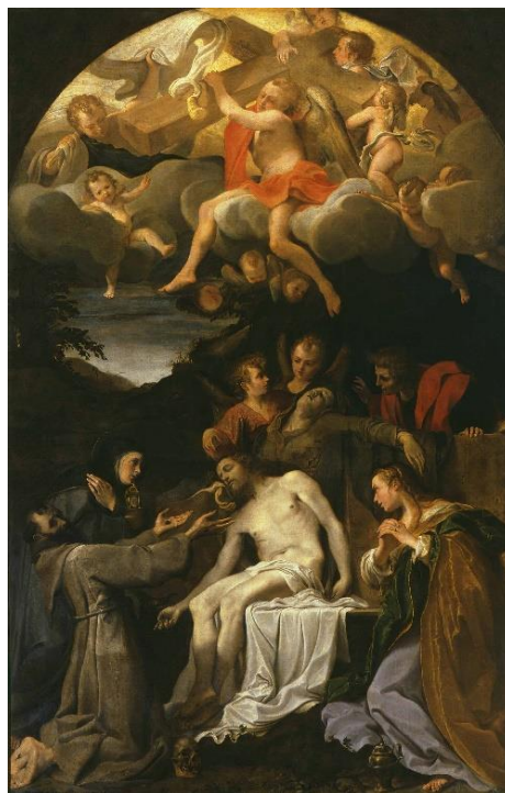
slika 13. Annibale Carracci, Pietà sa svecima , 1585., Nacionalna Galerija Parma