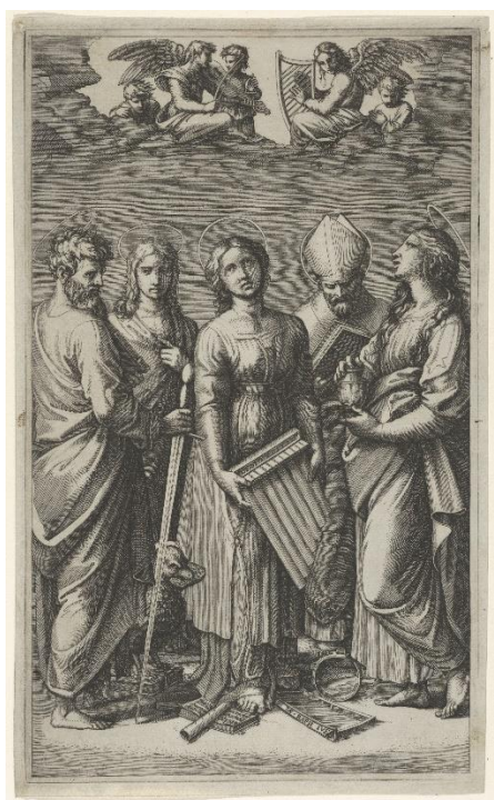
slika 2. Marcantonio Raimondi Sveta Cecilija sa svecima

1556., katedrala u Urbinu