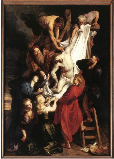
slika 22. Rubens, Skidanje s križa , 1611.-14., katedrala u Antverpu