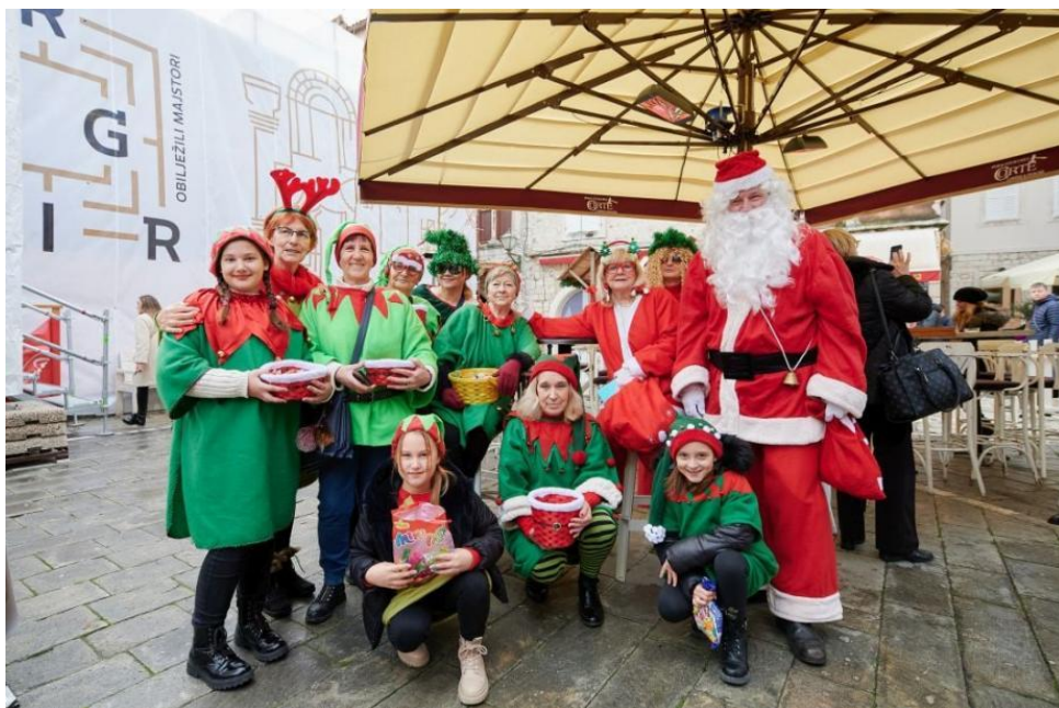
Slikovni prilog 12. Djed Božićnjak i vilenjaci na gradskom trgu 2021. godine