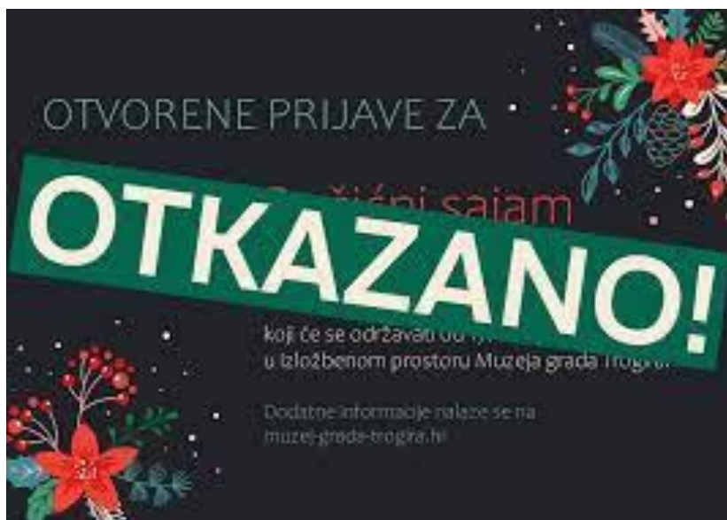
Slikovni prilog 15. Otkazani peti Božićni sajam rukotvorina

„Ja mislim da je najviše uvjetovalo to što se nije znalo kakve će bit mjere, u Muzej se nije moglo ući bez covid potvrde ili negativnog testa i plus to, imam osjećaj, da izlagači nisu očekivali ni da će se moći održati sajam pa se nisu ni spremali.“