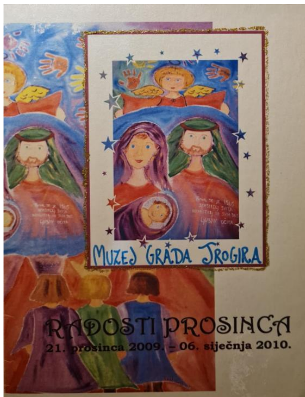
Slikovni prilog 14. Katalog izložbe „Radosti prosinca“

panja badnjaka, a u trećem dijelu izložbe su bili prikazani likovi iz jaslca i o svakom je bilo napisano nekoliko riječi.