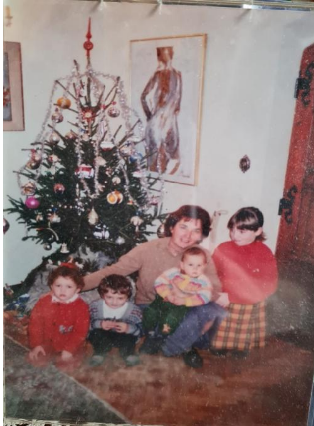
Slikovni prilog 11. Obitelj Božić ispred bora za Božić 1997. godine

Trogirani Božić obilježavaju iz godine u godinu „starim“ tradicijskim običajima, ali uz uvođenje i prihvaćanje novih praksi koje postaju dio božićnog ciklusa.