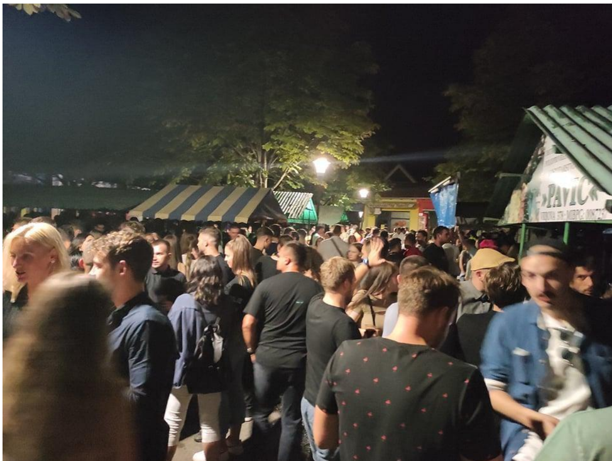
Slika 17. Okupljanje mladih na pijaci za vrijeme Novogradiškog glazbenog ljeta . Fotografija s terenskog istraživanja provedenog 15. kolovoza 2021. Autorica fotografije je Barbara Jeftoski.

„nepoznanici“ te bi se krug ljudi za našom klupom samo širio. Sami smo si pripremili pića poput bambusa i gemišta, a tko god bi došao do klupe moralo se nazdraviti.