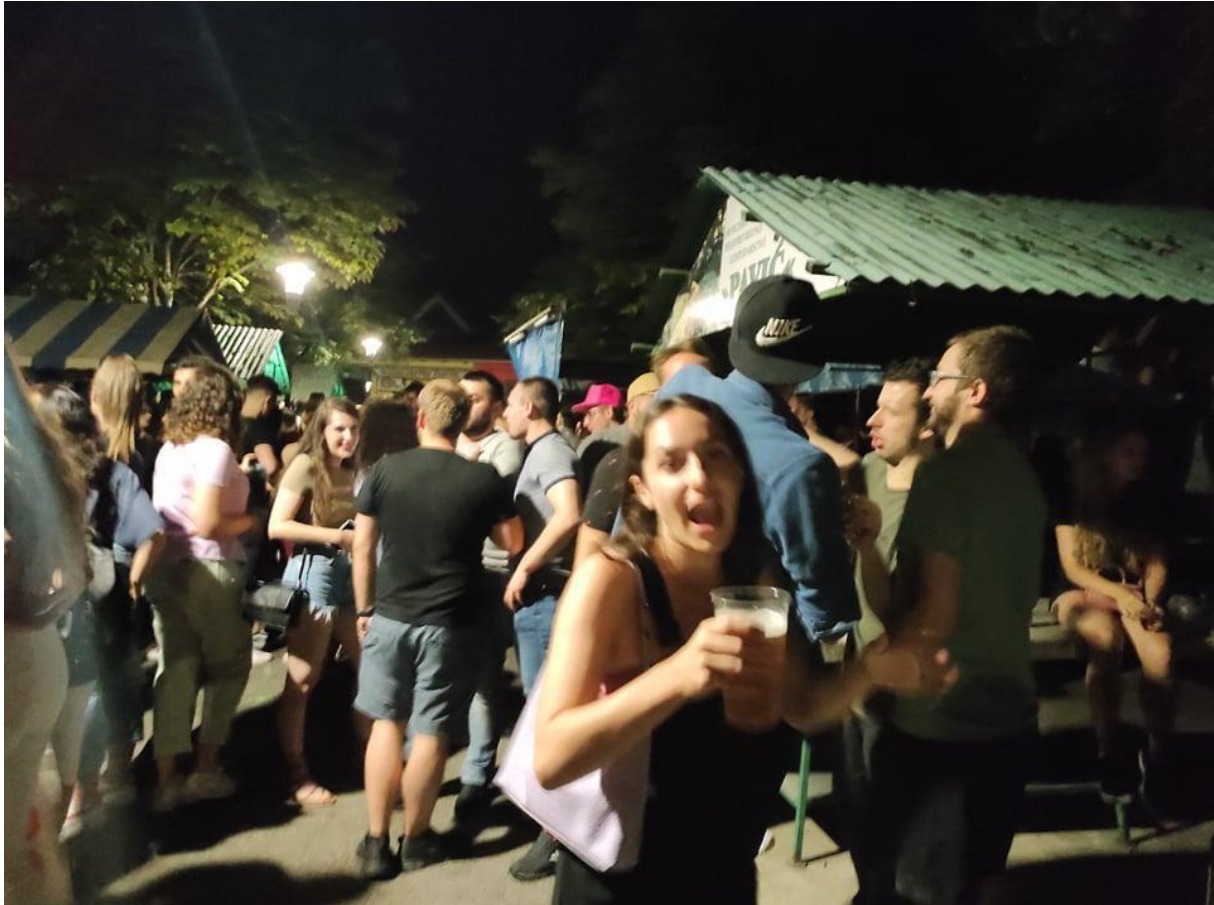
Slika 18. Ja kao sudionica u druženju i pijenju na pijaci . Iako sam tu noć došla s ciljem promatranja za ovaj rad, ipak sam se na kraju prepustila i sudjelovanju. Fotografija s terenskog istraživanja provedenog 15. kolovoza 2021.

S obzirom na to da je okupljanje i pijenje na javnim mjestima zabranjeno, a posebice na pijaci na kojoj je propisan određeni tržni red, znala nas je par puta posjetiti policija i dati nam upozorenje da se maknemo što prije. No, većina nas bi i dalje ostala jer se policajci više ne bi vraćali, a i rijetki su bili trenuci kada bi došli u ophodnju na pijacu . Bez obzira na rijetke posjete policajaca, ipak su mi izlasci na pijacu ostali kao dio sjećanja na srednjoškolske dane, ali i u počecima studiranja i odlaženja doma za vikende. Nakon odrađenog terenskog istraživanja i intervjuiranja mojih sugovornika i sugovornica pokušala sam saznati odakle se uopće pojavila tradicija pijenja i druženja na pijaci vikendom navečer te kako uopće moji sugovornici i sugovornice gledaju na pijacu s obzirom na to da prodavači s kojima sam pričala nemaju ovu iskustvenu dimenziju pijace .