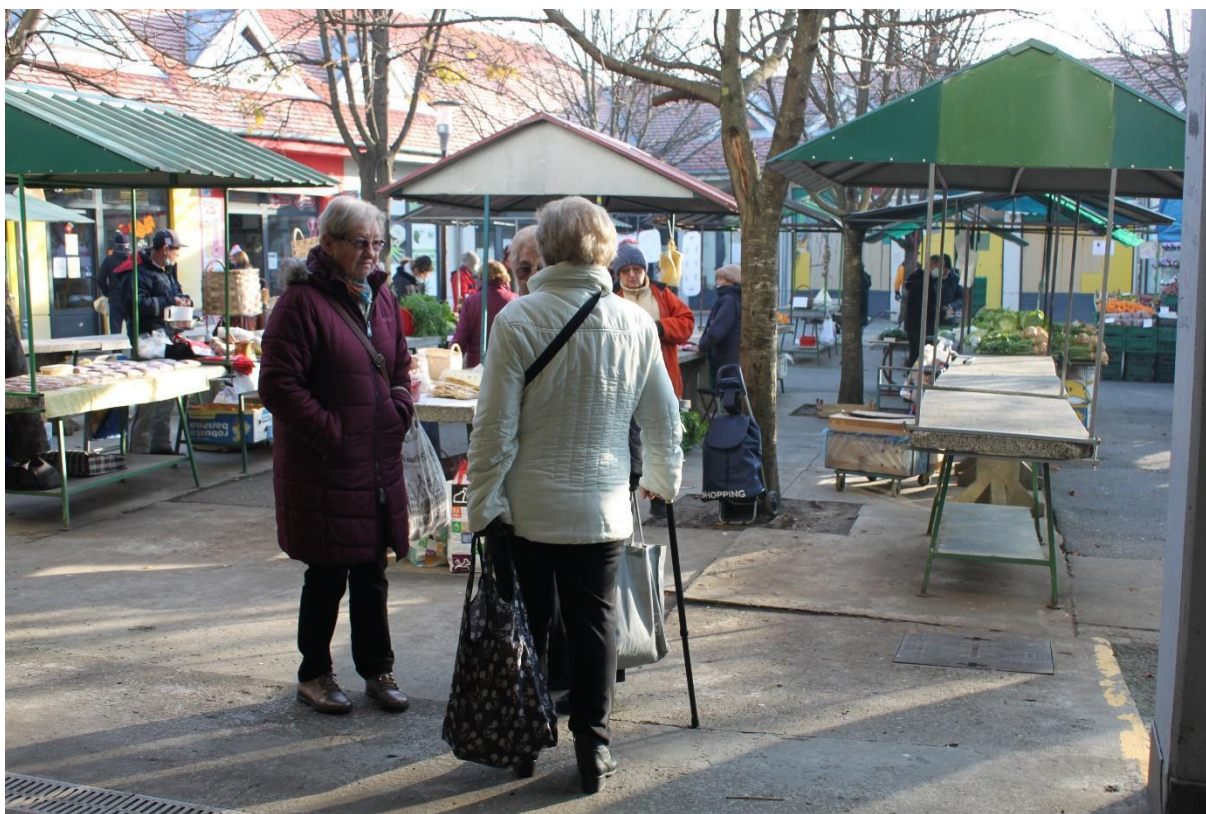
Slika 16. Kupci koje su se srele i stale popričati na pijaci . Fotografija s terenskog istraživanja provedenog 10. prosinca 2021.

Tijekom moga sudjelovanja u svakodnevnici pijace kao prodavačica, kao antropologinja i kao kupac zapisala sam i čula razne razgovore među kupcima, a u kojima se većinom priča o obitelji, o odlasku mladih u Njemačku, a u novije vrijeme i o pandemiji COVID te o političkoj situaciji u Hrvatskoj. Prilikom jednog terenskog istraživanja uspjela sam zapisati razgovor među dvoje kupaca, a koji su upravo obuhvatili sve gore navedene teme: „Odoše nam mladi u Njemačku, nema više nikoga, a situacija nam sve gora s ovom koronom i s našim nesposobnim političarima. Nema nam spasa bojim se ja“.