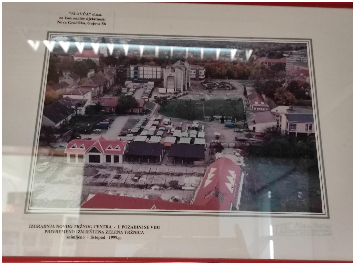
Slika 5. Prikaz tržnice iz 1999. godine prije zadnje rekonstrukcije. Crvenim krugom zaokruženo je područje tržnice. Fotografija fotografirana u zgradi Eko Konga 03. ožujka 2022.

Za prvi urbanistički plan nemam informacija je li se doista i realizirao, ali sa sljedeću fazu rekonstrukcije tržnice imam fotografiju iz 1999. godine, netom prije treće i konačne rekonstrukcije.