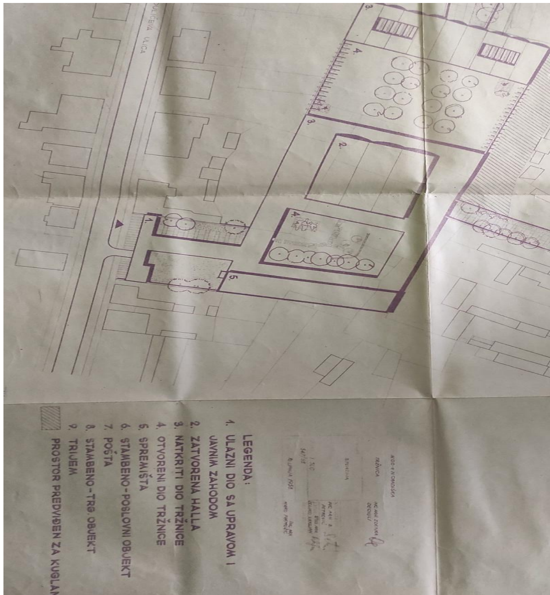
Slika 2. Prikaz urbanističkog plana izgradnje nove tržnice sa svim elementima. Fotografija je fotografirana 26. siječnja 2022. u arhivu zbog nemogućnosti skeniranja i kopiranja urbanističkog plana.