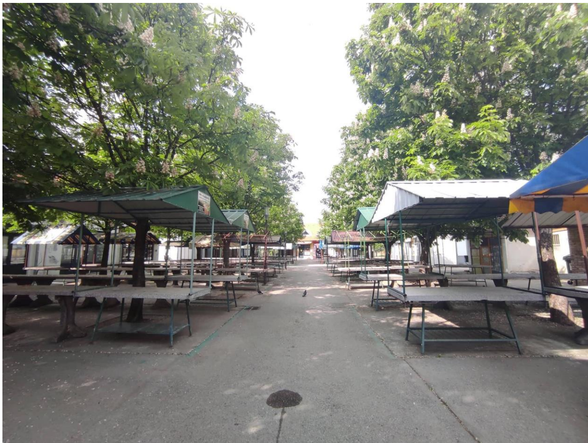
Slika 6. Otvoreni dio novogradiške tržnice s betonskim klupama i redovima drveća. Fotografija s terenskog istraživanja provedenog 09. svibnja 2022.

Nova Gradiška , još jedna ribarnica, kafić i OPG koji se bavi prodajom peradi. U natkrivenom dijelu nalazi se još betonskih klupa te je većina tih klupa rezervirano za prodavače i prodavačice mliječnih proizvoda budući da se nedavno koriste hladnjaci u prodaji istih proizvoda.