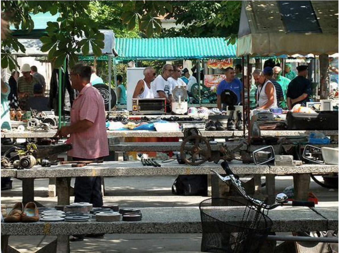
Slika 13. Buvljak na novogradiškoj pijaci. Fotografija preuzeta s mrežne stranice www.radiiong.hr . 09. svibnja 2022. godine. Autor fotografije je nepoznat.

Službeno, pijaca služi samo za opskrbu i prodaju robe na malo, odnosno poljoprivredne robe te je svaki drugi oblik prodaje zabranjen. Prilikom razgovora s jednom službenom osobom dobila sam informaciju da je to poznato, ali se ne poduzima ništa jer je to dio svakodnevnice tržnice. Buvljak je nedjeljom otvoren od 7 sati te završava sa svojim radom oko 12 sati. Većina prodavača na buvljaku su kolekcionari različitih stvari poput poštanskih markica, audiokaseta, glazbenih instrumenata i tako dalje, ali i svi ostali koji se žele riješiti viška stvari, a usput zaraditi novac. Prodavači buvljaka također izlažu svoju robu na klupama ili na parkiralištu pijace te plaćaju najam klupa ili prostora po istoj cijeni kao i prodavači Zelene tržnice . Na buvljaku, za razliku od Zelene tržnice , dozvoljeno je i cjenkanje i spuštanje cijena prodajne robe. Osim spomenute razlike, jedna od glavnih razlika 15 između buvljaka i tržnice na malo je što je buvljak zabranjen, odnosno, zabranjeno je organiziranje buvljaka na mjestu pijace na kojoj se prodaje poljoprivredna roba. Iako nadležna institucija Eko Kong naplaćuje klupe i dozvoljava rad