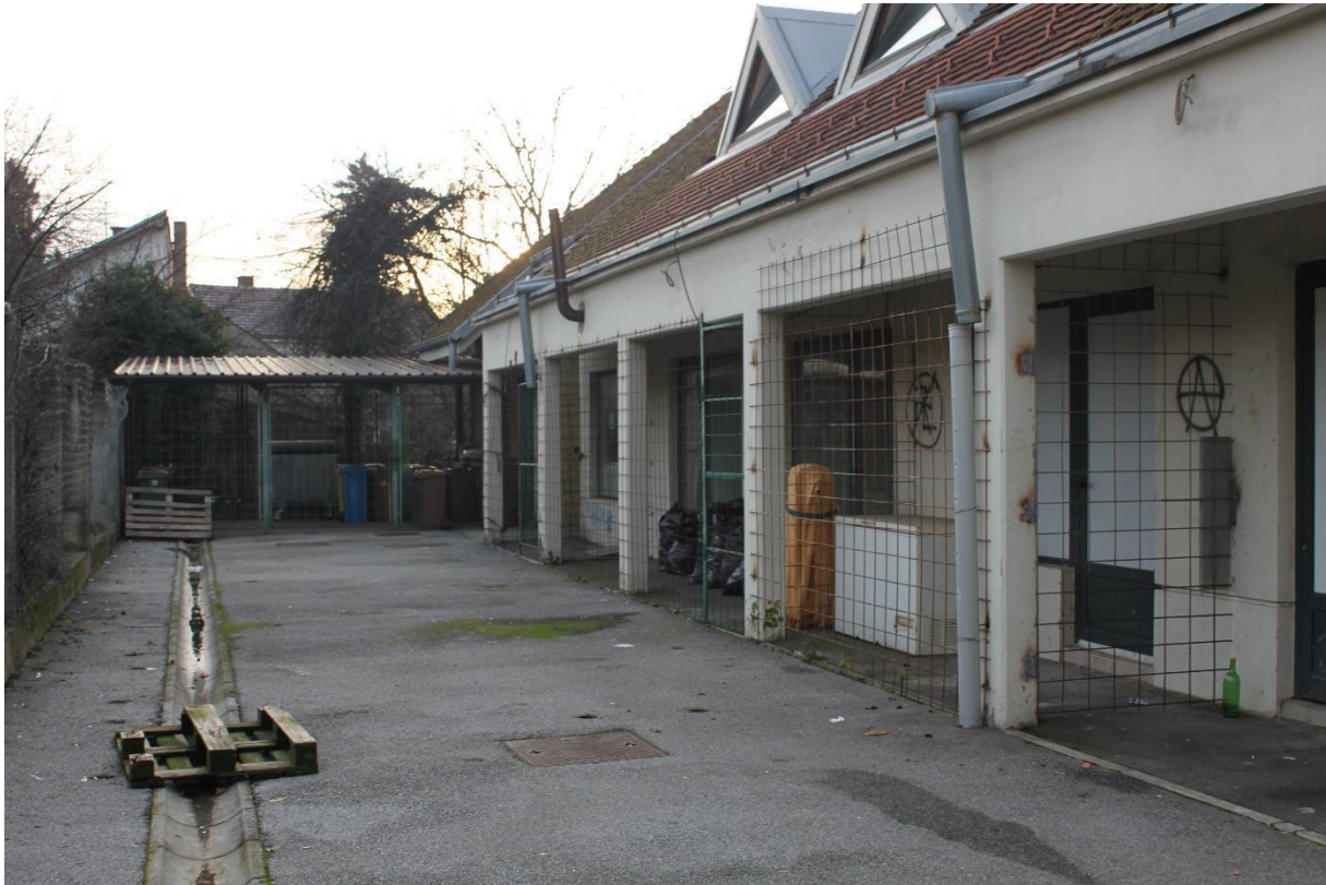
Slika 20. Prostor iza objekata koji se nalazi na pijaci , a koji za vrijeme noćnih izlazaka služi kao javni WC. Fotografija s terenskog istraživanja provedenog 10. prosinca 2021.

može se primijetiti ne samo moja insajderska pozicija, nego i način na koji se i u ovome slučaju otkrivaju nevidljiva neizgovorena znanja koja su meni kao insajderici na prvu predstavljala uobičajena znanja .