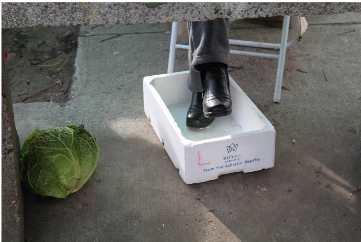
Slika 9. Marinina obrana od hladnog betona. Fotografija nastala tijekom terenskog istraživanja provedenog 10. prosinca 2021.

Osim otvorenog dijela pijace , uz njen prostor veže se i zatvoreni dio s trgovinom Konzum te gradski uredi koji su nekada bili prazni lokali. Sjećam se u srednjoškolskim danima da su spomenuti prazni lokali trebali biti namijenjeni mladima ili se bar tako pričalo, a sada su postali dio gradskih ureda. Znala sam čuti i priče o tim famoznim uredima u kojima se događaju svađe među zaposlenicima, a jedna od njih je obuhvaćala svađu između dvije radnice koje su se bojale za svoja radna mjesta budući da je novogradiški gradonačelnik Vinko Grgić završio 2020. godine u zatvoru radi primanja mita. Osobno nisam prisustvovala toj sceni, ali su mi roditelji i neke od prodavačica često znale prepričavati ovaj nemili događaj, zaboravljajući da su mi već prije to ispričali. Kada bi se pričalo o novim uredbama kojih se prodavači i prodavačice moraju pridržavati, uvijek bi u pričama prodavači pokazivali i mahali prstom na novotvorene gradske urede te govorili „To ovi tu, to je sve mafija“ ili „Tu se ne zna 'ko pije, a 'ko plaća“. U prepričavanju priča, ili bolje rečeno tračeva, koji bi kružili pijacom među prodavačima i kupcima često bi se osjećala kao da slušam radnju sapunice koja je puna zapleta radi što dramatičnijeg prikaza. A tek nakon što sam odlučila pisati o novogradiškoj pijaci u diplomskom radu i kada sam sjela za radni stol i krenula pisati sve rečeno, shvatila sam da pijaca u Novoj Gradiški ne djeluje samo kao kruh grada, nego i kao žuti tisak grada. Druga stavka koju sam