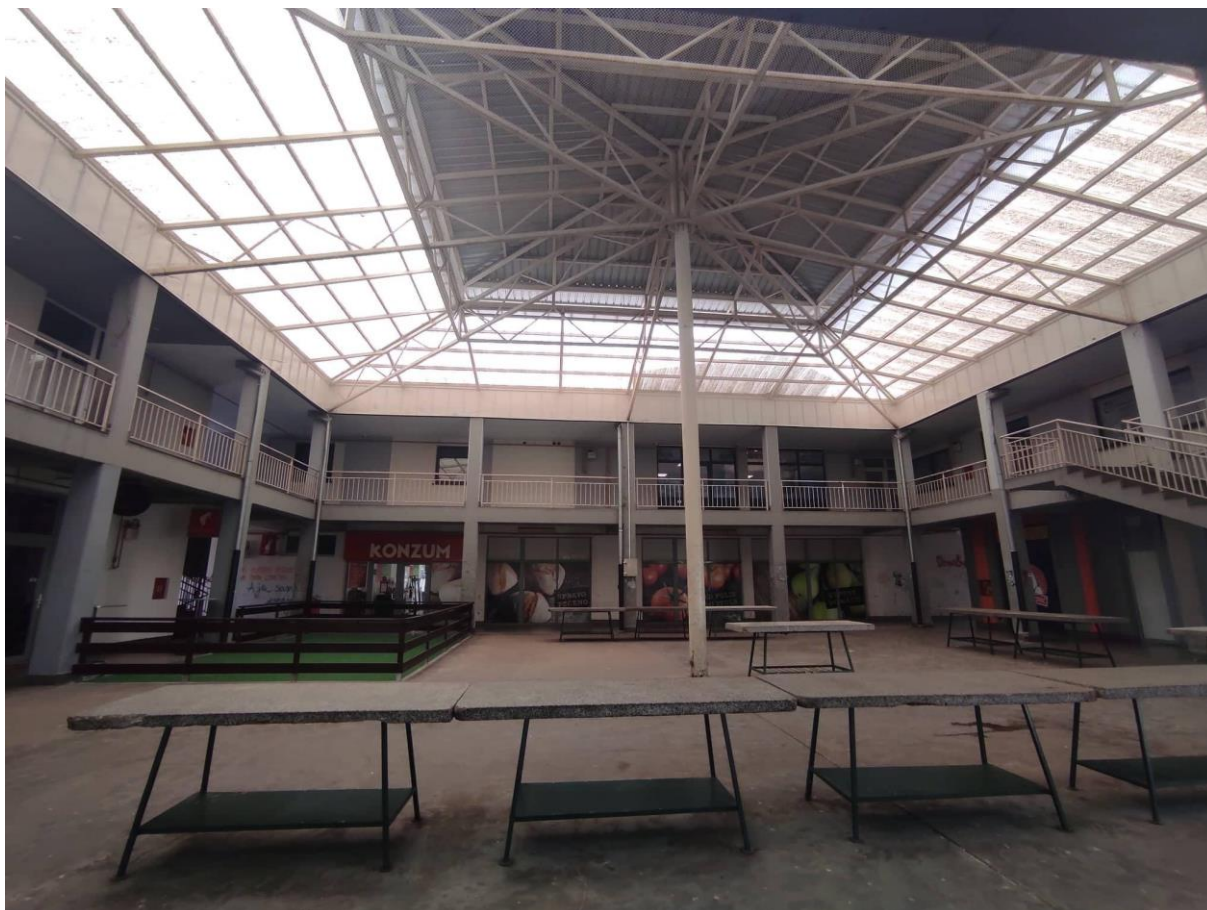
Slika 7. Zatvoreni dio novogradiške tržnice s betonskim klupama i okolo opasanim uredima, trgovinom Konzum te kafićem. Fotografija s terenskog istraživanja provedenog 09. svibnja 2022. Autorica fotografije je Barbara Jeftoski.

Na tržnici su sveukupno 122 betonske klupe za prodaju koje se daju u zakup putem javno objavljenog natječaja. U tržnom redu piše sljedeće „Prodajna mjesta daju se u zakup putem javnog nadmetanja, koje objavljuje Upravitelj, po pravilima koja su sastavni dio javnog natječaja. Postupak zakupa provodi povjerenstvo koje imenuje Upravitelj. Cijenu zakupa određuje Upravitelj u odluci o javnom nadmetanju (licitaciji)“. Iz neformalnih razgovora s prodavačima Marinom i Ljubišom saznala sam da su cijene klupa različite i mijenjaju se ovisno gdje se nalaze. Tako su, na primjer, u jednogodišnjem zakupu klupe uz prolaz skuplje nego one u sredini, kao što je naveo i Ljubiša u svom kazivanju: „A jer je u sredini, a ova je skuplja jer si odma pokraj staze. Na mjesečnoj bazi ja to uzmem, ovu sad plaćam trista, a onu ću dvjesta“. Za prodajna mjesta za koja nije sklopljen ugovor o godišnjem zakupu plaća se dnevna naknada koja danas iznosi dvadeset kuna 11 . Dnevnu naknadu ili, još poznatiji naziv, maltarinu skuplja maltar tj. tržni radnik koji se osim ovom vrstom posla, bavi i održavanjem reda i čistoće na