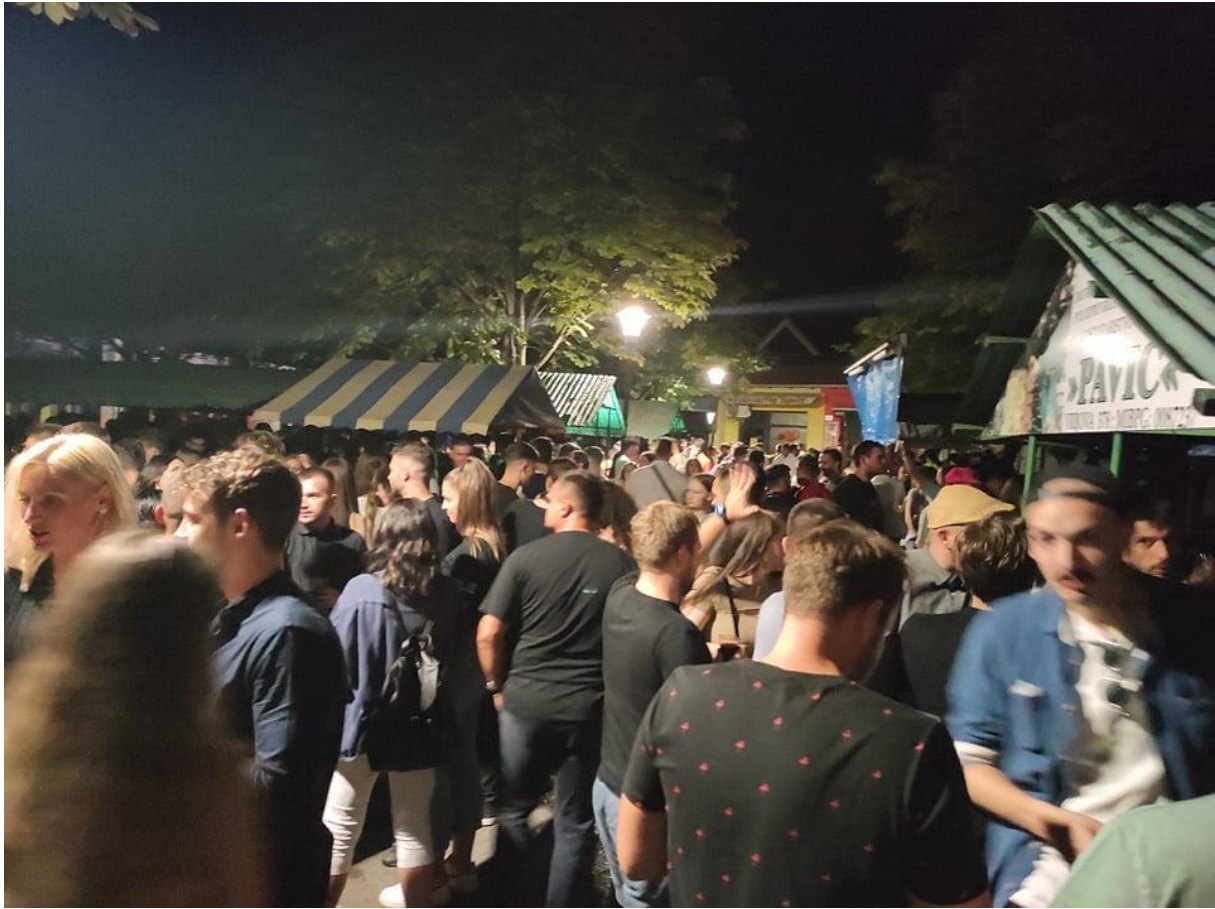
Slika 17. Okupljanje mladih na pijaci za vrijeme Novogradiškog glazbenog ljeta . Fotografija s terenskog istraživanja provedenog 15. kolovoza 2021.

„nepoznanici“ te bi se krug ljudi za našom klupom samo širio. Sami smo si pripremili pića poput bambusa i gemišta, a tko god bi došao do klupe moralo se nazdraviti.