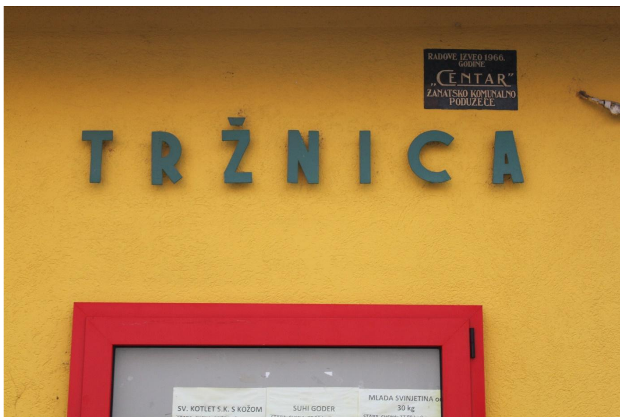
Slika 1. Ulaz iz Gundulićeve ulice u novogradišku tržnicu. Fotografija s terenskog istraživanja provedenog 10. prosinca 2021.

Iako je novogradiška tržnica izgrađena 1966. godine u Socijalističko Federativnoj Republici Jugoslaviji, „tržnica na malo“ je javna djelatnost koja datira od 1964. godine, kako je napomenuo i direktor Eko Konga 4 .