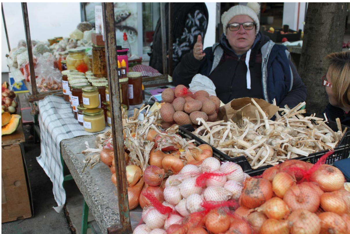
Slika 14. Prodavačice koje u pauzama od kupaca zajedno piju kavu i pričaju. Fotografija s terenskog istraživanja provedenog 10. prosinca 2021.

Navedeno kazivanje dovodi me do međusobne interakcije prodavača i pitanja na koji način njihova interakcija oblikuje pijacu . Izuzev kupaca s kojima komuniciraju, prodavači većinu vremena provode s drugim prodavačima. Ujutro popiju zajedno kavu iz aparata, dijele međusobno recepte i savjete, komentiraju društvenu i političku situaciju ili pak prenose najnovije tračeve vezane za grad i njegove stanovnike, ali si i međusobno pomažu. Prema kazivanju Marine „Vid' ove dvije sjele, jedu i piju kavu, one k'o da su restoranu. A šta ih briga, i ja isto zovem tvoju mamu da popijemo kavu. Dosadno bude pa si napravimo zabavu da nam bude ugodno“. „Ja uvijek nešto novo saznam na pijaci. Svi znaju šta se događa u gradu pa samo prepričaju i onda to kruži i dođe do mene. I da želim ne čuti, opet čujem kad izađem van popiti kavu“ prema kazivanju Ivane. Kao što se može primijetiti iz kazivanja mojih sugovornica, ali i iz mog vlastitog iskustva pijace , primjetno je da interakcija koja se događa među prodavačima stvara dinamičnost pijace te ju oblikuje kao kulturno značenjski prostor, odnosno kao mjesto susreta.