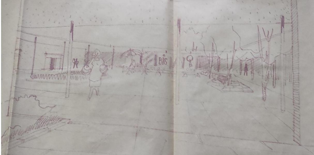
Slika 4. Prikaz otvorenog dijela tržnice s klupama za sjedenje, stablima i česmama s pitkom vodom. Fotografija je fotografirana 26. siječnja 2022. u arhivu zbog nemogućnosti skeniranja i kopiranja urbanističkog plana.

mjesta druženja i susreta je već spomenuta kulturno antropološka analiza kostarikanskih trgova Sethe Low (usp. 2010) u kojoj su klupe česti motiv koje prikazuju svakodnevnicu urbanog života sa svim njenim sudionicama iz kojih se iščitavaju razne društvene prakse.