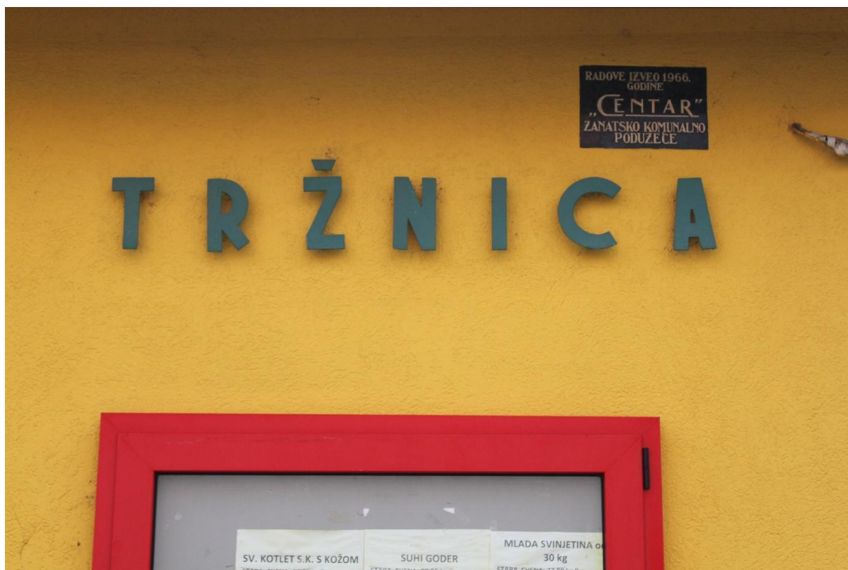
Slika 1. Ulaz iz Gundulićeve ulice u novogradišku tržnicu. Fotografija s terenskog istraživanja provedenog 10. prosinca 2021.

Iako je novogradiška tržnica izgrađena 1966. godine u Socijalističko Federativnoj Republici Jugoslaviji, „tržnica na malo“ je javna djelatnost koja datira od 1964. godine, kako je napomenuo i direktor Eko Konga 4 .