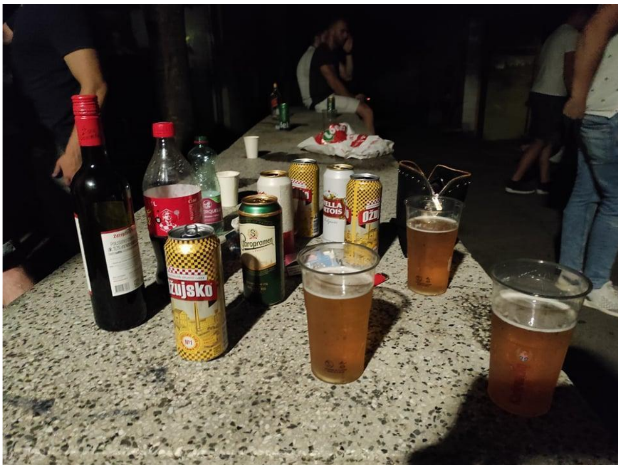
Slika 19. Noćna klupa na pijaci . Fotografija s terenskog istraživanja provedenog 15. kolovoza 2021.

„Nekako šta ja znam, standard je bio da ideš piti na pijacu prije grada i tamo je bilo sto puta bolje nego u gradu“ prema kazivanju Sonje.