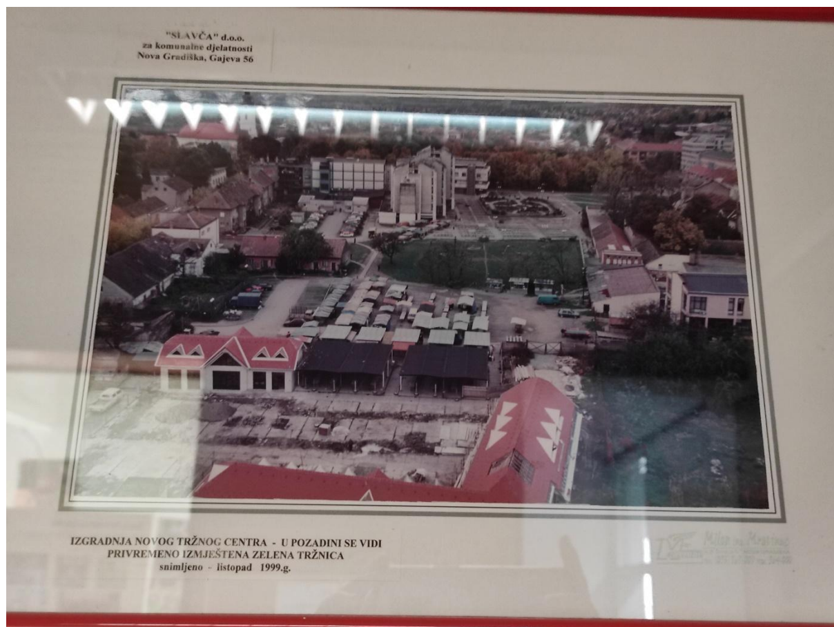
Slika 5. Prikaz tržnice iz 1999. godine prije zadnje rekonstrukcije. Crvenim krugom zaokruženo je područje tržnice. Fotografija fotografirana u zgradi Eko Konga 03. ožujka 2022.

Za prvi urbanistički plan nemam informacija je li se doista i realizirao, ali sa sljedeću fazu rekonstrukcije tržnice imam fotografiju iz 1999. godine, netom prije treće i konačne rekonstrukcije.