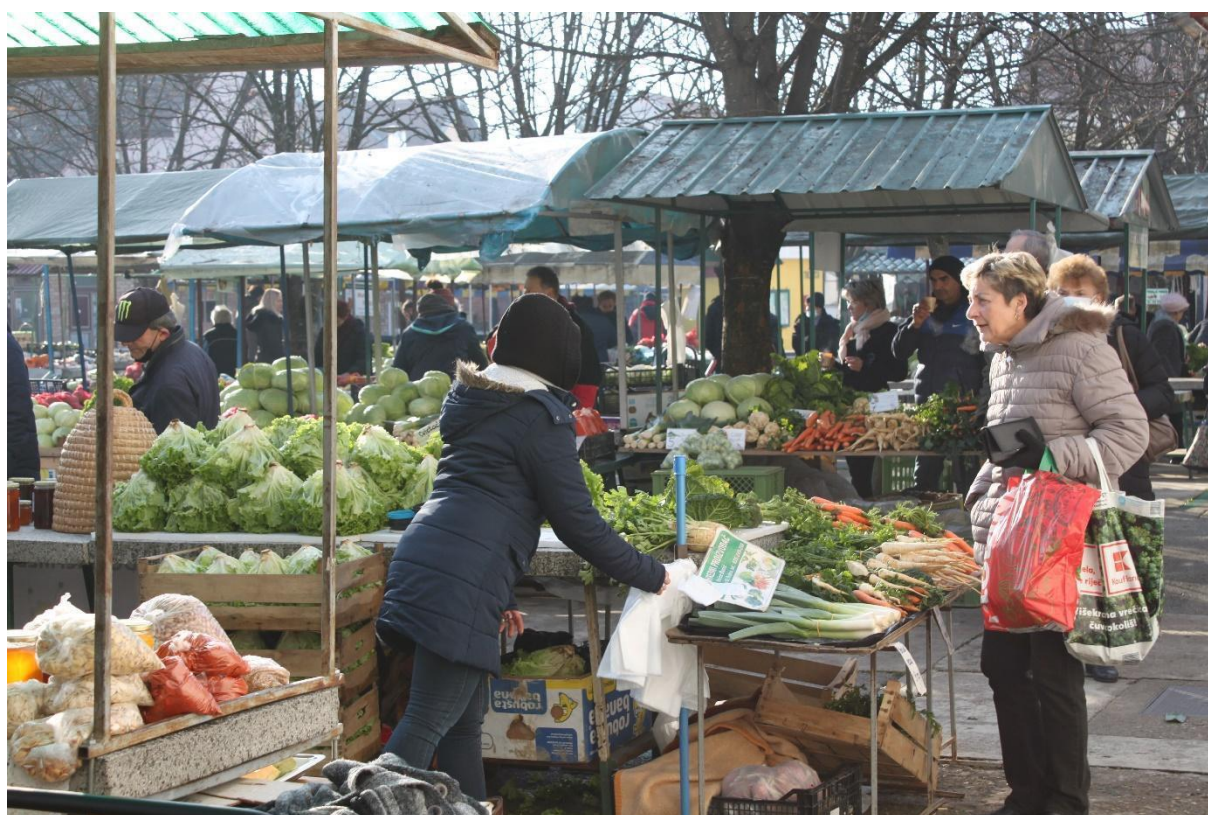
Slika 12. Trenutak razmjene između prodavača i kupca u vrijeme predblagdanskog gužva. Fotografija s terenskog istraživanja provedenog 18. prosinca 2021.

i došao novi prodavač na pijacu, direktor, maltar ili prodavači uputili bi ih koju klupu smiju ili ne smiju zauzeti. Jedne subote kada sam prodavala gljive na pijaci Slavica, koja je imala klupu iza mene, nije taj dan došla te je gospođa koja prodaje jaja stala za njenu klupu, ali ju je već nakon par minuta jedan od prodavača upozorio da je to inače Slavičina klupa i da kada se ona vrati da će morati naći novo mjesto. Obično bi oko 7 sati već sve klupe bile spremne, a prvi kupci bi krenuli dolaziti na pijacu i zajedno s njima započeo bi proces razmjene. Moj radni dan na pijaci koji bi započeo u 6 i 30 a završio oko 12 sati, većinu vremena bi glasio ovako: „Dobar dan, izvolite? -Daj mi pola kile šampinjona, ali ovih većih. I kol'ko je to?“ ili „Nema mame? Pa je'l bolesna? A baš lijepo što ju mijenjaš, kak' si ti dobra kćer“. U trenucima kada ne bi bilo toliko kupaca pričala bi s drugim prodavačicama oko mene ili bi slušala i promatrala što se događa na pijaci . Dinamičnost pijace najviše bi se osjetila oko 10 sati kada bi došao veći broj kupaca i tada bi svaki prodavač u okrilju svoje klupe prodavao svoju robu i/ili pozivao na svoju klupu „Dobar dan, svježe rajčice samo 15 kn kila“. Iako pijaca radi od ponedjeljka do petka, ipak je najveći priljev kupaca srijedom i subotom, a posebice velikim blagdanima poput Božića i Uskrsa kada bi se povećao i broj stanovnika Nove Gradiške jer bi u to vrijeme dolazili odseljenici iz Njemačke i Austrije.