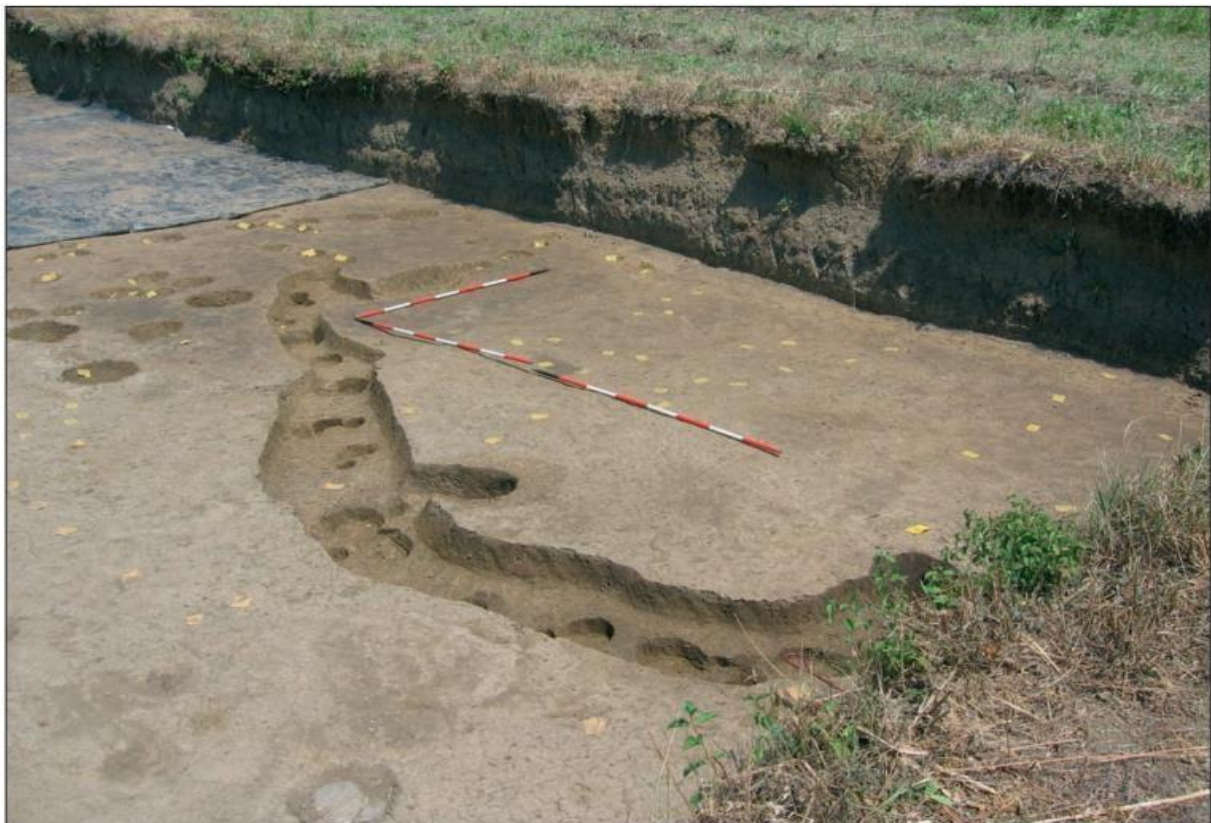
Slika 2. Jarak sa rupama od stupova koji su nosili ogradu (K. MINICHRITER, 2013., 29.)

od grobne jame nađen je jarak polukružne ograde u čije su dno također bile ukopane rupe od stupova. Namjena ograde i ukopanih stupova ovim se istraživanjima nije mogla sa sigurnošću utvrditi. Uokolo kostura pronađeno je dosta dijelova finih posuda na nozi s crvenom prevlakom i oslikanim motivima, te i nešto lonaca grube izrade. Osim toga, bilo je dosta kamenih izrađevina među kojima se ističu male glačane sjekire, a nađeni su još i noga žrtvenika, dio utega i dio diska s perforacijom koji je mogao služiti kao vreteno. Kod glave i kod nogu pokojnika pronađene su grudice okera, te su i u ovom grobu bili su prisutni "žrtveni stolovi" na čiju je funkciju ukazivala stajaća, precizno zaravnjena ploha na gornjoj strani i nezaglađena ploha na donjoj strani. Prisutnost "žrtvenih stolova" i sitnih spaljenih životinjskih kostiju, ukazuju na ritualni obred koji je ovdje proveden pri sahrani. 9