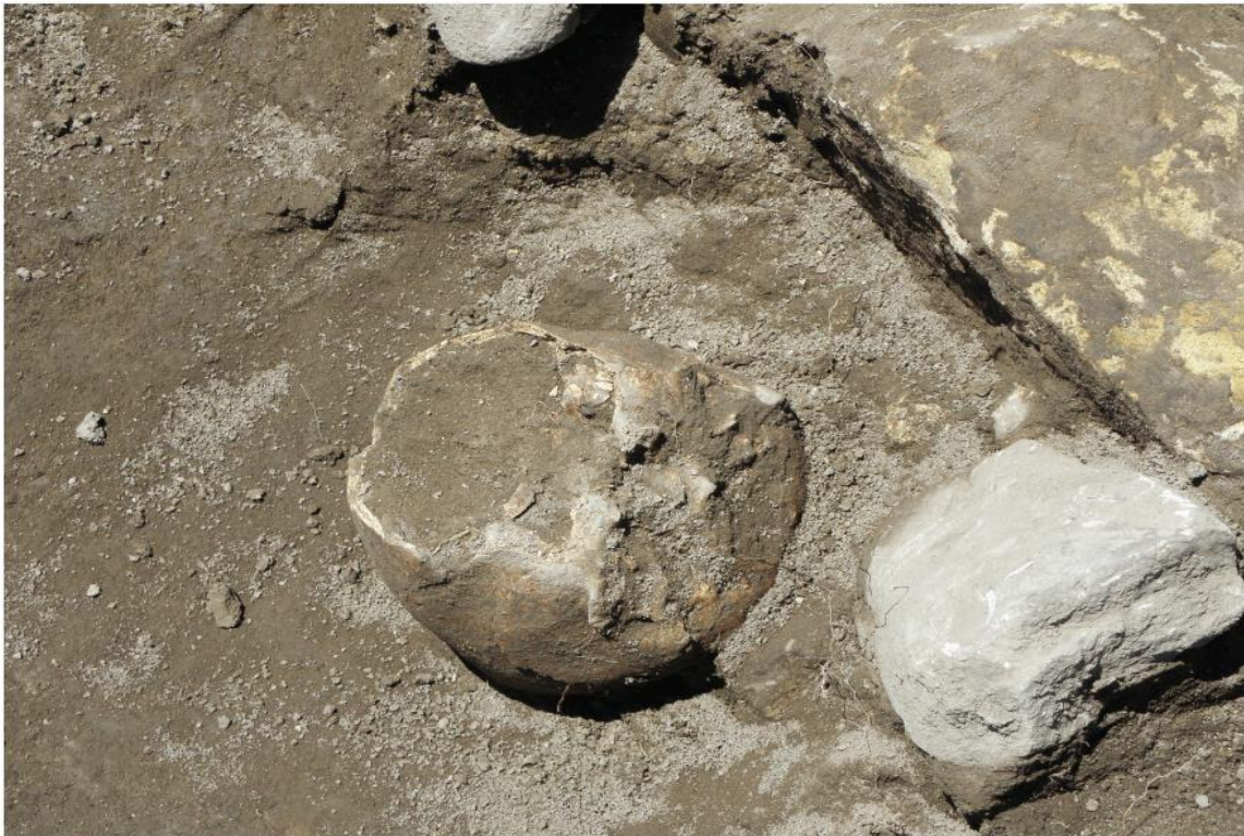
Slika 11. Ostaci dječje lubanje na lokalitetu Zemunik Donji (B.Marijanović, K.Horvat, 2016., 54.)