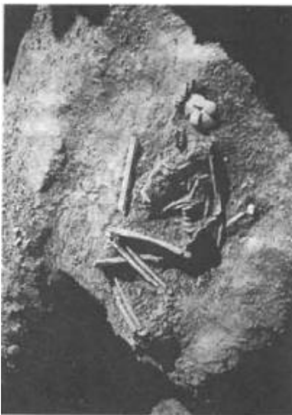
Slika 9. Ukop muškarca iz bloka 72 pronađen u srednjeneolitičkom sloju na Smilčiću (R.Zlatunić, 2003., 63.)

U srednjeneolitičkom kulturnom sloju eponimnog lokaliteta Danilo pronađena su 3 skeletna ukopa djece približno oko 4 godine starosti. Svi su sahranjeni na boku, bez grobne konstrukcije ili grobnih priloga, dva su nađena pokraj zemunične jame, dok je treći ukopan na dno jame usred naselja. 37