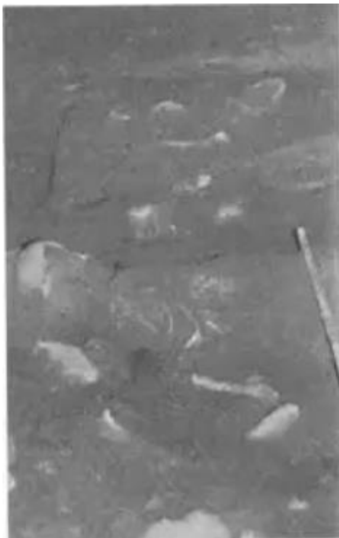
Slika 13. Ukop mlađeg muškarca i odrasle žene u Veloj Špilji (R. ZLATUNIĆ, 2003., 65.)

Špilja Pokrivenik na otoku Hvaru također je jedno od značajnih mjesta ukopa u kasnom neolitiku gdje su ostaci jedne odrasle osobe i dijelovi kostura djeteta pronađeni unutar posebne pećinske udubine. 46