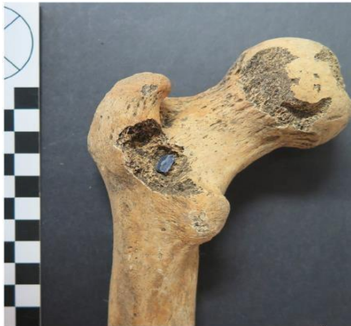
Slika 7. Dio kamenog oružja zabijen u femuru odraslog muškarca iz Smilčića (I.JANKOVIĆ et al., 2020., 3.)

Novijim istraživanjima na prostoru Smilčića iz 2017. godine, otkrivene su kosti najmanje 3 jedinice. Na temelju keramičkog materijala koji nosi obilježja impreso keramike, pronađenog u nastambama između kojih su kosturi bili pokopani, ukope možemo ih datirati u rani neolitik. U jugoistočnom djelu lokaliteta, unutar groba 2 pronađeni su ostaci kostura odraslog muškarca s ozljedama koje pokazuju da se ovdje možda radi o prvom slučaju ubojstva na našim prostorima. Oko kostura nije bilo grobnih priloga, a ležao je u zgrčenom položaju na boku, te je imalo vidljive tragove tjelesnih ozljeda. Osim tragova gladovanja koji su bili vidljivi po zubima i kostima, najznačajniji trag moguće nasilne smrti je kameni šiljak zabijen u stražnji dio bedrene kosti, a ovdje se smatra da se vjerojatno radi o vrhu koplja. Detaljne analize kostiju pokazale su i da pokojnik nije preminuo odmah nakon nanesenih ozljeda, već kasnije od posljedica infekcije. S ovim slučajem, možemo usporediti nekoliko nalazišta na području Europe gdje su u grobovima dokumentirani tragovi nasilja, primjerice na nekim nalazištima Kulture linearno-trakaste keramike u centralnoj Europi kao što je lokalitet Asparn/Schletz. 28