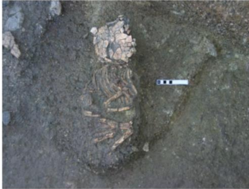
Slika 10. Ukop djeteta u rovu A na lokalitetu Danilo (A. Moore et al., 2007., 16.)

Bitno je napomenuti i kako je iskopavanjima 2005. na lokalitetu Danilo, unutar rova A iskopan još jedan ukop djeteta pored ognjišta. 39