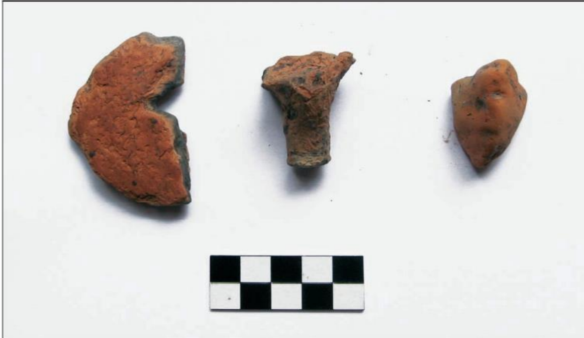
Slika 3. Neki od priloga uz tijelo pokojnika (K.MINICHREITER, 2013., 30.)

Bitno je napomenuti postojanje još dva lokaliteta koji spadaju u posljednju fazu Starčevačke kulture, a to su Vukovar i Jaruge Godevo. U Vukovaru na području gimnazije u podrumskim prostorijama, pronađene su zemunice s ukopima 3 djeteta i dvije odrasle osobe u zgrčenom položaju, a nekoliko sličnih ukopa registrirano je i na lokalitetu Jaruge Godevo. 10