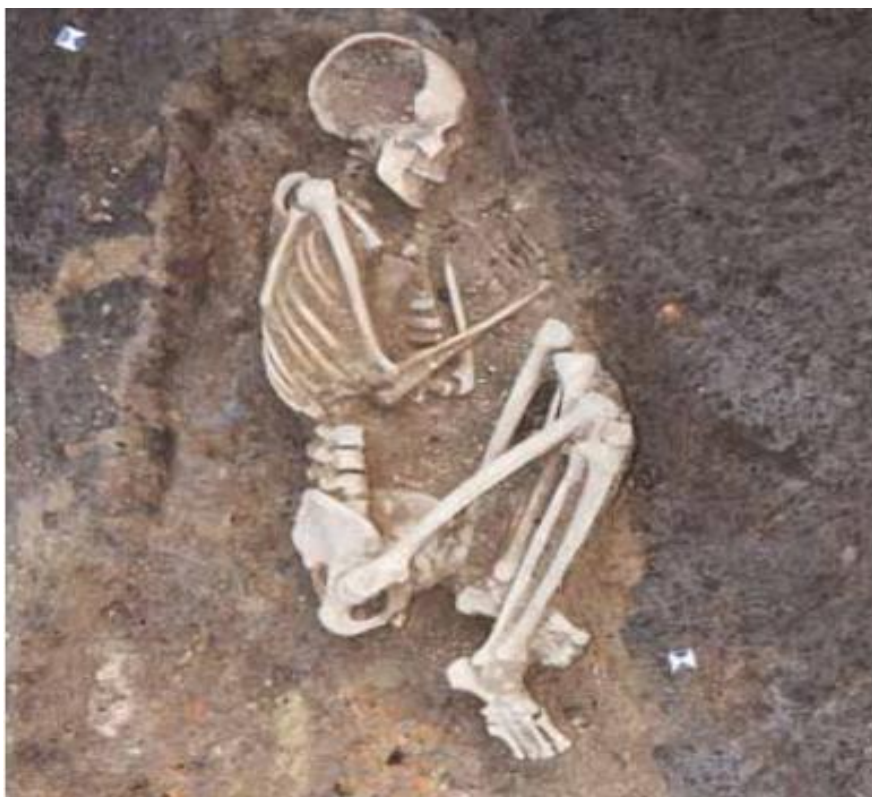
Slika 4. Grob Sopotske kulture na položaju Hermanov vinograd (J.Balen, T.Hršak i R.Šošić Klindžić, 2014., 67.)

Osim navedenih lokaliteta, ukopi u zgrčenom položaju na boku otkriveni su i na položajima Kaznica-Rutak, Stari Perkovci-Debela Šuma, Belišće, te jedan slučajan nalaz iz Radovanovaca u Požeškoj kotlini gdje je u neposrednoj blizini kostura, otkrivena keramika koju prema obilježjima pripisujemo Sopotskoj kulturi. 18