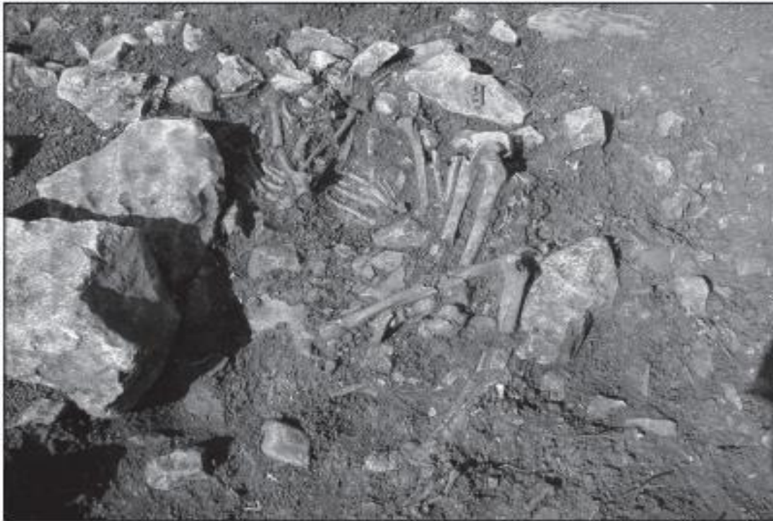
Slika 8. Grob odrasle žene iz Crnog Vrila kraj Zadra (B.Marijanović, 2003., 39.)