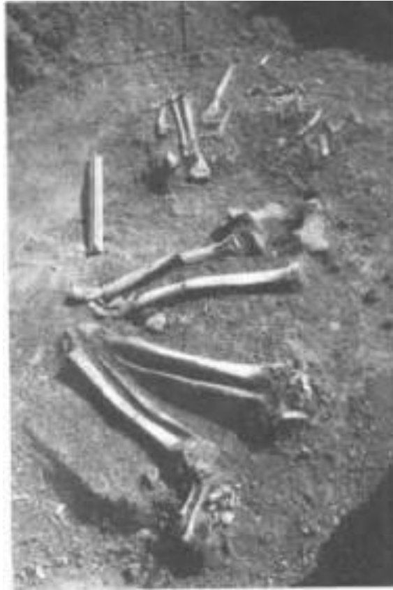
Slika 6. Kostur mladog muškarca kojem nedostaje lubanja iz bloka 64 na lokalitetu Smilčić (R.Zlatunić, 2003., 62.)

Osim kostura mladog muškarca, u zapadnom sektoru bloka 13, pronađen je kostur djeteta pokopanog u zgrčenom položaju s glavom okrenutom prema sjeveroistoku bez prisutnosti grobnih priloga ili tragova grobne arhitekture. Starosna dob djeteta procijenjena je na 8 godina, a ležao je položen u pravcu zapad-istok, na lijevom boku, a kosti su kao i lubanja bile slabo sačuvane, raspucane i razlomljene. 25