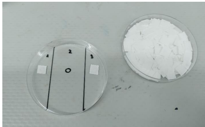
Slika 6. Petrijeva zdjelica sa filter papirom (E. Šimetić)

Svaka zdjelica podijeljena je na tri jednake zone označene brojevima 1, 2 i 3. U svakom od označenih područja nacrtane su kružne oznake (Ø ≈ 1 cm). Na kružne oznake sa lijeve i desne strane, odnosno u zone 1 i 3, stavljen je, pincetom, komadić filter papira tako da prekrije oznaku. Središnja kružna oznaka ostavljena je prazna (slika 6). Pripremljeno je sveukupno 30 Petrijevih zdjelica.