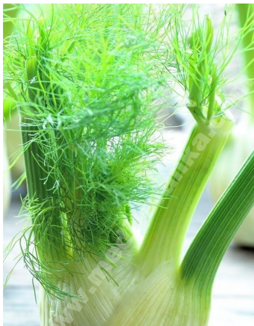
Slika 2. Tanki listovi koromača