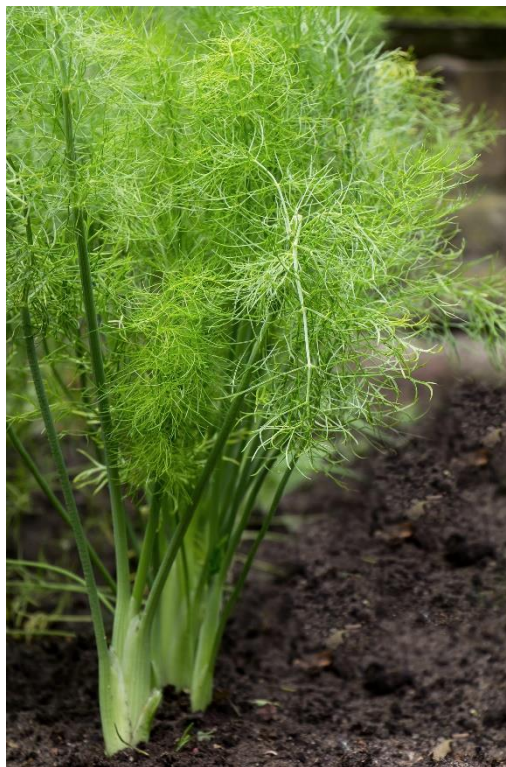
Slika 1. Razgranata stabljika koromača ( Foeniculum vulgare )

Obični gorki koromač ( F. vulgare ) iz porodice štitarki (Apiaceae) u pravilu je dvogodišnja zeljasta biljka, a ovisno o podneblju može biti jednogodišnja ili višegodišnja. Biljka naraste do dva metra sa uspravnom i od dna razgranatom stabljikom (slika 1). Biljka koromač se uzgaja, zapravo uspijeva i raste gotovo svugdje po Sredozemlju. Ima raširen areal, a prirodno raste u zemljama južne Europe na zapuštenim površinama. Kultivira se zbog eksploatairanja kao začinska biljka, kao povrće ili ljekovita biljka.