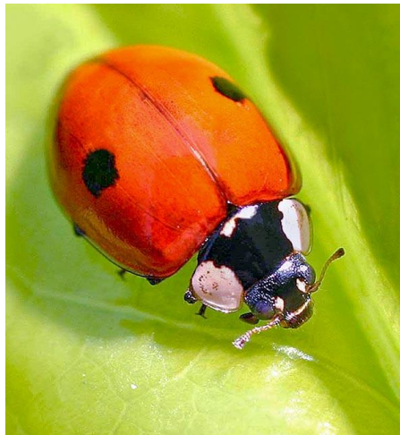
Slika 3. Dvotočkasta božja ovčica ( A. bipunctata )

Adalia bipunctata L. ili crvena dvotočkasta božja ovčica ima, kako ime govori, na crvenim krilima dvije crne točke (slika 3).