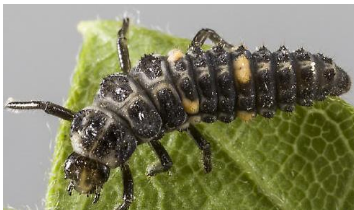
Slika 4. Ličinka dvotočkaste božje ovčice

Hrani se biljnim ušima, dakle afidofagni je kukac te u odraslom stadiju dnevno može pojesti do 60 jedinki ušiju. Godišnje ima jednu generaciju u, a prezimljuje kao odrasli oblik u hibernaciji. Ličinka ovog kukca je tamnosive boje sa sitnim narančastim pjegama, a tijelo je prekriveno dlačicama (slika 4).