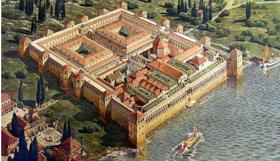
Slika 1 Dioklecijanova palača