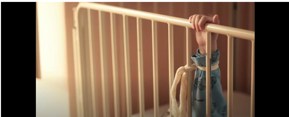
Slika 7.