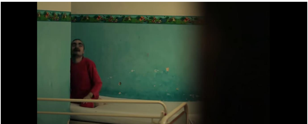
Slika 12.

Fokus je većim dijelom stavljen na lica koja prelaze preko objektiva kamere, a pogledi uglavnom nisu fokusirani na kameru. Video je kolaž različitih detalja od kojih su dominantni oni vezani za lice i detalji tijela. Lica su uhvaćena u trenucima distanciranosti i njihov fokus nije u komunikaciji, već je fokus na našem pogledu. Jedna fotografija jasno pokazuje kako je dijete snimano izvan sobe, kroz zrcalo. Dio fotografija se fokusira na tijela djece, tijela koja su vezana za krevete. Nije potrebno posebno naglašavati kako je vezanje djece za krevet praksa koja krši gotovo sve zakone i konvencije i dopuštena je tek u