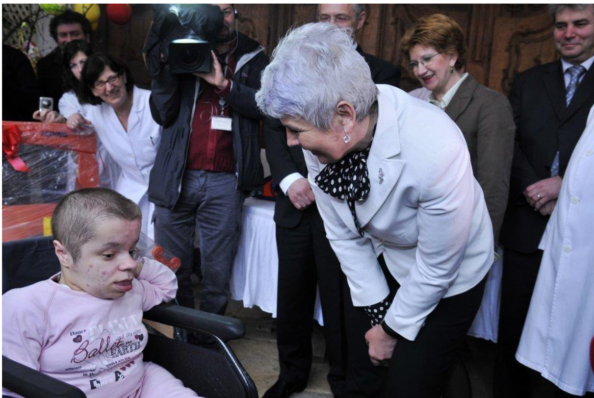
Slika 1.

Život djece u bolnici kao i razvoj medijski eksponiranih humanitarnih akcija (od kojih je među najpoznatijima “RTL pomaže djeci”) postaje platforma za političku razmjenu života. Biopolitičko zahvaćanje života se pokazuje nedovoljno u načinu na koji se voajerizam i direktna uključenost u živote onih koji služe kako bi bili inspiracija (inspiracijska pornografija), ali čak i puno više; ljubav se transformira u direktnu intervenciju u tijela djece kroz naše gledanje, praćenje, diranje, uživljavanje.