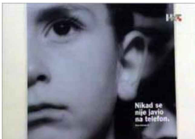
Slika 16. Isječak iz TV kampanje „Dajmo da čuju“ prikazane na HRT-u.

Ovo čini integralni i implicitni dio priče koji se želi naglasiti. Razloge zašto ovu priču trebamo smatrati „lijepom“ pronalazimo u vezi s određenom mobilizacijom sentimenta u razgraničavanju medicinskog i političkog. Suočeni smo s djetetom koje ne