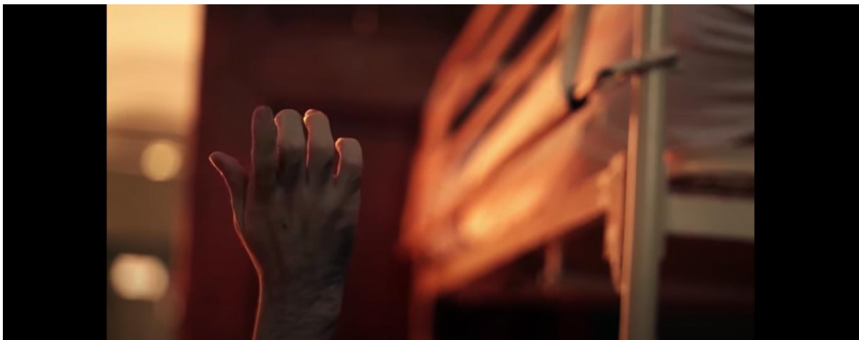
Slika 8.