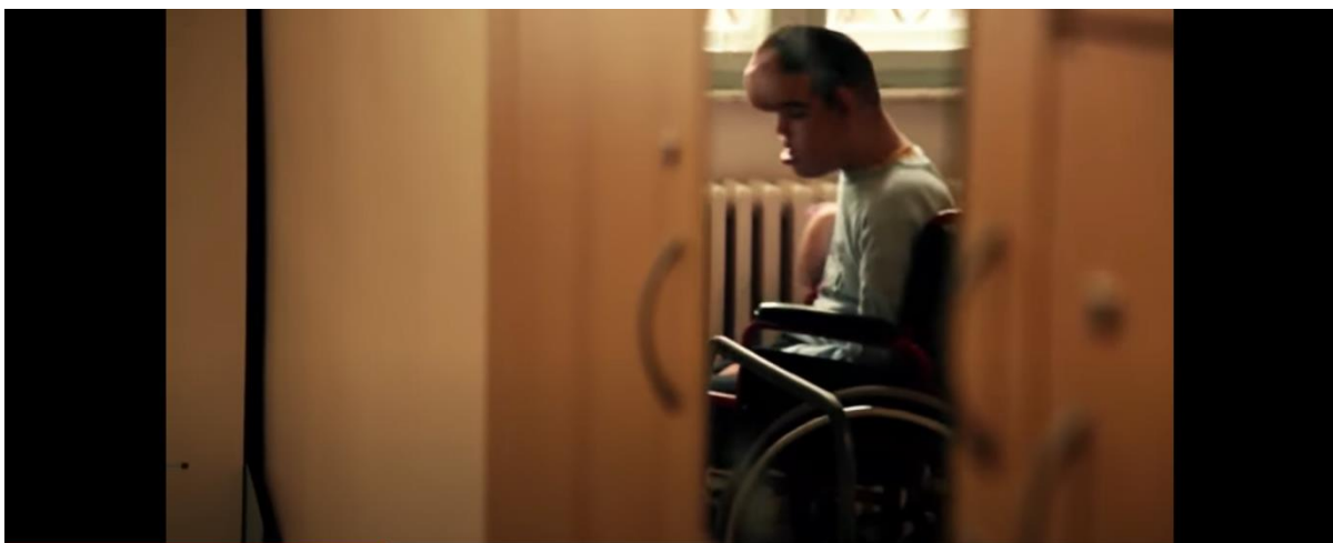
Slika 6.