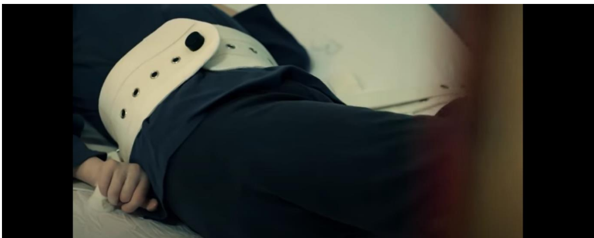
Slika 4.