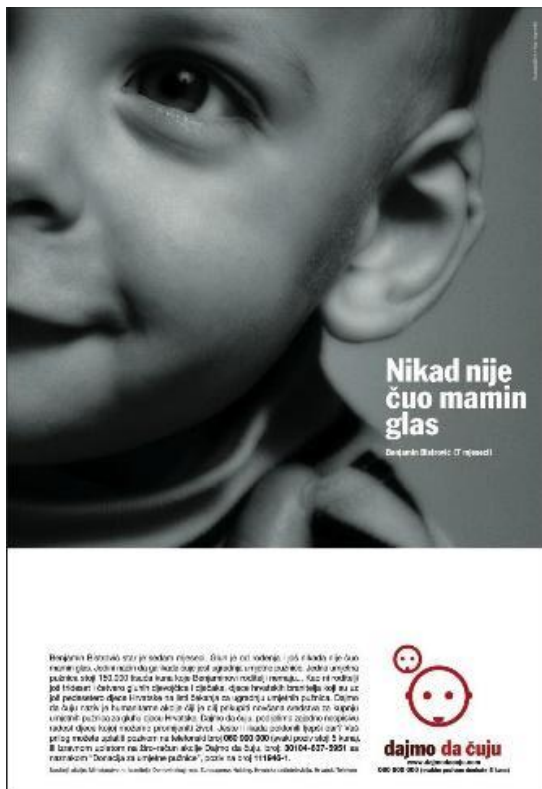
Slika 15. Plakat humanitarne akcije „Dajmo da čuju“.