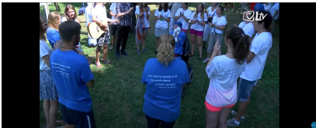
Slika 13. Slika iz YouTube videa „Gornja Bistra – mjesto iskustva evanđeoske ljubavi“ Laudato TV-a.

Mladi volonteri u bolnici u Gornjoj Bistri dolaze u kontakt sa životom i tako nauče voljeti život. Nauče voljeti život, ali život kojega, po njima, tamo nema. Djeca u bolnici su medijator u potrazi za životom i ljubavi prema istom. Djeca iz bolnice postaju mistični token u zahvaćanju života. Na kraju reportaže o volonterima 122 prikazana je jedna aktivnost gdje su volonteri u krugu i pjevaju „Mi želimo! Uzdić Isusa!“. Jedina osoba koja je pacijent u bolnici nalazi se unutar kruga, kao lokus pažnje i ono na što se svi fokusiraju.