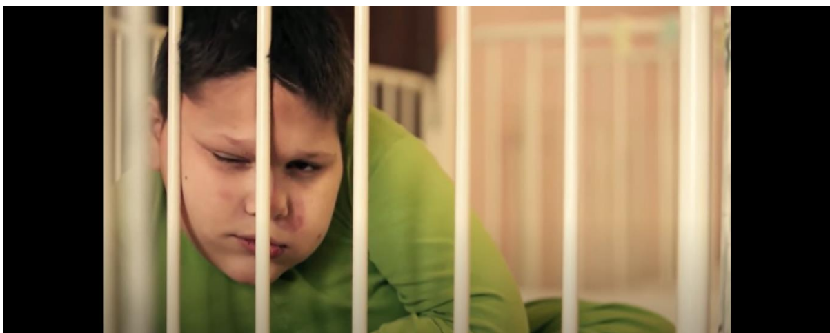
Slika 9.