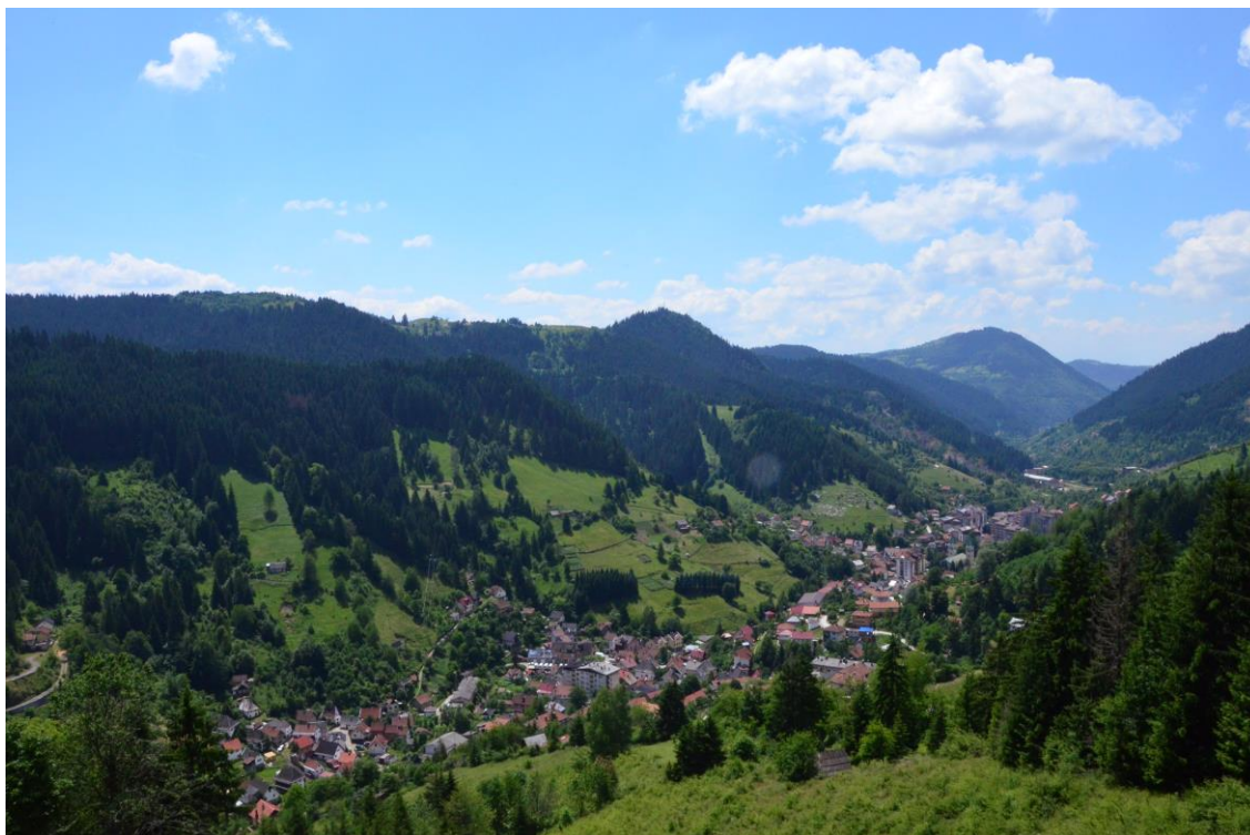
Slikovni prilog 1. Pogled na Vareš

Vareš se nalazi u srednjoj Bosni i Hercegovini i ondje smo se kao grupa od šest studenata zadarskog sveučilišta, pod mentorstvom profesora Maria Katića, uputili 2015. godine sa svrhom provedbe etnografskog istraživanja. 1 Smješten je u kanjonu rijeke Stavnje, okružen šumom te planinama Perunom i Zvijezdom (pogledati slikovni prilog 1). Tijekom boravka na terenu imala sam priliku posjetiti samo neka od naselja koja pripadaju općini: Vareš, Stricu, Zaruđe, Pogar, Pržiće, Borovicu i Vijaku. U Varešu je moguće pronaći nekoliko kafića i dućana, dva ili tri restorana, od kojih se jedan nalazi izvan centra, klub umirovljenika, knjižnicu, crkvu, i džamiju. Prolazeći ulicama grada uočit će se mješavina urbanog i ruralnog stila gradnje; zgrade karakteristične za vrijeme socijalizma te kamene ili drvene kuće starijih vremena, a sve to okruženo zelenilom prirode.