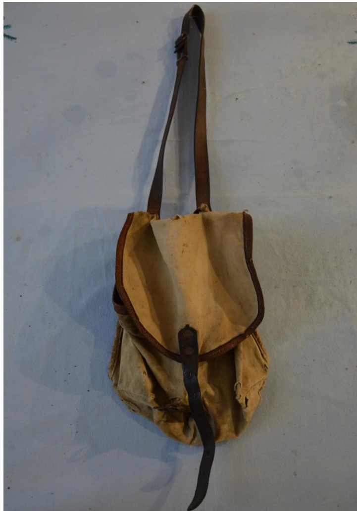
Slikovni prilog 6. Rudova torba za užinu