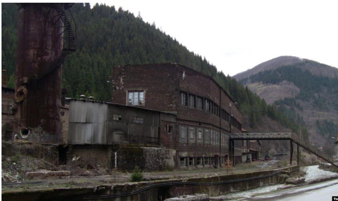
Slikovni prilog 2. Napuštena vareška tvornica