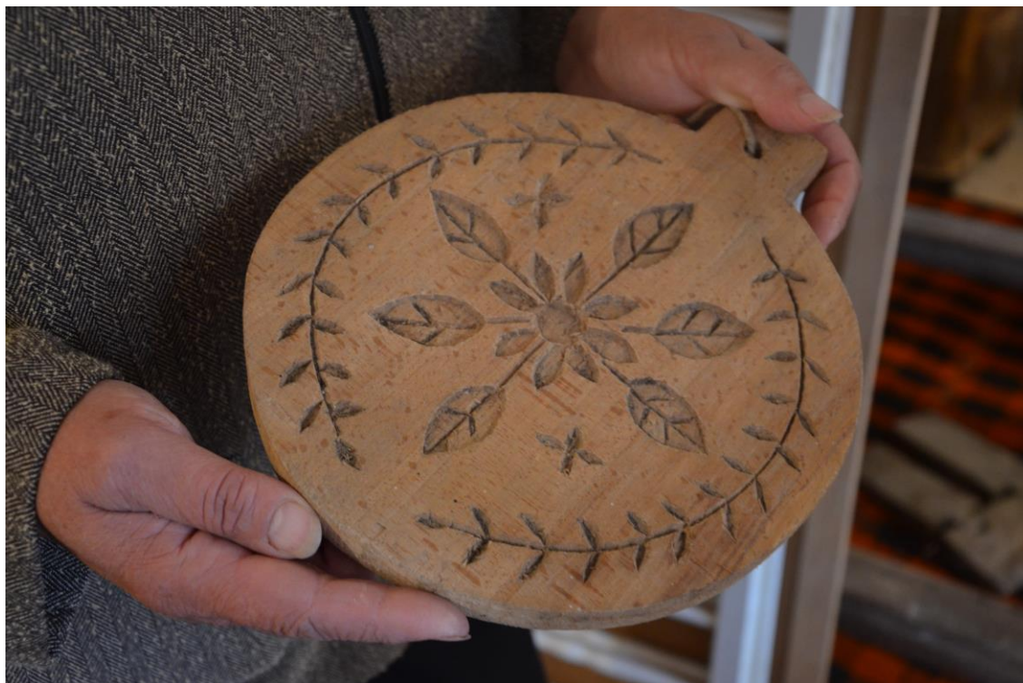
Slikovni prilog 4. Drveni kalup za paprenik

radnici nekoć koristili, a zatim nastavlja do preslice hvaleći se svojim sposobnostima pređenja.