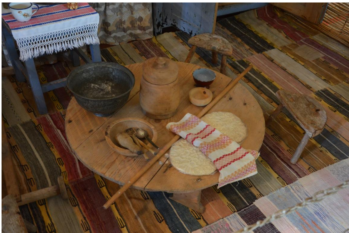
Slikovni prilog 8. Sinija

prilikom druženja u Pržićima. Iz njegove kratke priče možemo zamisliti obitelj za sinijom koju opisuje Žuljić, djecu koja se odupiru pogledati u televizijski ekran ne bi li zbog toga izgubila zalogaj i takva kompletna slika nam prašnjavu siniju u rijetko posjećenoj zbirci čini poznatijom i bližom (Pogledati slikovni prilog 8). Za Varešana ta sinija započinje proces Heiddegerova svjetovanja. Prepričavajući svoju priču dopušta nam da na kratko vrijeme budemo prisutni za njegovim obiteljskim stolom i sudjelujemo u toj situaciji.