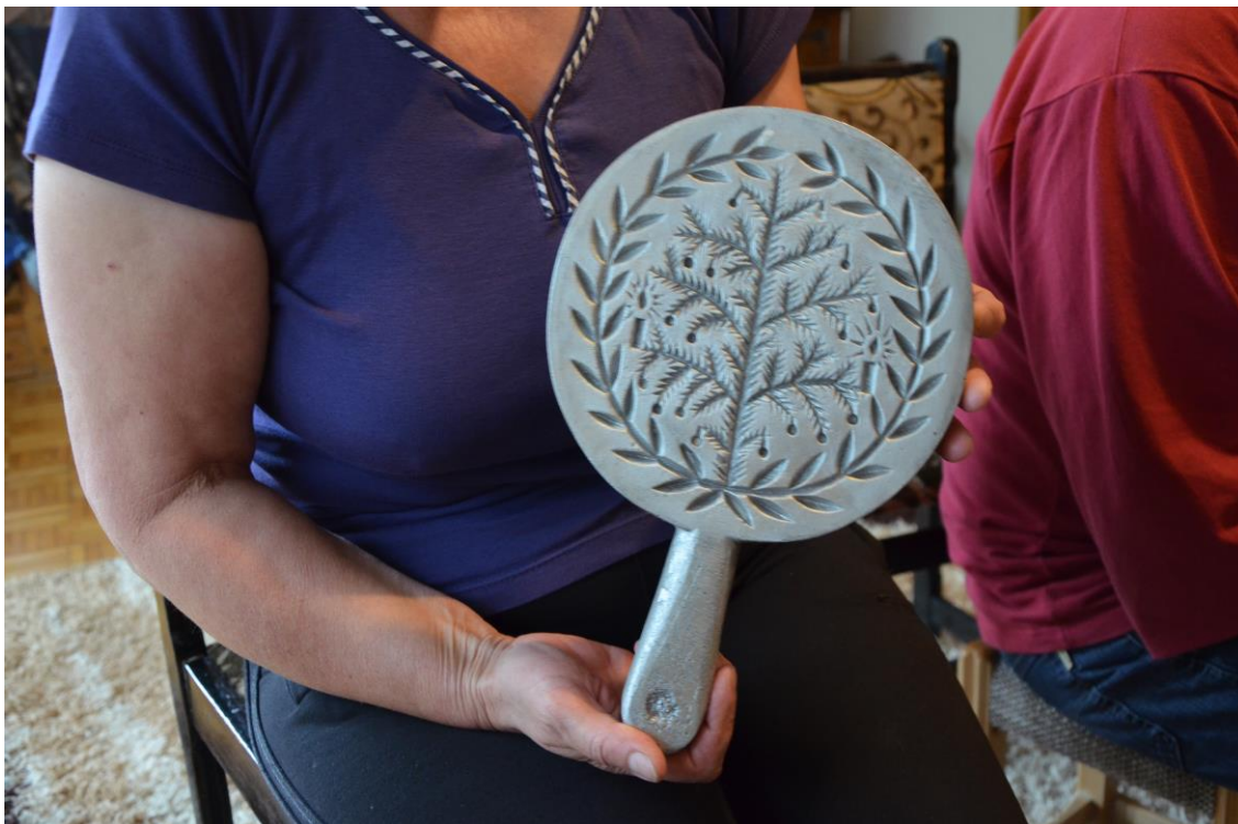
Slikovni prilog 5. Metalni kalup za paprenik