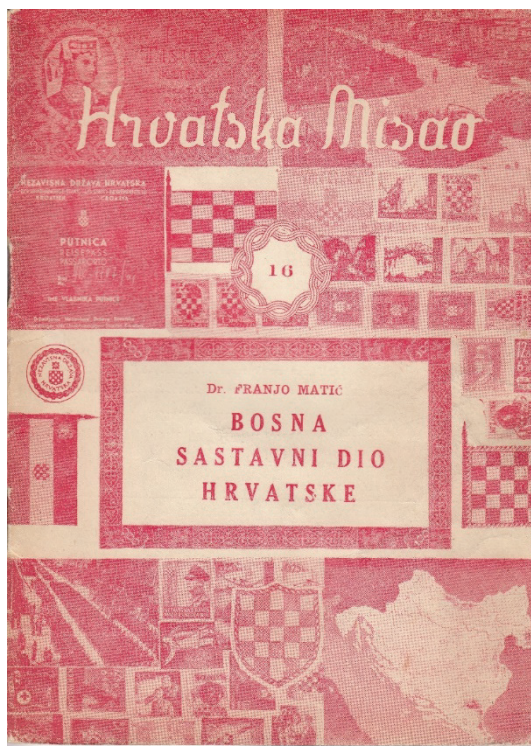
Slika 3. Korice 16. sveska (1956) časopisa Hrvatska misao

Hrvatska politička emigracija uspostavlja polje ili lanac ekvivalencije između doma, domovine, države i NDH, koja u njihovoj imaginaciji tako postaje mitsko pripadajuće mjesto, mjesto pripadanja i mjesto žudnje, a narativi doma i domovine dominantni narativi u konstrukciji njihovog identiteta. Uspostavljeni lanac ekvivalencije, koji poistovjećuje dom, domovinu, državu i NDH, produkt je etnicizacije i primordijalne konstrukcije te esencijalizacije konstitutivnih normi identiteta narativizacijom. Korelacijski odnosi narativa povijesti, tla, „krvi i krvne vezanosti“ i obitelji s narativima doma i domovine pojačavaju učinak etnicizacije, naturalizacije i esencijalizacije konstrukcije pripadanja domovine – države naciji. Hage (2000: 42) ističe kako: „diskurs doma, zato što sadrži odnos prema naciji, prvenstveno kao nekoj vrsti objektivističke definicije nacije, jasno implicira, ne samo sliku nacije koju je netko kreirao, već i sebe kao onoga koji zauzima privilegiranu poziciju u odnosu prema naciji, privilegirani način nastanjivanja nacije“. U tom kontekstu samoreprezentacija hrvatske poslijeratne političke emigracije kao državotvorne označava uspostavljenju relaciju odnosa pripadanja i pripadajućeg spram tako konstruiranog