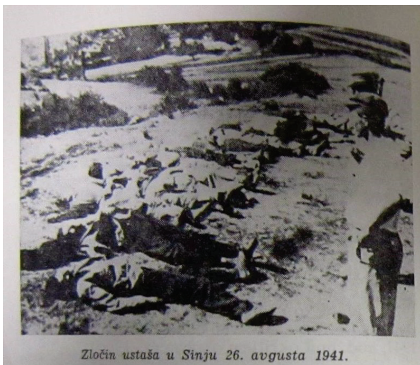
Slika 7. Fotografija ustaških zločina na stranici 89. u knjizi Politička emigracija: aktivnost političke emigracije protiv samoupravne socijalističke Jugoslavije i njenih oružanih snaga Stjepana Domankušića i Milivoja Levkova

povrede, odnosno nanošenja boli i patnje ( likvidacija, zločini ). U ovom slučaju proizvodnja emocija straha i strepnje vezana je istovremeno emocijama boli i patnje kao uzrokom i izvorom, implicirajući prethodna traumatska iskustva prošlosti u kojima je uzrok i izvor boli i patnje. Tekstualna proizvodnja emocija pojačana je korištenjem fotografija pri čemu fotografiju treba sagledati kao dio iskaza koji ima svoje učinke odnosno proizvodi značenja te izvodi i proizvodi emocije. Proizvodnja emocija usmjerena je na, s jedne strane, povezivanje individualne i kolektivne razine, a s druge strane, ne samo na kreiranje, već i homogenizaciju kolektivnog subjekta proizvodnjom stalne ugroze i prijetnje Drugim.