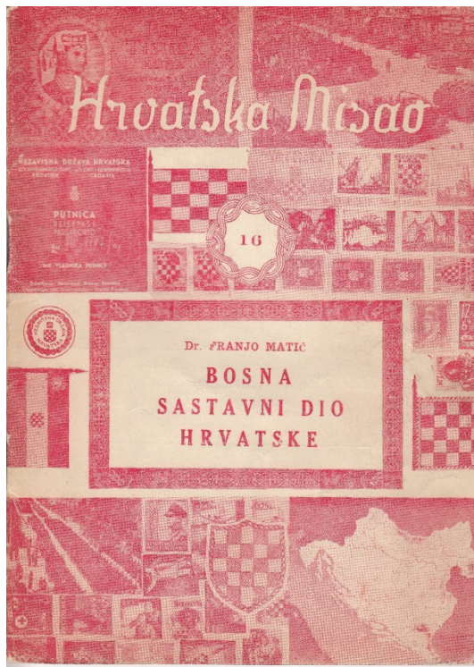
Slika 3. Korice 16. sveska (1956) časopisa Hrvatska misao

Hrvatska politička emigracija uspostavlja polje ili lanac ekvivalencije između doma, domovine, države i NDH, koja u njihovoj imaginaciji tako postaje mitsko pripadajuće mjesto, mjesto pripadanja i mjesto žudnje, a narativi doma i domovine dominantni narativi u konstrukciji njihovog identiteta. Uspostavljeni lanac ekvivalencije, koji poistovjećuje dom, domovinu, državu i NDH, produkt je etnicizacije i primordijalne konstrukcije te esencijalizacije konstitutivnih normi identiteta narativizacijom. Korelacijski odnosi narativa povijesti, tla, „krvi i krvne vezanosti“ i obitelji s narativima doma i domovine pojačavaju učinak etnicizacije, naturalizacije i esencijalizacije konstrukcije pripadanja domovine – države naciji. Hage (2000: 42) ističe kako: „diskurs doma, zato što sadrži odnos prema naciji, prvenstveno kao nekoj vrsti objektivističke definicije nacije, jasno implicira, ne samo sliku nacije koju je netko kreirao, već i sebe kao onoga koji zauzima privilegiranu poziciju u odnosu prema naciji, privilegirani način nastanjivanja nacije“. U tom kontekstu samoreprezentacija hrvatske poslijeratne političke emigracije kao državotvorne označava uspostavljenju relaciju odnosa pripadanja i pripadajućeg spram tako konstruiranog