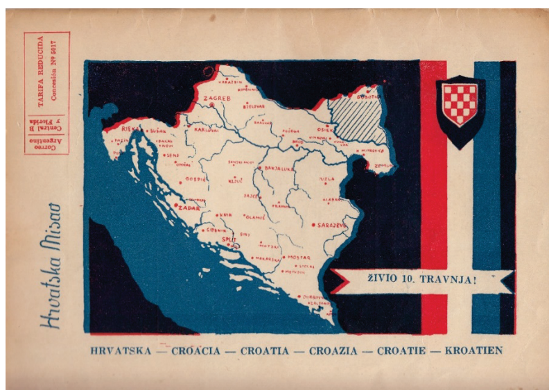
Slika 2. Stražnji dio korica 6. sveska (1954) časopisa Hrvatska misao

Rijetki slikovni prilogi u Hrvatskoj misli usmjereni su upravo na prikaz (izvođenje i proizvođenje) NDH kao geografskog (teritorija) i društvenog prostora (slike 2. i 3.), na imaginiranje onoga što je za hrvatsku političku emigraciju označeno i što ona označava kao dom i domovinu.