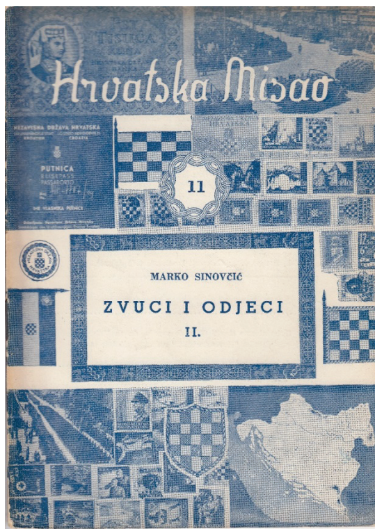
Slika1. Korice 11. sveska (1955) časopisa Hrvatska misao