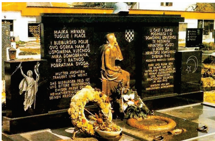
Slika 6. Nadgrobni spomenik na groblju u Unter-Loibachu 55

Diferencijacija etničkog koncepta, odnosno etničnost kao konstitutivna norma, koja lancem ekvivalencije ( Srbi = Jugoslaveni ) konstruira Drugog koji ugrožava, a koji se hladnoratovskim diskursom i lancem ekvivalencije uspostavlja i kao komunist „neprijatelj“ ( Srbi = Jugoslaveni = komunisti... ) pomičući pri tome kontekst, odnosno isključivši povijesni kontekst Drugog svjetskog rata, uspostave i karaktera NDH te ustaških zločina i antagonizam fašističkog i antifašističkog diskursa, transferira „izvor i uzrok povrede i patnje“ u hladnoratovski diskurs i kontekst, odnosno hladnoratovski kontekst i diskurs se transferiraju kroz vrijeme te svojom protežnošću zahvaćaju prošlost, sadašnjost i budućnost povezujući ga s konstitutivnim nasiljem . Može se reći da konstitutivno nasilje hrvatskog nacionalističkog imaginiranja povezuje različite točke povijesti lancem ekvivalencije čineći citatni lanac konstitutivnog nasilja te time pojačava njegov učinak. Tako se povezuje represija Kraljevine Jugoslavije (koja se poistovjećuje sa Srbijom i velikosrpskom idejom) kao konstitutivno nasilje kojemu je zaštita NDH, te represivni režim