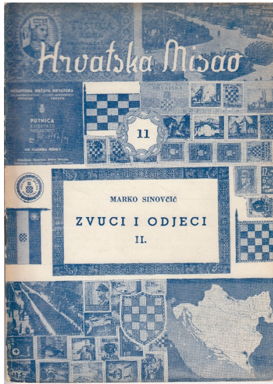
Slika1. Korice 11. sveska (1955) časopisa Hrvatska misao