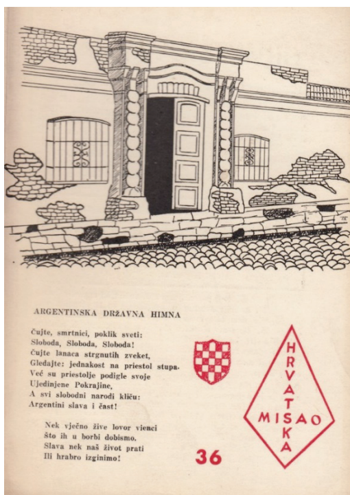
Slika 5. Argentinska himna na hrvatskom jeziku na korici 36. sveska (1966) časopisa Hrvatska misao