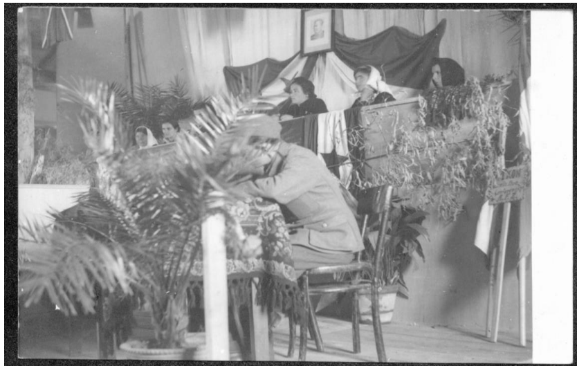
Slika 1. Baraka kod turskih kuća u Zadru u kojoj se odvijala prva Okružna konferencija AFŽ-a za okrug Zadar 15.11.1944. godine.

Zadarsko područje je od osnutka AFŽ-a 1942. pa do svibnja 1943. bilo dio Sjevernodalmatinskog okruga nakon čega se formira prvi Inicijativni odbor AFŽ-a za okrug Zadar. U obavijesti Oblasnom odboru AFŽ-a za Dalmaciju o ovoj vijesti žene pišu i o stanju na terenu: