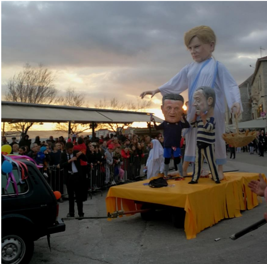
Slika 3.: Krnja „Dika s Grobnika“ s popratnim likovima Zoranom Mamićem i Milanom Bandićem (autor: Vedrana Vidiček)

Glava krnje predstavljala je bivšu predsjednicu zbog svih političkih ispada koje je imala tijekom svog mandata čime je, prema riječima sugovornika, ostavila svoj trag na hrvatskoj političkoj sceni. Radi navedenog organizatori su krnjevala ocijenili da zaslužuje ostaviti trag i na kaštelanskom krnjevalu. Ono što je posebno istaknuto na karnevalu u testamentu i osudi tiče se određenog predizbornog obećanja tada aktualne predsjednice Republike Hrvatske i kandidatkinje za drugi mandat koje je inspiriralo organizatore karnevala za izradu krnje. Obećanje je bilo vezano uz nova radna mjesta koje bi bivša predsjednica otvorila i koja bi bila plaćena osam tisuća eura što je u Hrvatskoj visoko iznad prosjeka. No, na izborima je izgubila, vlast je preuzeo Zoran Milanović te je obećanje Kolinde otišlo u zaborav. Sugovornica Mia objašnjava „s obzirom da su bili izbori za predsjednika Republike Hrvatske 2019./2020., i da je na vlast doša' Milanović, propalo je obećanje da će se moć' od doma zarađivat' 8.000,00 eura“.