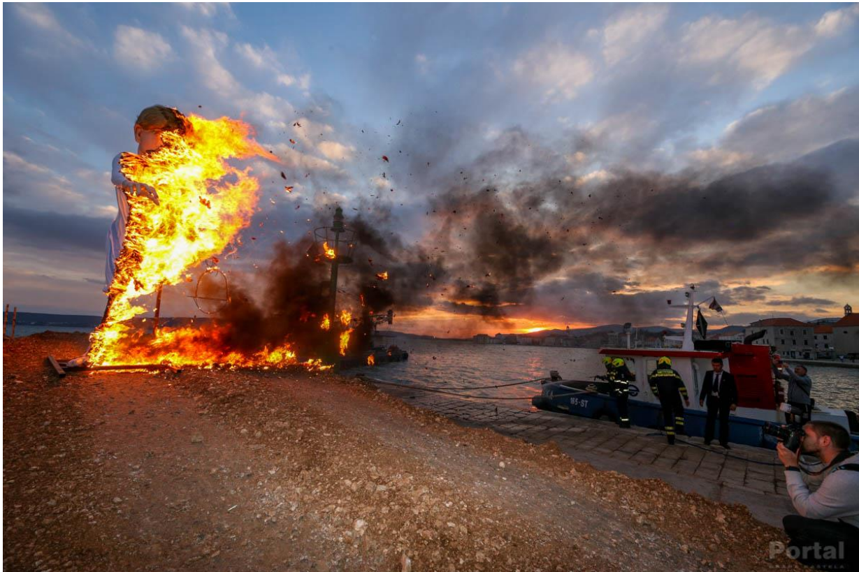
Slika 5.: Paljenje krnje (autor: Luka Ištuk)