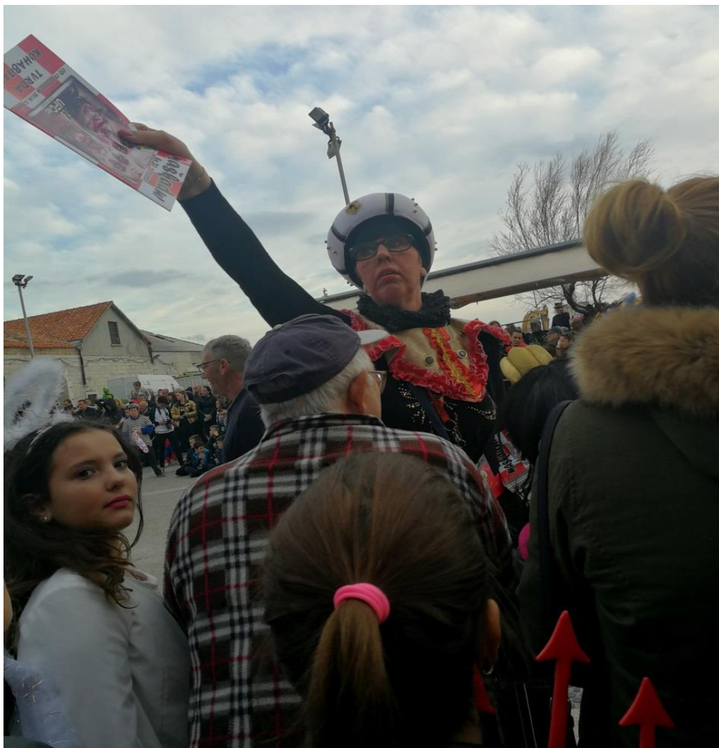
Slika 7.: Dijeljenje pokladnog lista "Maškadura" na Pokladnji utorak (autor: Vedrana Vidiček)