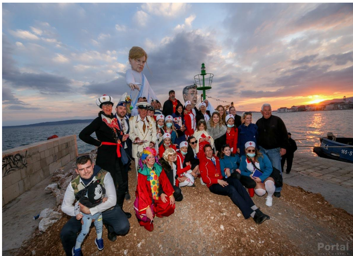
Slika 4.: Fotografiranje ispred krnje prije paljenja

Karnevalska povorka završila je oko 17:00 sati. Nakon nje, slijedilo je paljenje krnje. Krnja se palila oko 17:20 h. Prije paljenja, sudionici Donjokaštelanskog krnjevala okupili su se ispred krnje kako bi se fotografirali. Nakon što je krnja bila spaljena, uputila sam se, zajedno sa članovima KKU „Poklade“, prema radionici o kojoj ću kasnije više reći.