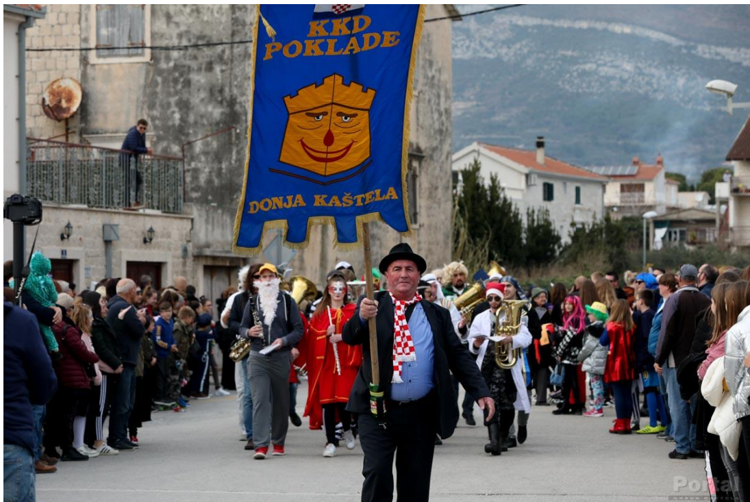
Slika 1.: Početak povorke