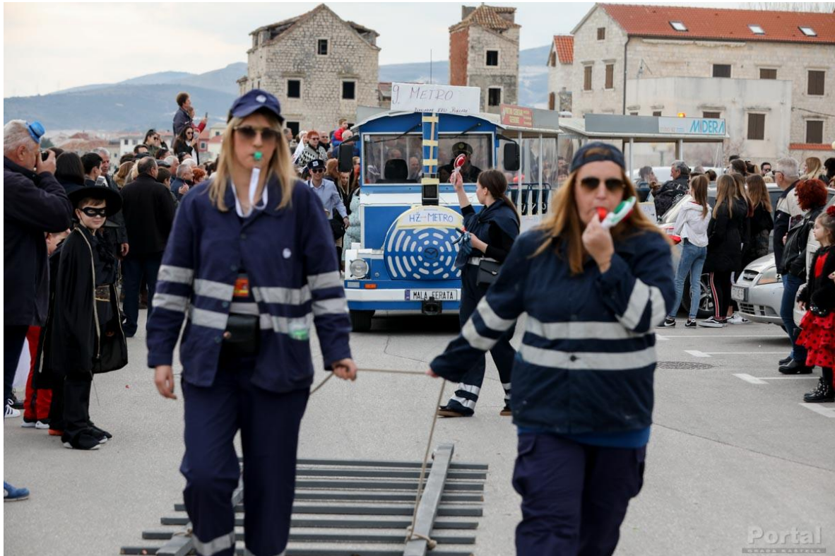
Slika 2.: Točka u povorci pod nazivom "Metro" (autor: Luka Ištuk)

Nakon točaka domaćina slijedile su točke koje su pripremile gostujuće grupe na krnjevalu. Gosti su stigli iz Gospića uz pratnju "Gradske limene glazbe Gospić", iz Korenice s točkom pod nazivom "Vanzemaljci", gosti iz Trogira s točkama "Crni petak" i "Ojkalica" te gosti iz Prilepa s točkom "Asterix i Obelix iz Prilepa". Osim njih, goste su činile grupe iz Ivanca, Puntamike (Zadar), Primoštena, Otoka, Rijeke, Vrlike, Ptuja, Kaštel Sućurca i Trogira.