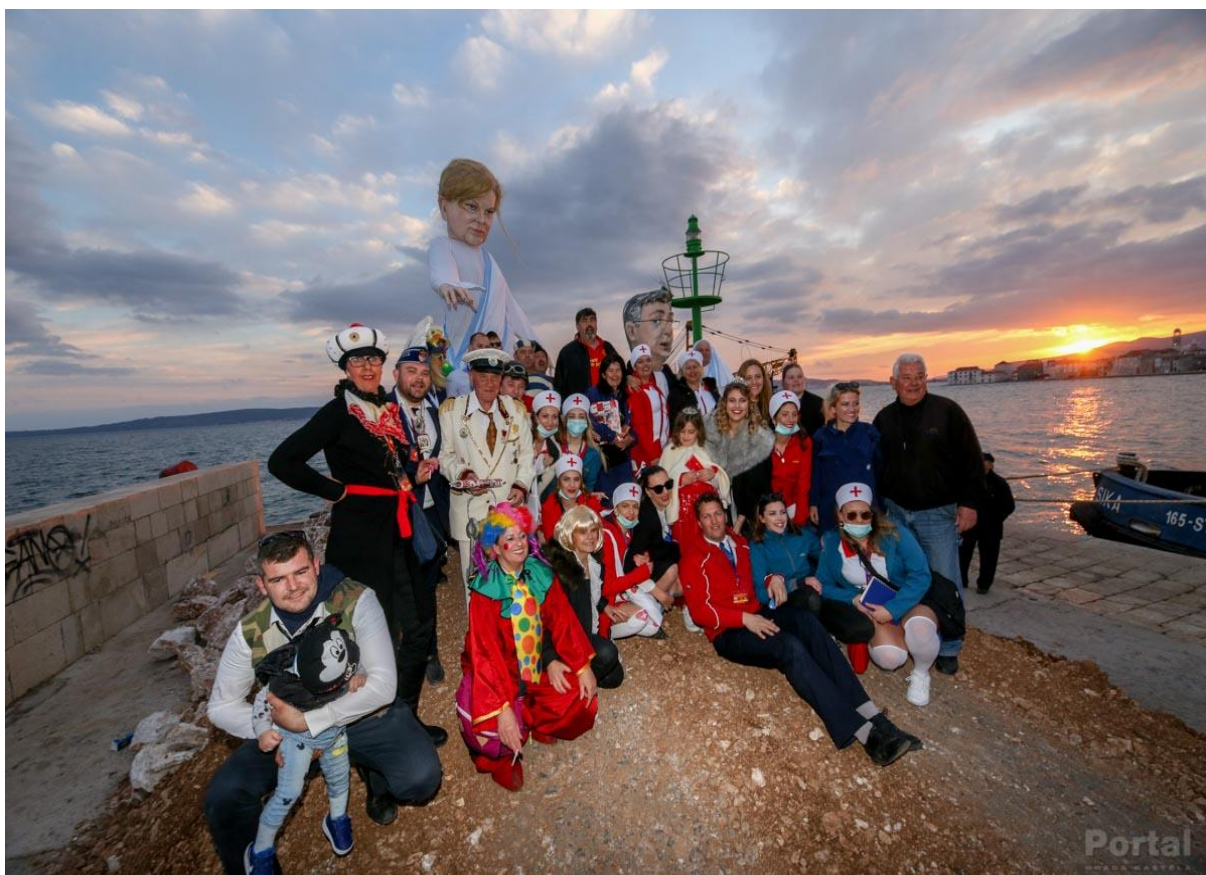
Slika 4.: Fotografiranje ispred krnje prije paljenja

Karnevalska povorka završila je oko 17:00 sati. Nakon nje, slijedilo je paljenje krnje. Krnja se palila oko 17:20 h. Prije paljenja, sudionici Donjokaštelanskog krnjevala okupili su se ispred krnje kako bi se fotografirali. Nakon što je krnja bila spaljena, uputila sam se, zajedno sa članovima KKU „Poklade“, prema radionici o kojoj ću kasnije više reći.