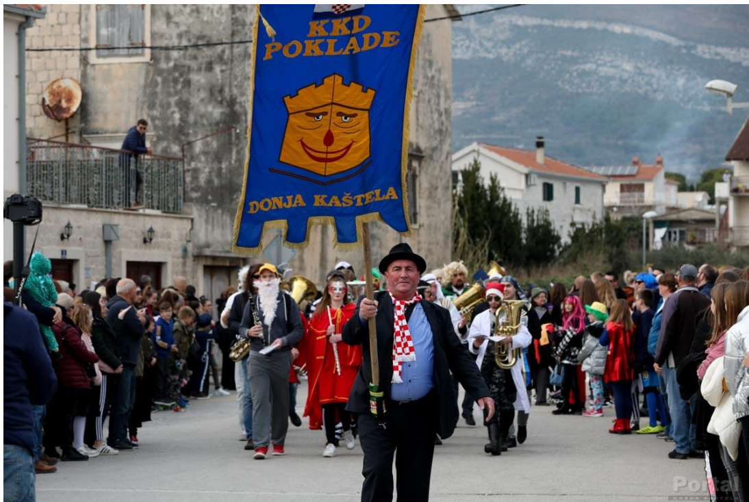
Slika 1.: Početak povorke