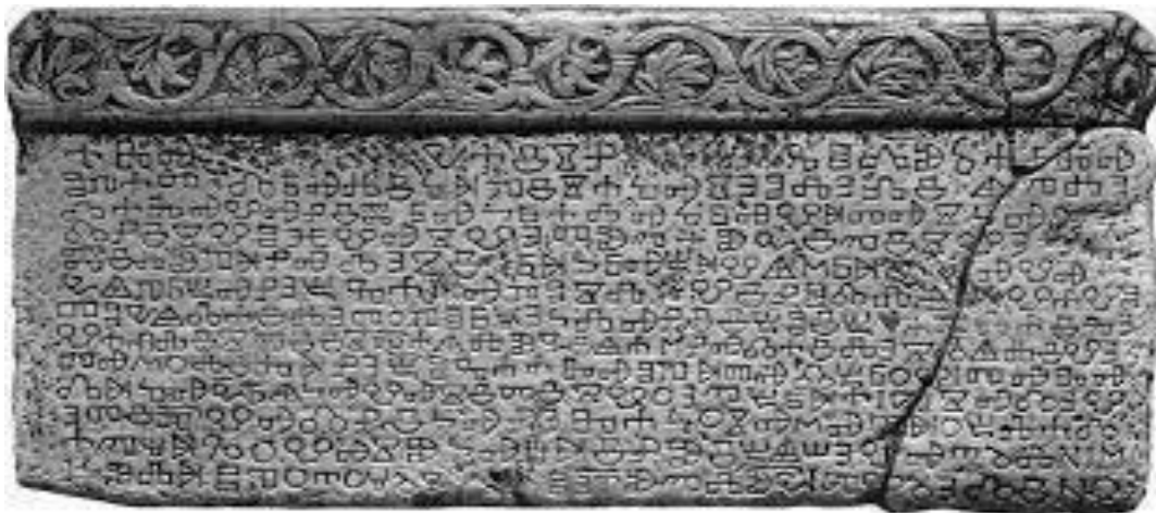
Slika 4. BAŠČANSKA PLOČA 1100 god. 11. st.