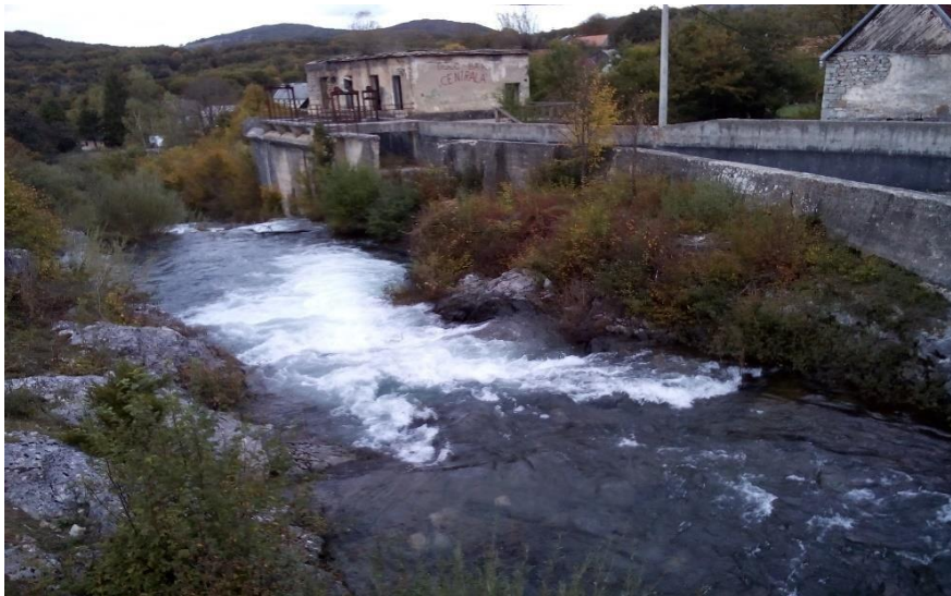
Picture 1449 Hidrocentrala u Švici

Daljnijim istraživanjem i uključivanjem u obnovu i prenamjenu drugih industrijskih kompleksa na dobrobit lokalne zajednice i čitavog kraja u svrhu zapošljavanja i obogaćivanja grada i kraja o ovakvoj vrsti baštine koja je nastala spletom povijesnih okolnosti, te prezentirajući povijest i zanimljive činjenice vezane za zanatstvo, industriju i elektrifikaciju koje su u moderno današnje vrijeme postale industrijska baština – baština u nestajanju.