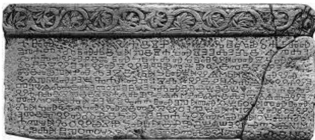
Slika 4. BAŠČANSKA PLOČA 1100 god. 11. st.