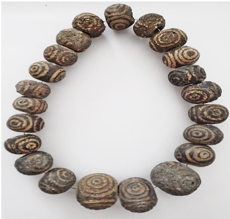
Slika 3. JAPODSKA OGRLICA OD STAKLENE PASTE, Prozor kraj Otočca, 9.-4. st. pr. Kr.