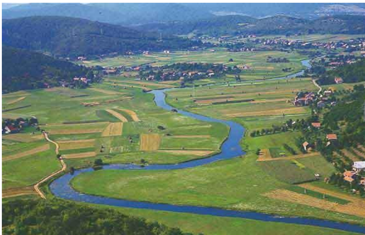
Slika 13. RIJEKA GACKA I GACKO POLJE U GACKOJ DOLINI