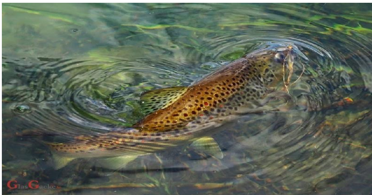
Slika 14. POTOČNA PASTRVA U RIJECI GACKOJ