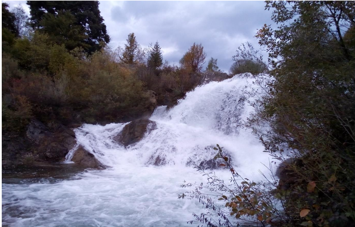
Slika 12. ŠVIČKI SLAP