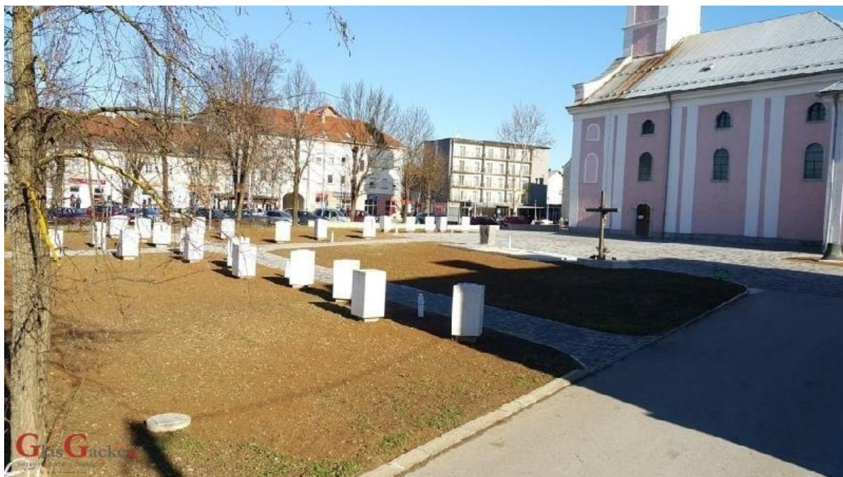
Slika 8. GAČANSKI PARK HRVATSKE MEMORIJE OTOČAC