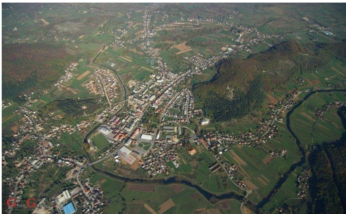
Slika 1. PANORAMA GRADA OTOČCA U GACKOJ DOLINI