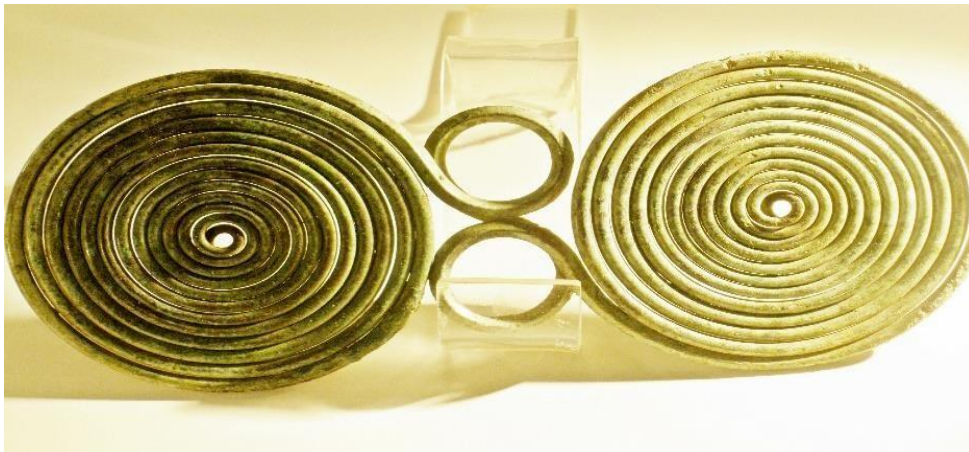
Slika 2. SPIRALNO NAOČALASTA FIBULA, bronca, Prozor, 7-6. st. pr.Kr.