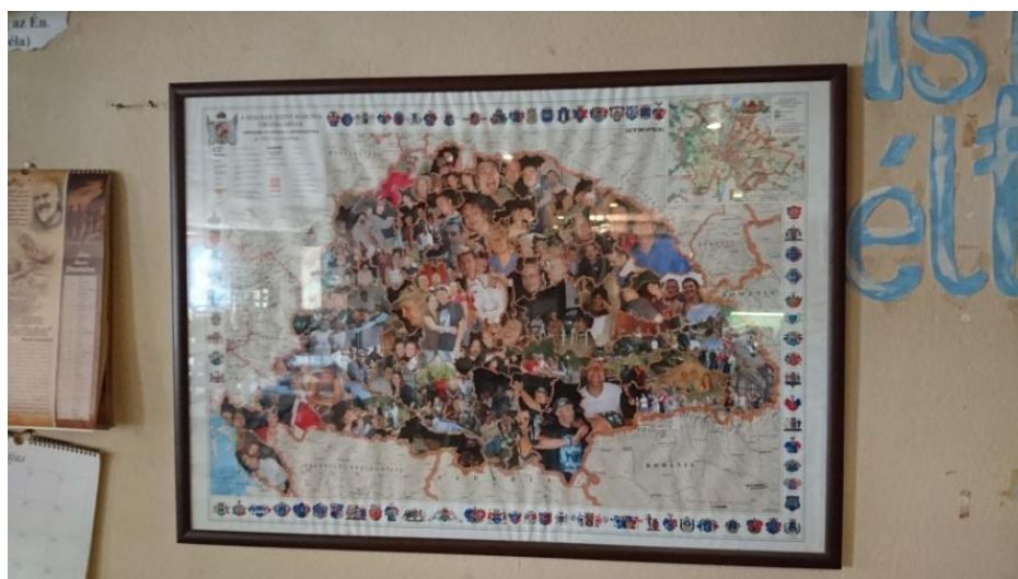
Slika 9. Karta Ugarskog kraljevstva

Fotografija prikazuje mađarsku zastavu usred njemačkog puba što simbolizira domoljublje prema Mađarskoj. Raspitao sam se u razgovoru s Tamášom zašto je upravo ta zastava postavljena na tom mjestu. Rekao je kako se u tom pubu nalaze ljudi koji vjeruju u Ugarsko kraljevstvo. U taj lokal dolaze ljudi istog mišljenja i svjetonazora i u velikoj su mjeri stalni gosti puba. Tamáš mi je pokazao i kartu koja se sastoji od slika istomišljenika.