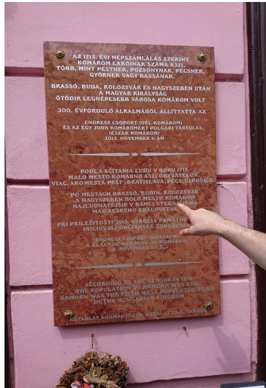
Slika 2. Ploča o gradu na mađarskom, slovačkom i engleskom jeziku