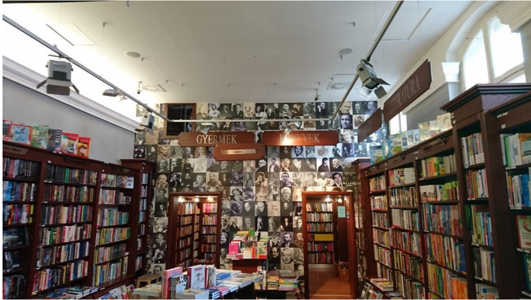
Slika 1. Panta Rhei – knjižara