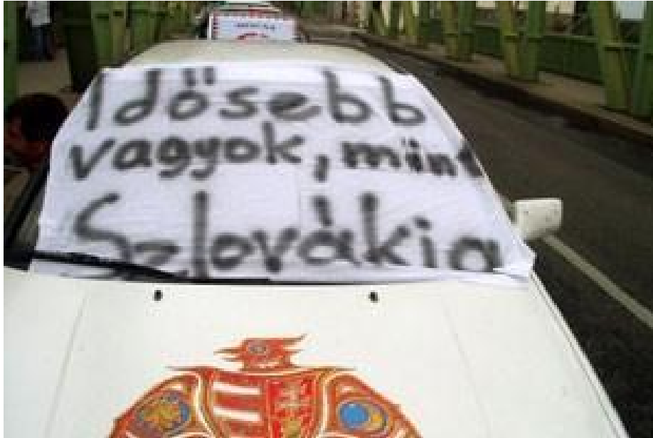
Slika 6. „Stariji sam od Slovačke“

„Stariji sam od Slovačke.“ Navedena se rečenica nalazila na transparentu pričvršćenom na bijelom Golfu usred Elizabetinog mosta u Komárnu.