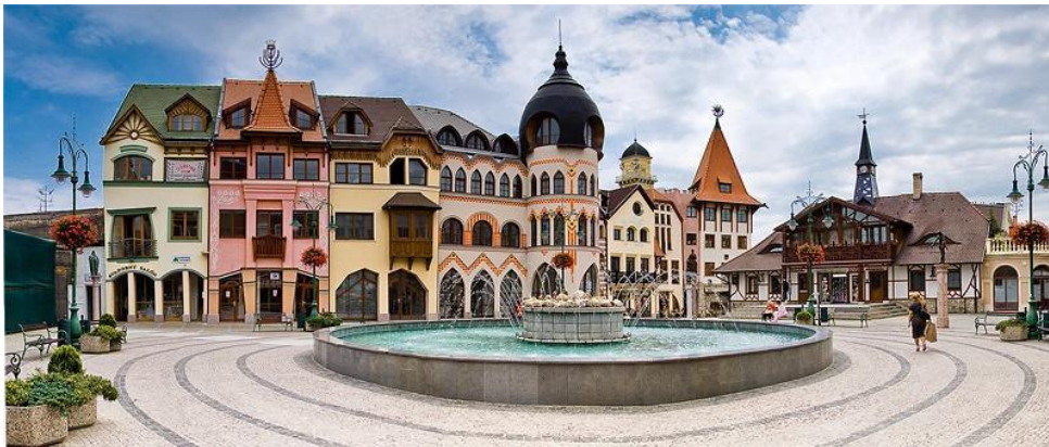
Slika 7. Nádvorie Európy

Pregovori o ulasku Slovačke u Europsku Uniju motivirali su građane da 2001. godine izgrade kompleks Europskog trga. Spomenuti kompleks nalazi se u centru grada i u njemu možemo pronaći privatne urede, raznolike trgovine i suvenirnice, a zgrade su šarene i različitih stilova. Svaka zgrada simbolizira arhitekturu i kulturu pojedine Europske države. Muriel Blaive i Libora Oates-Indruchová (2013: 108-109) smatraju kako Slovaci i Mađari kompleksom odaju počast idealnom svijetu tolerancije, slobode i pripadnosti.