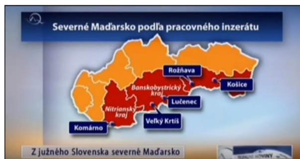
Slika 5. Karta sjeverne Mađarske po viđenju medija