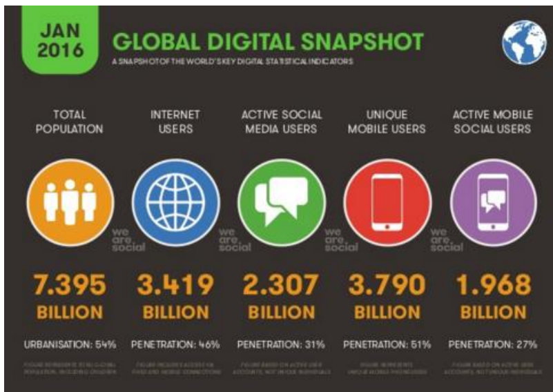
Slika 1. Uporaba društvenih medija u svijetu