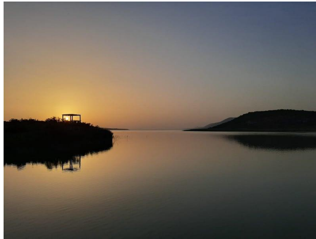
Slikovni prilog 8. Info centar Prosika 11

najma kajaka i bicikla i kupnje ribolovnih dozvola za pecanje, što posjetiteljima omogućuje istraživanje područja jezera opuštajući se uz pecanje ili krećući u avanture kajacima i biciklima.