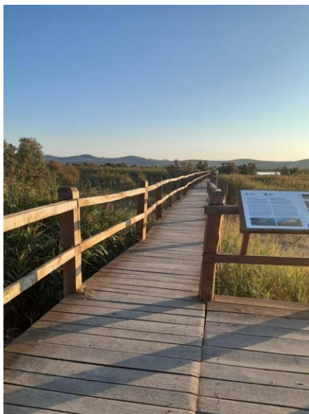
Slikovni prilog 6. Info centar Crkvine – ornitološki rezervat 9

Info centar Crkvine nalazi se u sjeverozapadnom dijelu Parka prirode, preciznije, u ornitološkom rezervatu. U samom rezervatu postoji drvena edukativna staza kojom posjetitelji mogu prošetati uz osnovnu kupljenu ulaznicu. Postoji i mogućnost iznajmljivanja dalekozora, kao i najam MTB bicikla. Nova atrakcija Parka prirode je adrenalinski park, koji mlađim, ali i starijim posjetiteljima pruža pregršt zabave i užitka. Nadalje, u sklopu ovoga info centra nalazi se i suvenirnica u kojoj posjetitelji mogu kupiti proizvode iz okolice ili za uspomenu ponijeti magnet u obliku ptica. Na Vranskom jezeru zabilježeno je više od 260 vrsta ptica, a glavna atrakcija je svakako čaplja danguba, koja je ujedno i simbol Parka prirode Vransko jezero. U neposrednoj blizini Vranskog jezera nalazi se i ornitološka postaja, izgrađena 2004. godine te već kontinuirano održava ljetni prstenovački kamp s naglašenom obrazovnom ulogom. Kamp se održava po pravilu sto dana godišnje, od srpnja/kolovoza do rujna/listopada te obuhvaća i jesenske migracije ptica. Tijekom kampa posjetitelji imaju mogućnost promatrati ptice iz neposredne brzine, što je jedinstveno iskustvo za svakog posjetitelja.