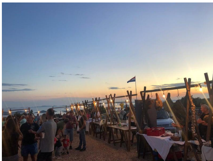
Slikovni prilog 4. Ovogodišnji sajam „Luka i igara”

Sajam se ove godine (2021.) održava osmu godinu za redom, a uz bogatu ponudu OPG-ova, moguće je uživati u nastupu lokalnih KUD-ova te raznih tradicijskih igara poput povlačenja konopa, alke u karioli ili nošenja jaja u žlici. Posebna atrakcija je prsnac, autohtono domaće jelo, koje se peče ispod peke na samome Kamenjaku. Park prirode već nekoliko godina unatrag ima uspješnu suradnju sa zavičajnim klubom iz Zelengrada koji će i ove godine preuzeti ulogu pečenja prsnaca ispod peke. Posjetitelji se također mogu okušati u pletenju luka (pletenje rešte luka), kako su to naše bake nekoć znale raditi. 7