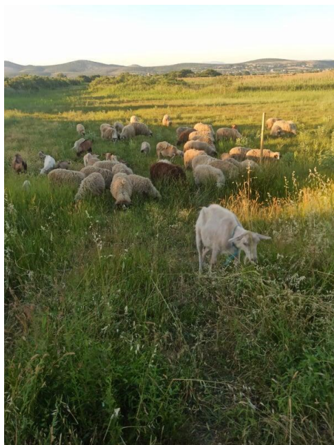
Slikovni prilog 2. Koze i ovce tijekom ispaše na Vranskom jezeru (2019.)

Svi su kazivači tijekom razgovora spominjali jednu prekretnicu koja je utjecala na nestanak tradicijskih običaja na ovim prostorima. Djeca su se sve više fokusirala na školovanje te su pokušavali pronaći bolji život u gradu bježeći od seoskog života. Na području jezera ratna su događanja jako utjecala na stanovništvo.