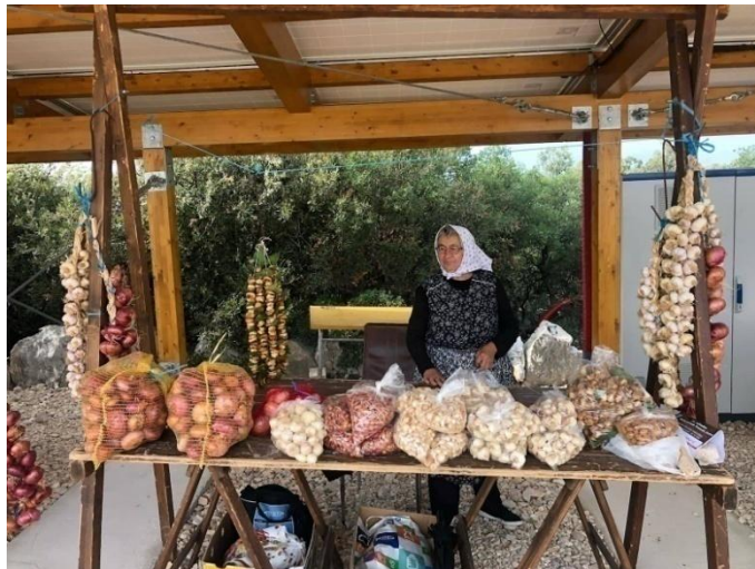
Slikovni prilog 3. OPG-ovci s područja Vranskog jezera na tradicionalnom sajmu „Luka i igara“ 6

„Kažu da je ove godine bilo jako puno ljudi. Ovi posjetitelji koji cirkuliraju na relaciji Crkvine-Kamenjak-Prosika su uglavnom stali ako su vidjeli neki štand i kupili luk ili maslinovo ulje. Ja iskreno mislim da je Park kao Park tu dosta pridonio u nekoliko godina.“ (Djelatnica Parka prirode)