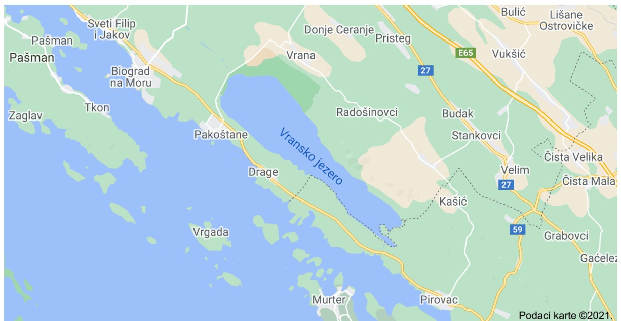
Slikovni prilog 1. Geografski položaj Vranskog jezera 3

Vransko jezero najveće je prirodno jezero i jedno od posljednjih mediteranskih močvara u Republici Hrvatskoj. Jezero je zapravo krško polje ispunjeno bočatom vodom te predstavlja kriptodepresiju. U sjeverozapadnom dijelu jezera nalazi se poseban ornitološki rezervat s najvećom gnijezdećom populacijom malog vranca. Također, ovo je područje zimovalište za preko 100.000 jedinki ptica vodarica. Posebna vrijednost Vranskog jezera prepoznata je još 1983. godine kada je njegov sjeverozapadni dio proglašen posebnim ornitološkim rezervatom, a 1999. godine kao jedno od rijetkih staništa ptica s izvorima pitke vode te je kao područje posebne bioraznolikosti Vransko jezero proglašeno je Parkom prirode. Zabilježene su ukupno 264 vrste ptica, a znanstvena istraživanja navode kako će močvare, zbog ogromne fiksacije CO_2 , u budućnosti imati ključnu ulogu u zaštiti živih bića, ljudi i globalnog zagrijavanja.