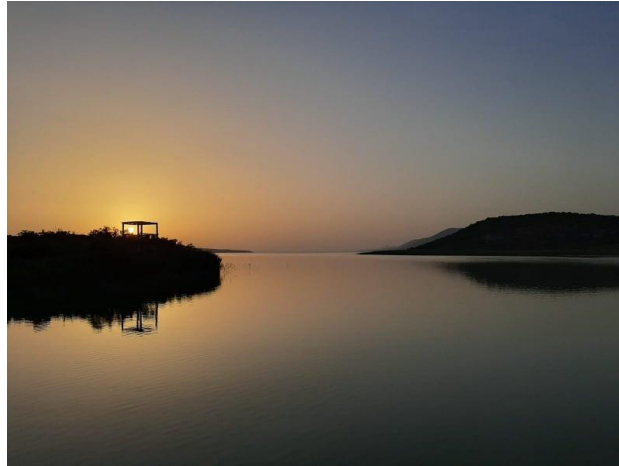
Slikovni prilog 8. Info centar Prosika 11

najma kajaka i bicikla i kupnje ribolovnih dozvola za pecanje, što posjetiteljima omogućuje istraživanje područja jezera opuštajući se uz pecanje ili krećući u avanture kajacima i biciklima.