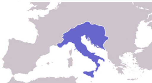
Karta 2. Ostrogotsko kraljevstvo na vrhuncu moći, 6. stoljeće

periodu upoznalo s arijanizmom. Odgovor su Goti. Oni su, naime, bili osvajački narod koji je na vrhuncu svoje moći zauzimao prostor današnje Italije i francuske pokrajine Provanse, preko Alpa zauzimajući današnju Hrvatsku, Sloveniju, dio Vojvodine te Bosnu i Hercegovinu (v. Kartu 2). 145