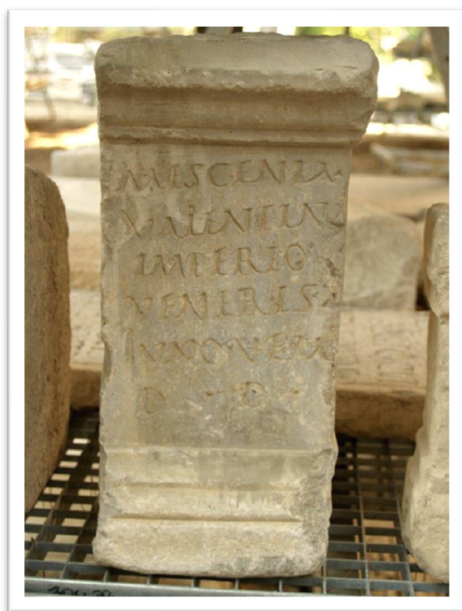
Slika 9. Natpis Mescenije Valentine (S. BEKAVAC, 2015., 52.)

Nemali broj natpisa govori o velikim građevinskim pothvatima iza kojih stoje žene. Jedan od natpisa koji svjedoči o tome je onaj Kurije Priske (Slika 10.) koji govori o obnovi te opremanju svetišta Velike Majke: Curia Pris/ca Matri magnae / fanum r<e=i>fecit / signa posuit laro/phorum cymbala / tympana / catillum / fortifices aram dat l(ibens) a(nimo). 121 Kurija Priska navodi kako je obnovila te opremila svetište kipovima i postoljima za kipove Lara, cimbale, timpane, zdjelicu, mašice i žrtvenik. Tim akcijama jasno je dala do znanja kako je bila jako dobro financijski situirana što povlači za sobom činjenicu da je uživala visok status u društvu. Nadalje, Statilija Lupula obnovila je svetište Velike Majke: [----] Lupula Statili[a] / [tem]plum Matris Ma<gn=NG>[ae] / [deo]rum de su ore/[stitu]it cum suis f<i=E>l(iis). 122 Junija Rodina je, s druge strane, zajedno s mužem i sinom ili kćeri obnovila i proširila hram Velike Majke što vidimo na natpisu: Iunia Rhodine / cum coniuge et fil(io?) / d(eum) M(atri) M(agnae) aedem refecit / et ampliavit (votum) s(usceptum) s(olvit) l(ibens) m(erito). 123 Servilija Kopiježila je pak o svom trošku dala izgraditi edikulu Velikoj Majci za što se zavjetovao njen muž Marcus Cottius Certus: Servilia M(arci) f(ilia) / Copiesilla / aediculam M(atri) Mag(nae)