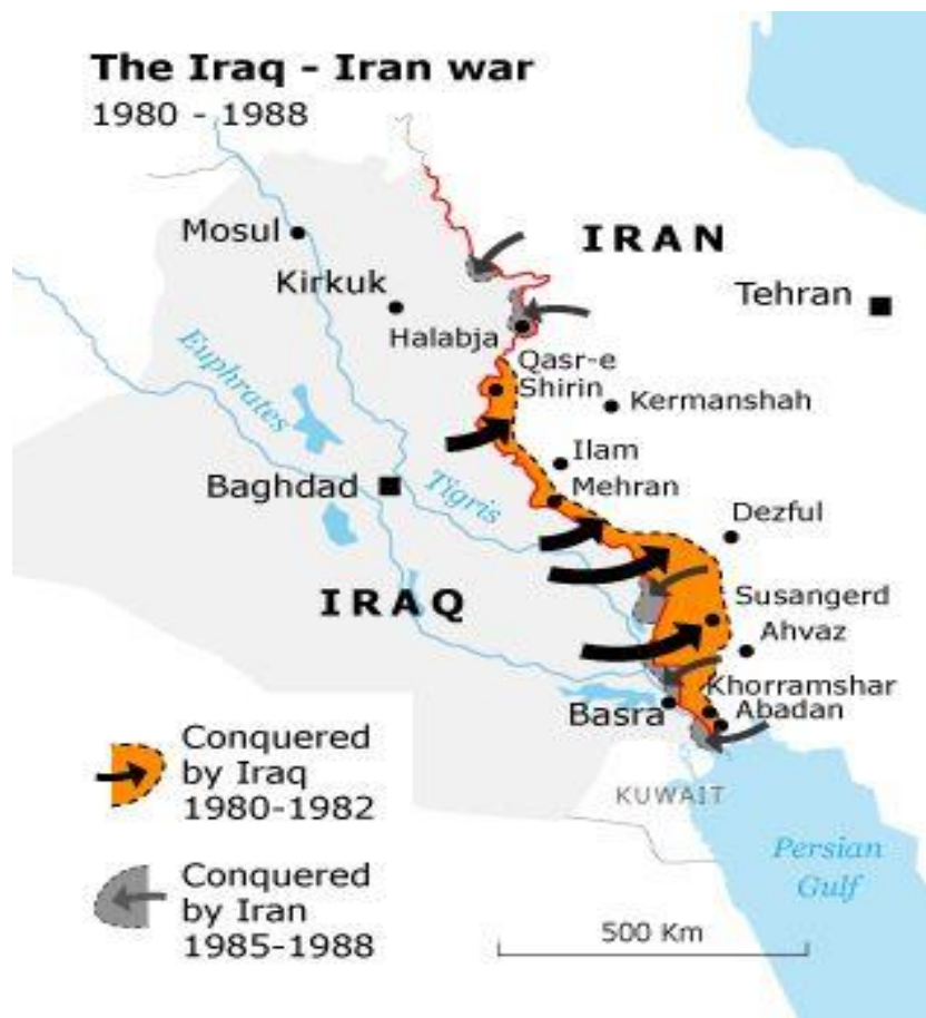
Slika 1.

političko i ekonomsko samoubojstvo za Teheran, zbog čega je blokada Zaljeva bila zadnja opcija za Iran. 81