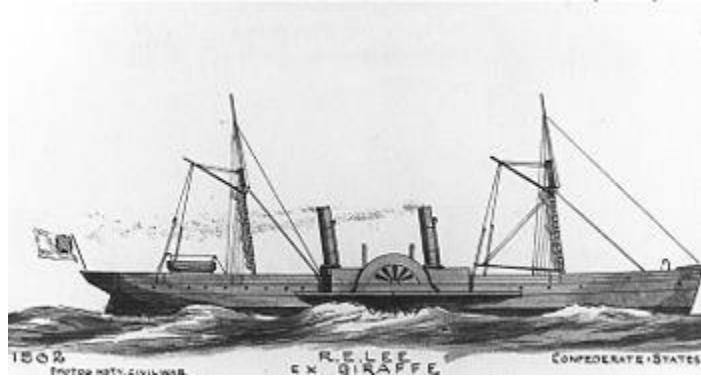
Slika 2. Model “blockade runnera” - CSS Robert E. Lee 13

Ujedinjeno Kraljevstvo, baš kao i ostatak svijeta, nije priznavalo Konfederacijski novac kao valutu, jaka inflacija Konfederacijske valute činila ju je nestabilnom, stoga je alternativa postao pamuk. Takva trgovina podsjećala je na robnu razmjenu: pamuk za oružje. Međutim, “blockade runners” imali su dvostruku ulogu: prijevoz pamuka iz Konfederacije u Ujedinjeno Kraljevstvo te prijevoz oružja iz Ujedinjenog Kraljevstva u Konfederaciju. Ova vrsta prijevoza robe bila je jedna vrsta rizika, svako putovanje “blockade runnera” moglo je rezultirati neuspjehom, no ipak je statistika bila na strani ovih brodova. U tijeku cijelog rata, preko 1300 puta se pokušalo proći blokadu Unije i čak oko 1000 puta taj pokušaj je bio uspješan. Ovakva vrsta trgovanja svakako je bila skupa što je rezultiralo povećanjem cijena pamuka na tržištu u Ujedinjenom Kraljevstvu, nekada bi pamuk bio toliko skup da bi jedna tura putovanja “blockade runnera” isplatila cijeli brod i samo putovanje. Iako je javnost na ovu vrstu trgovanja gledala kao pomaganje Konfederaciji, službena vlast Ujedinjenog Kraljevstva u ovome nije vidjela ništa ilegalno. 14