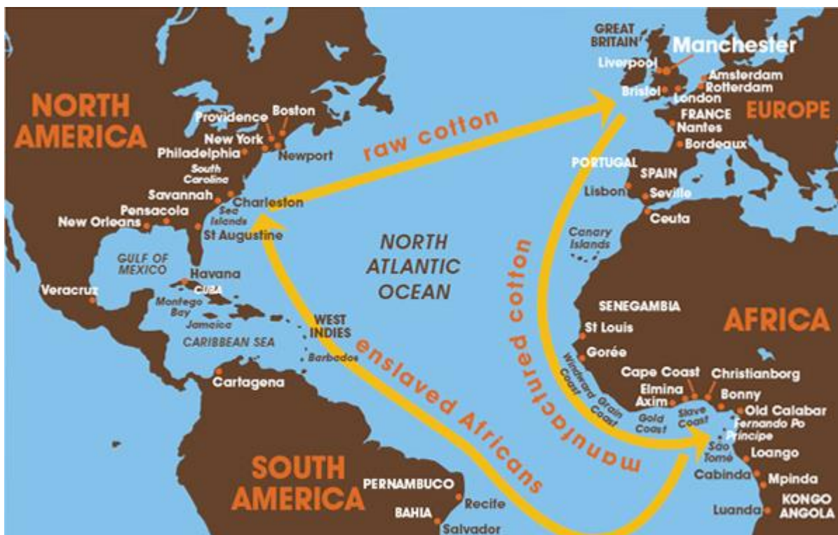
Slika 1. Karta trgovine sirovine pamuka između Ujedinjenog Kraljevstva i Sjedinjenih Američkih Država u 18. i početkom 19. stoljeća 5