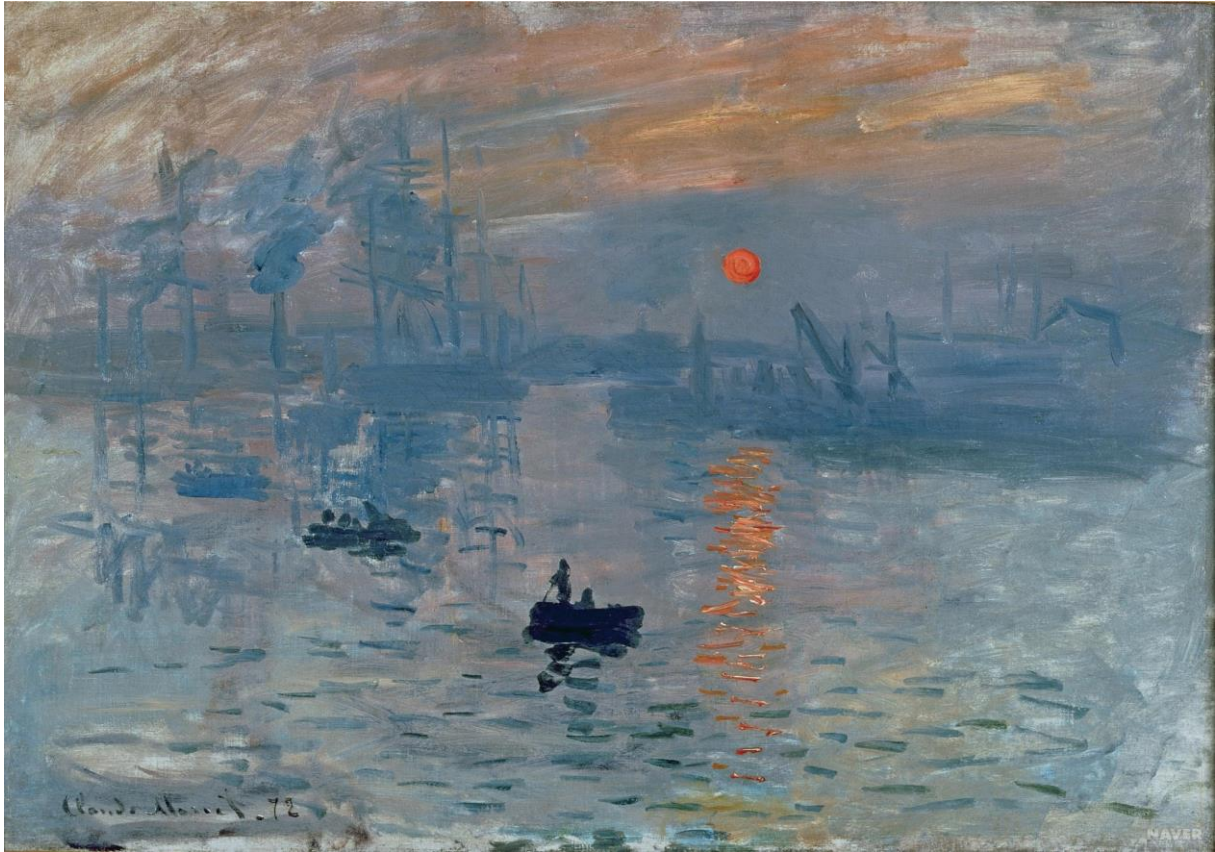
Slika 11. Claude Monet, Impresija, izlazak sunca , 1872., Musée Marmottan Monet, Pariz