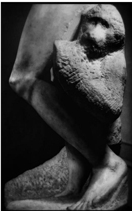
Slika 1. Michelangelo, Umirući rob (detalj), 1513.-1516., Louvre, Pariz