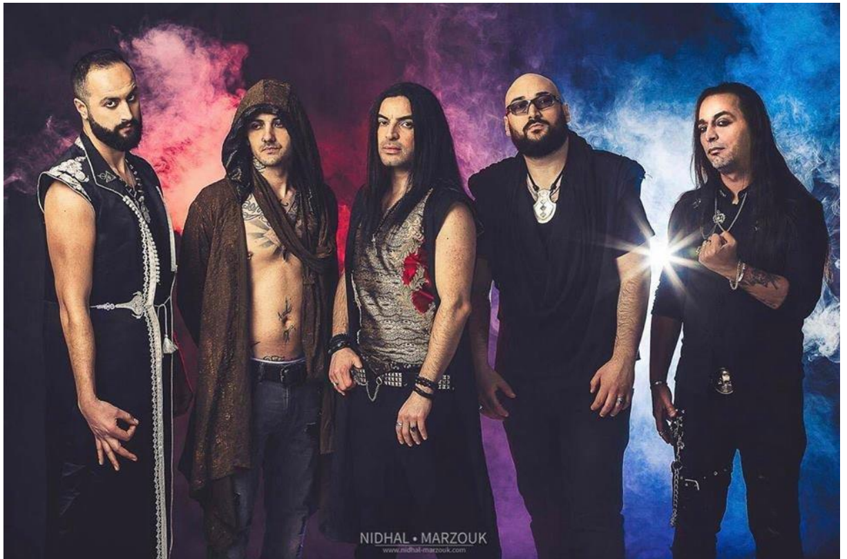
Slika 11. Myrath 38

Myrath je tuniški progresivni metal bend nastao 2001. godine. Njihovo ime u prijevodu s arapskog označava Legacy , tj. ostavštinu. 39 Važnost ovog benda jest u njegovoj glazbenoj fuziji arapske i bliskoistočne glazbe te s druge strane metal glazbe. Ta upotpunjenost, melodičnost i simfoničnost daje jedan potpuno novi pogled na modernu glazbu folk metal žanra, kao što i oni sami kažu u jednom intervjuu: „Mi smo već pokušali ubaciti naš identitet u našu glazbu u prijašnjim albumima, ali nismo pronašli svoj stil još, te smo s ovim albumom stvorili novi žanr: blazing desert metal.“ 40