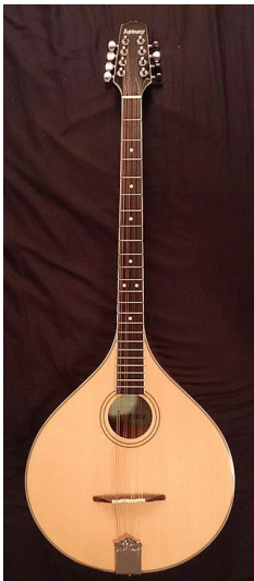
Slika 7. irski buzuki 18