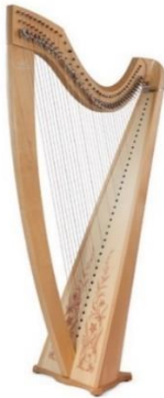
Slika 5. keltska harfa 16