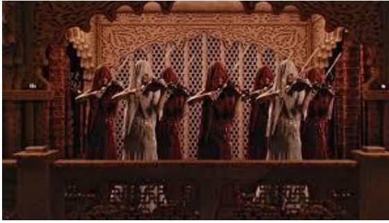
Slika 13. Žene u burkama sviraju violine 44