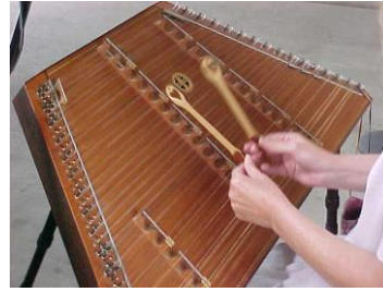
Slika 4. Hammered Dulcimer ili