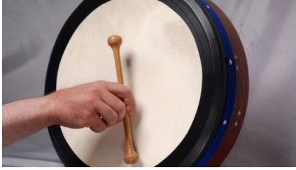
Slika 3. Bodhrán ili irski bubanj 14 timpan 15