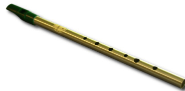
Slika 8. irska frula 19