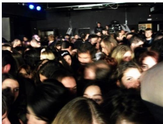
Slika 1. Publika na koncertu Eluveitie i Korpiklaani 2008. godine 4

Naime, folk metal kao vrsta glazbe o kojoj će biti riječi u daljnjem tekstu vrlo je različita od popularne glazbe, tj. narodnjaka i turbofolka o kojemu piše Aleksej Pavlovsky, ali i vrlo slična country glazbi o kojoj piše Richard A. Peterson. Knjigu Narodnjaci i turbofolk u Hrvatskoj sam uzela kao okosnicu ovog rada zbog sličnosti predmeta istraživanja, a to je (popularna) glazba. Naime, Pavlovsky se kroz analizu fenomena popularne glazbe koristio metodom dubinskih intervjua uz relevantnu literaturu, pri čemu je došao do principa funkcioniranja komercijalne/popularne kulture. Glazba je socio-kulturni fenomen koji je potreban istraživati jer je podložna stalnim promjenama. Aleksej Pavlovsky smatra da je jedini konzument i temeljni nosilac okvira funkcioniranja svih sastavnica tradicijske, narodne kulture, kao i tradicijske i narodne glazbe upravo narod (2014: 243). Zajednica sličnih interesa koja se kroz glazbu identificira, kao što je rečeno u citatu Alekseja Pavlovskog: „Moje je mišljenje da se u javnom diskursu o dotičnoj glazbi odražava pitanje političko-društvene identifikacije, preciznije rečeno, kontraidentifikacije, tj. identifikacije sebe naspram (a pomoću) Drugog.“ (2014: 243).