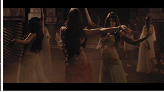
Slika 14. Scena s trbušnim plesačicama 45

Tekst pjesme je na engleskom jeziku i s arapskim dijelovima, a pjesma tematizira strah, želju za odustajanjem, ali i vjeru, kao što je to vidljivo iz citata jednog članka: