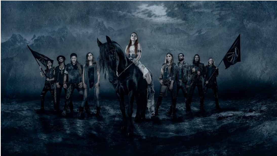
Slika 2. Eluveitie band 13

Eluveitie je ime folk metal benda iz Zuricha (Švicarska) oformljenoga 2002. godine pod vodstvom Chrigela Glanzmanna. Broj članova se konstantno mijenjao te tako su se unosile i promjene u glazbi, instrumentima i vokalnim izvedbama pjesama. Promjene su posebice su vidljive u pjesmama gdje vokalno ili instrumentalno gostuju glazbenici i pjevači koji nisu članovi benda. Trenutno je samo devet stalnih članova benda od kojih svatko ima svoju određenu ulogu: