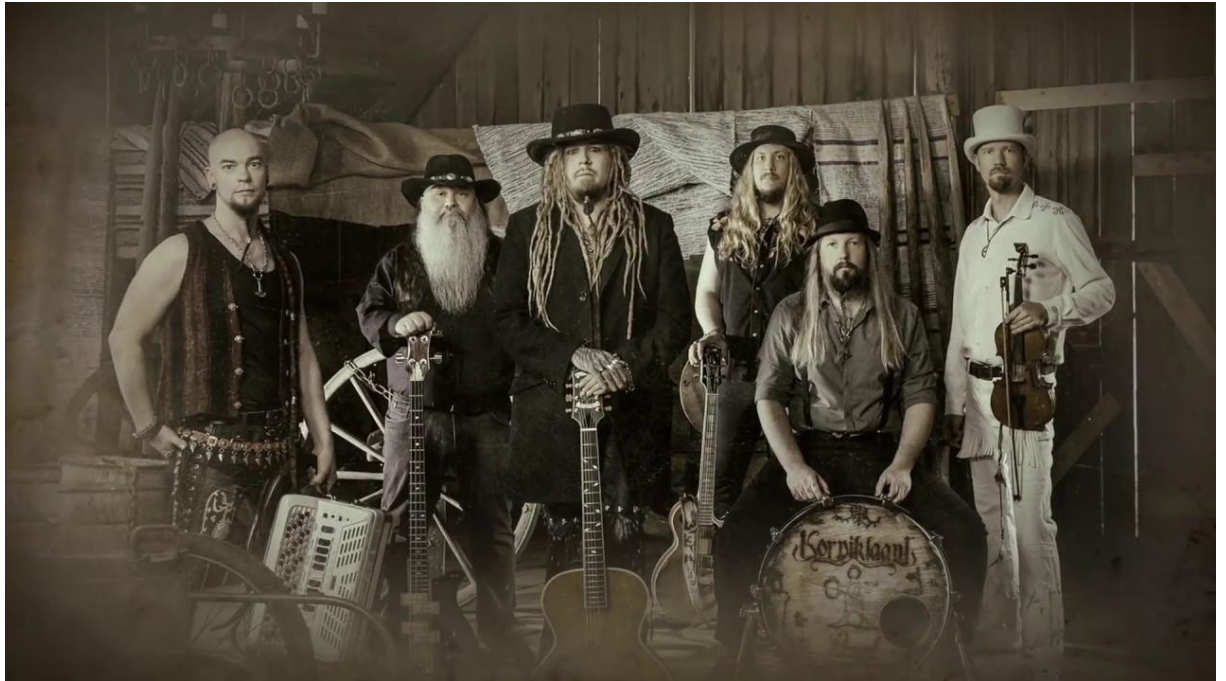
Slika 9. Korpiklaani bend 32

Korpiklaani je folk metal band iz mjesta Lahti (Finska) nastao 2003. godine. Bave se tradicijskom folk glazbom uključujući finsku i englesku mitologiju u svoje tekstove pjesama. 33 Prvotni naziva bio je Shamaani Duo (1993. godine) ili Shaman (1997. godine) zbog povratka tradiciji, tj. vraćanje narodnim običajima plemena Sami. Samo ime označava šumu, čistinu, tj. nordijskog šumara 34 što je vidljivo iz njihovih izgleda: seoska odjeća upotpunjena sa šeširima, duga kosa i obrasle brade. Nadalje, poveznica je vidljiva u spotovima koji su snimani većinom u prirodi, preciznije šumama. Promjena imena označila je i promjenu instrumenata, tj. zamjena klavijatura s tradicijskim instrumentima poput violine i harmonike, a također i načinom pjevanja gdje je yoik ili joik zamijenjen čistim vokalima ili grovljanjem (tipičnim za metal -glazbu). Što se tiče jezika, finski je zamijenjen engleskim, ali ne u potpunosti jer se pojavljuju pjesme na finskom na novijim albumima. Korpiklaani nazivaju se još i happy folk metal jer kako Jarkko Aaltonen kaže u jednom intervjuu: „...problem je što nas ne shvaćaju kao ozbiljan metal bend jer mora