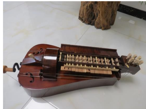
Slika 6. hurdy gurdy 17