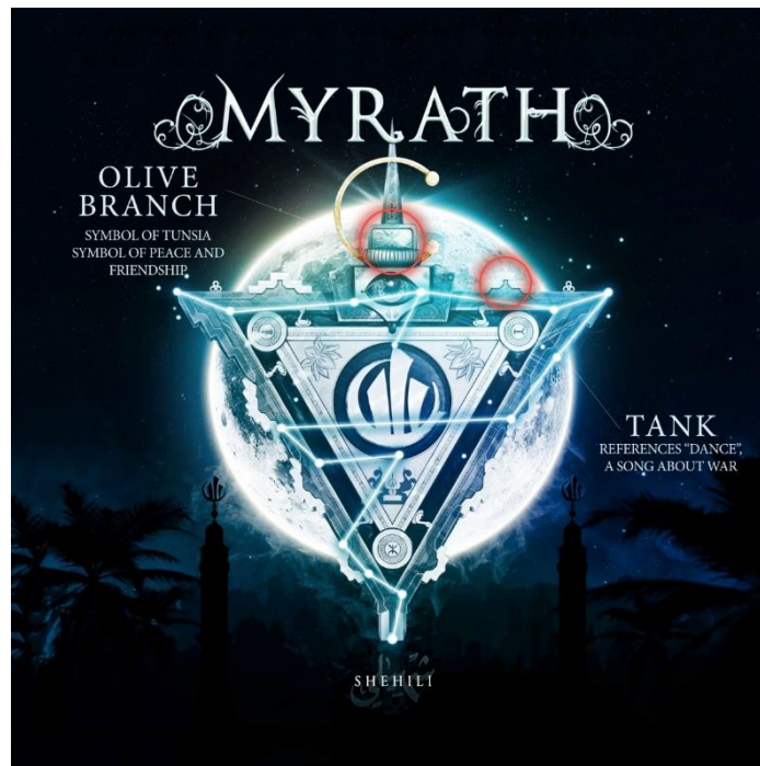
Slika 12. simbol Myratha 42

prijateljstva (simbol Tunisa) koji je također u antičko vrijeme za Grčku označavalo isto što i danas za Tunis. S druge pak strane, dolje desno se nalazi tenk koji simbolizira mračnu stranu stvarnosti (terorizam, rat, mržnja i nesigurnost). 41 Stalna borba dobra i zla posebno je istaknuta pričom u spotu za pjesmu Dance koja govori o sirijskom plesaču koji pleše za slobodu i protiv zla, za slobodu života, što je također vidljivo i opisano na slijedećoj slici: