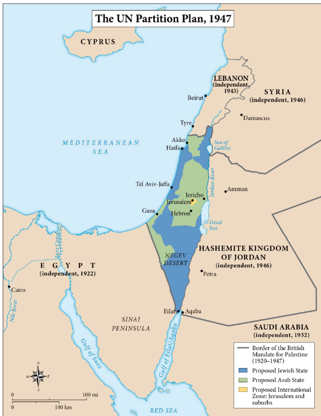
Karta 1: UN-ov plan podjele prostora Palestine na države Izrael i Palestina izrađen i objavljen 1947. Sredinom sljedeće godine je osnovan Izrael, a do stvaranja Palestinske države nije došlo.

Sukob, bolje reći rat koji je trajao od 1947. do 1949. godine označit će kraj vladavine dotadašnjeg sirijskog predsjednika al-Quwwatlia, kojeg u puču svrgava pukovnik Zaim, a ovoga pukovnika pak nakon četiri mjeseca pogubljuju članovi Sirijske nacionalne stranke. Oni