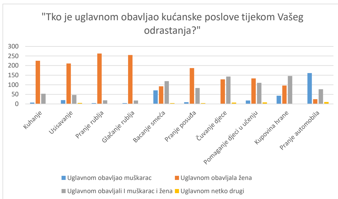
Slika 1. „Tko je uglavnom obavljao kućanske poslove tijekom Vašeg odrastanja?“

Željelo se saznati tko je obavljao kućanske poslove u obitelji tijekom odrastanja studenata. Podaci su prikazali jasnu podjelu na tradicionalno „muške“ i „ženske“ poslove. Primjerice kod obavljanja kućanskih poslova kuhanje (79% žena), usisavanje (74% žena), pranje rublja (92% žena), glačanje rublja (89% žena), pranje posuđa (65% žena) koji se deklariraju kao tipično „ženski“ poslovi, rezultati su potvrdili da još uvijek većinu takvih poslova obavljaju žene. Najviši postotak ženskog obavljanja poslova je kod pranja i glačanja rublja gdje rezultati pokazuju da je tijekom odrastanja pranje rublja i glačanje rublja obavljalo 1% muškaraca, što se može vidjeti u grafu 1. S druge strane, posao poput pranja automobila prikazuje se kao „muški“ posao gdje taj posao obavlja 56% muškaraca. Dok su poslove poput bacanja smeća , kupovina hrane i čuvanje djece uglavnom obavljali i muškarac i žena, no žene još uvijek u većem broju.