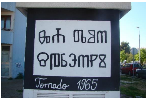
Slika 1. Mural sa glagoljicom

Većina nas zna pojedina slova glagoljice ili pri pogledu na ovo pismo ponosno kažemo kako je to glagoljica jer smo prepoznali dio baštine, ali zapravo rijetki od nas zaista čitaju ovo pismo. S obzirom na boje koje dominiraju muralom, pomisao je kako tu piše nešto što se odnosi na košarku, na ljubav prema klubu te je zatečenost nakon saznanja normalan slijed događaja. Mural je naslikan na jednoj trafostanici, sa sve četiri strane, te osim ovog natpisa ima grb Tornada Zadar, odnosno Slova T i Z unutar štita. Sve je naravno zaokruženo plavo bijelom bojom. Ipak, ono o čemu ponovo trebamo razmisliti jest na koji način se mladima predstavlja povijest i njihova baština te jesmo li svi dovoljno dobro upoznati sa povijesnim činjenicama. Članci na koje se rad referira, u sebi imaju fotografije koje dokazuju nastanak ovog pozdrava. Takva fotografija u članku, obrazloženje znanstvenika zašto nešto nije u redu koristiti, a naposljetku i riječi same predsjednice države koja se u novinama ispričavala jer je koristila ovaj pozdrav, zaista nas tjera da ponovno preispitamo neke činjenice.