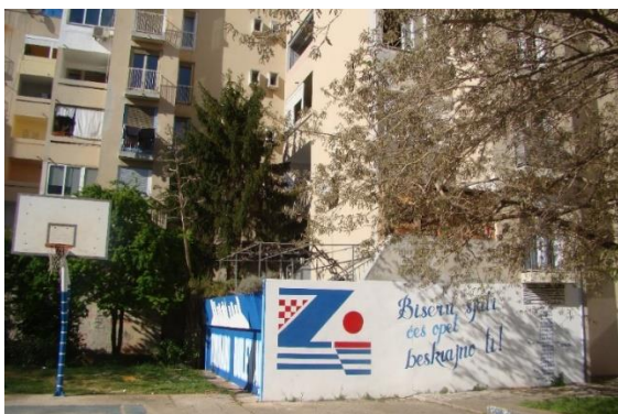
Slika 4. Bulevar

Zanimljiv je mural koji se nalazi na Bulevaru 127 , odnosno u unutrašnjosti ovog kvarta. Prekriva dvije strane zida. Na jednoj je plava pozadina koja dominira, u donjem djelu je natpis, a gore se nalazi stilizirana vizura grada kojom dominira crkva sv. Donata. Na drugoj, strani nalazi se grb košarkaškog kluba, natpis "Biseru sjajni sjat ćeš opet ti", a skroz lijevo nalaze se najvažnije godine koje pokazuju što je sve postigao ovaj klub. Uz sam mural, nalazi se kvartovsko košarkaško igralište kojim se zaokružuje cijela priča. Sa jedne strane nalazi se vizura grada kao podsjetnik identiteta mjesta, sa druge strane prikazana su važna postignuća kluba koja su vidljiva svim prolaznicima, ali i mladima koji se ovdje igraju. Stoga, na jednom malom mjestu imamo nekoliko elemenata baštine koji se međusobno prepliću.