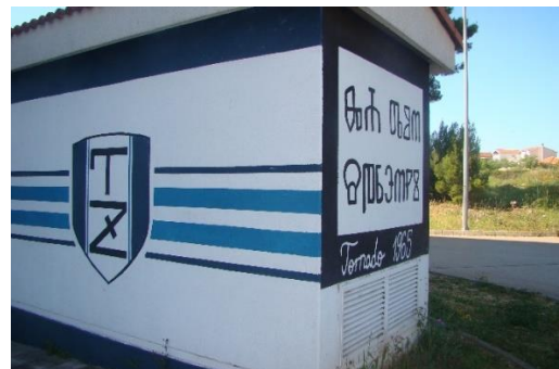
Slika 2. Trafostanica sa muralom na glagoljici