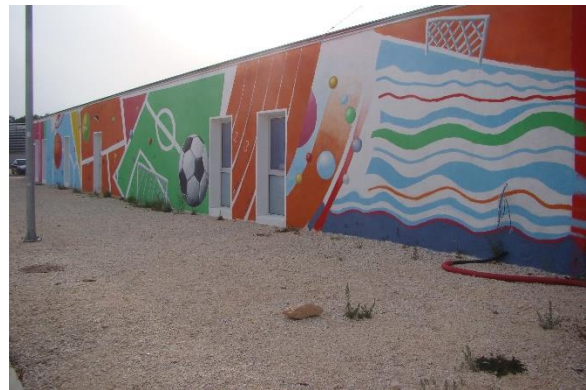
Slika 38. Sportovi 2 – Višnjik