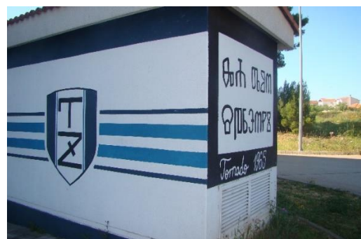
Slika 2. Trafostanica sa muralom na glagoljici