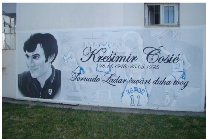
Slika 10. Krešimir Ćosić – Bulevar