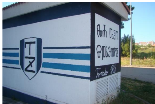
Slika 2. Trafostanica sa muralom na glagoljici