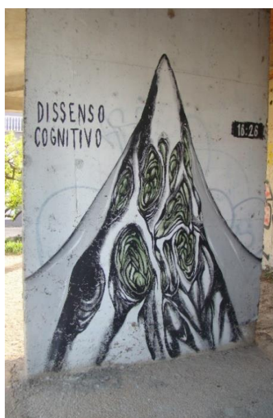
Slika 18. Dissenso Cognitivo – Ričine 2