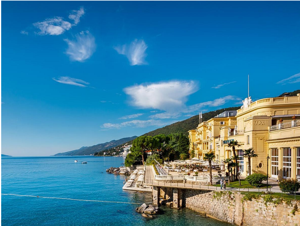
Slika 4: Hotel Kvarner