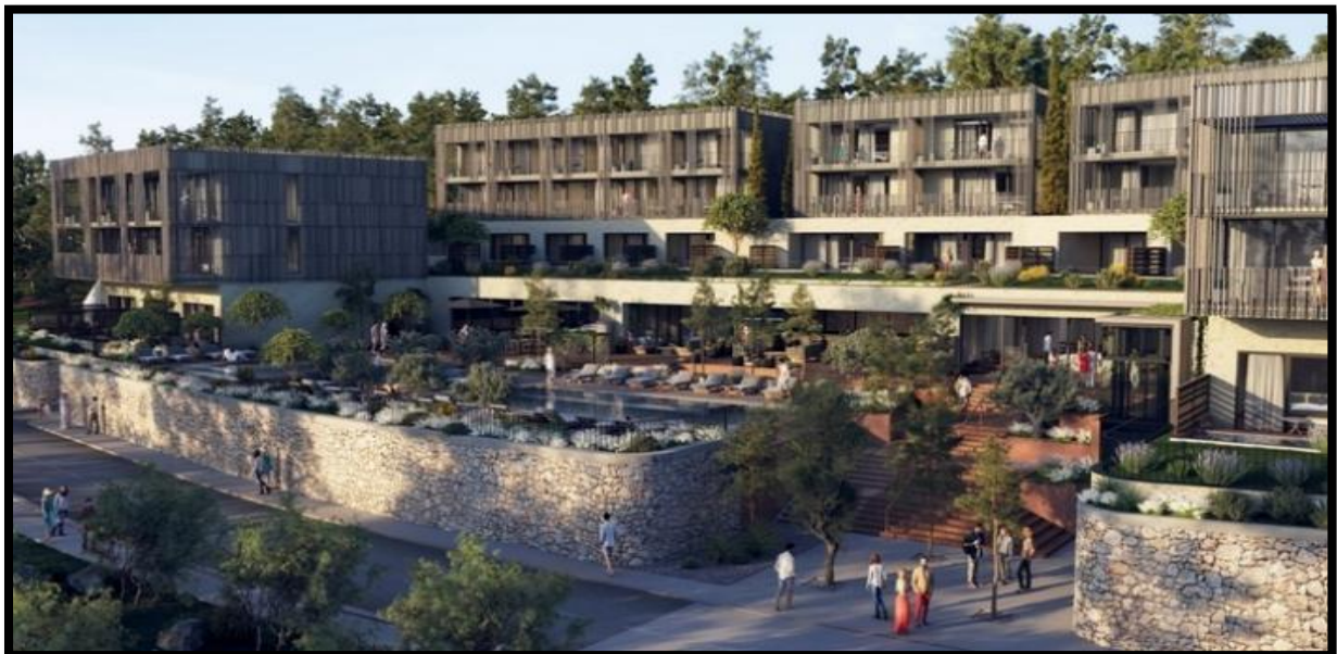
Slika 5. Novoizgrađeni luksuzni Maslina Resort u Starom Gradu na Hvaru