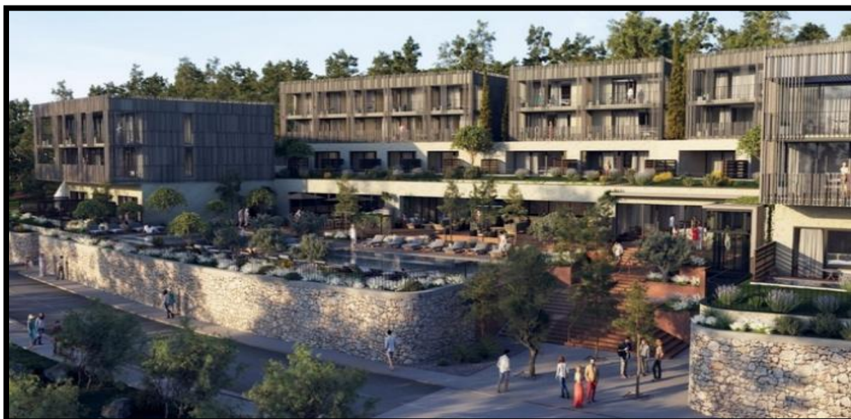
Slika 5. Novoizgrađeni luksuzni Maslina Resort u Starom Gradu na Hvaru