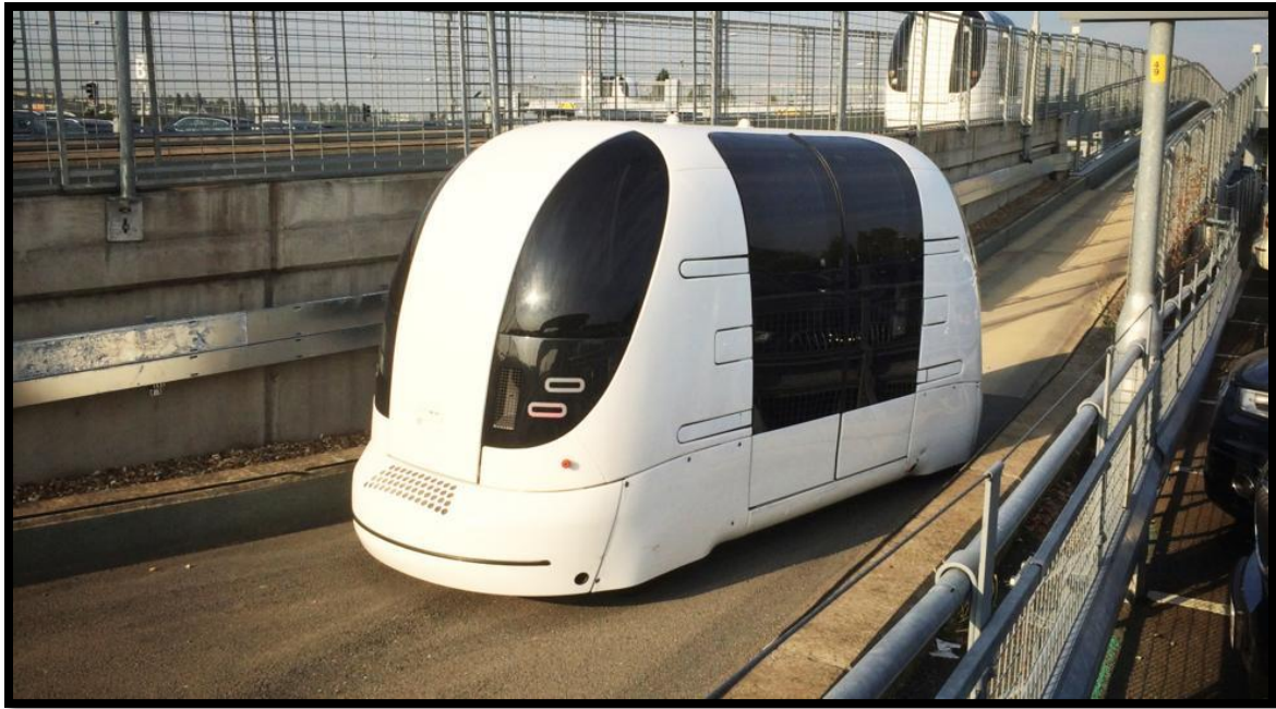
Slika 6. Inovacija za prijevoz putnika u zračnoj luci Heathrow- kapsule Heathrow pods