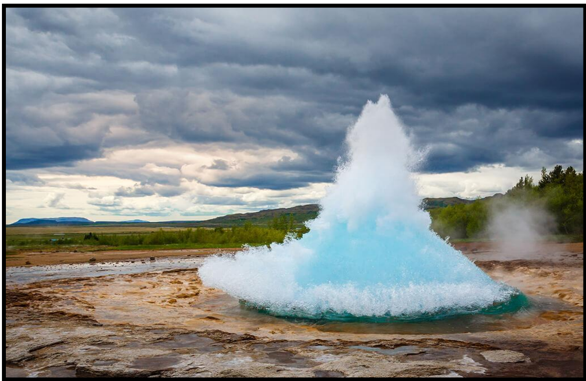
Slika 7. Izvor energije na Islandu

euroazijske tektonske ploče, vrlo aktivne vulkanske zone koja potiče njihove geotermalne sustave. Glečeri pokrivaju preko 11% zemlje. Sezonsko topljenje glečera hrani glečerske rijeke, koje teku od planina do mora doprinoseći islandskim hidrogeotermalnim resursima. Zemlja također raspolaže izvrsnim potencijalom u vjetroenergiji. Današnja ekonomija Islanda, pa tako i najbrojnijeg grada Reykjavika je, od pružanja grijanja i struje za kućanstva te udovoljavanja potrebama intenzivnih industrija, zemlja koju uvelike pokreće zelena energija iz hidro i geotermalnih izvora (UN Chronicle, 2020).