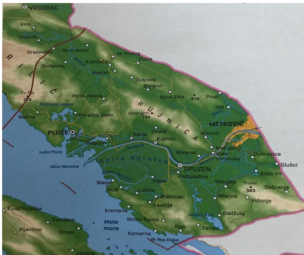
Slika 1. Donje Poneretavlje

Područje Donjoneretvanskog kraja u znanstvenoj literaturi još nije dobilo jedinstveni naziv. U 18. stoljeću fra Andrija Kačić-Miošić i fra Luka Vladimirović to područje nazivaju Neretvanska krajina . Trpimir Macan (kao i Damir Magaš, koji naknadno usvaja taj naziv) navedeno područje naziva Donjim Poneretavljem (Sl. 1), Zoran Curić Donjoneretvanskim krajem , Martin Glamuzina Deltom Neretve , a Jakša Raguž Hrvatskim Poneretvljem . U novinskim se tekstovima najčešće koriste imena Neretvanska dolina i Dolina Neretve , dok stanovnici ovaj kraj najčešće nazivaju Donjom Neretvom ili Neretvom . Vidović u svojim radovima navedeno područje naziva Neretvanskom krajinom budući da je riječ o povijesno i terenski potvrđenom imenu. Druga bi imena i nazivi područja bila neprikladna za uporabu jer su višeznačna (Vidović, 2013).