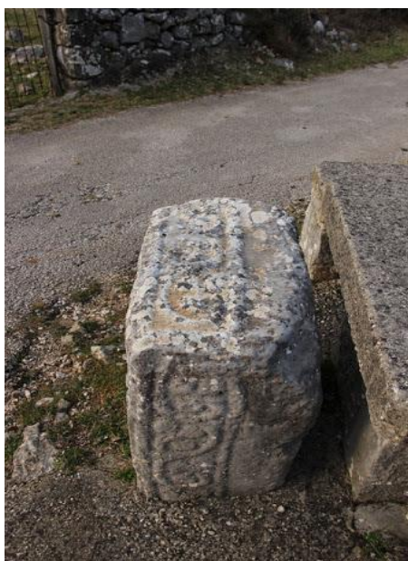
Slika 4. Crkva Male Gospe, Dobranje

Osim spomenutih, važno je istaknuti i lokalitet Grebine, koji se nalazu u blizini Ploča gdje je pronađeno postojanje 8 kamenih gomila i 22 stećka. Od 22 spomenika, 4 su amorfna spomenika, 18 ih je obrađeno u cijelosti ili djelomično. Na Grebinama se nalaze niži oblici stećaka, čija je visina većinom od 20 do 45 centimetara (Šunjić, 2009).