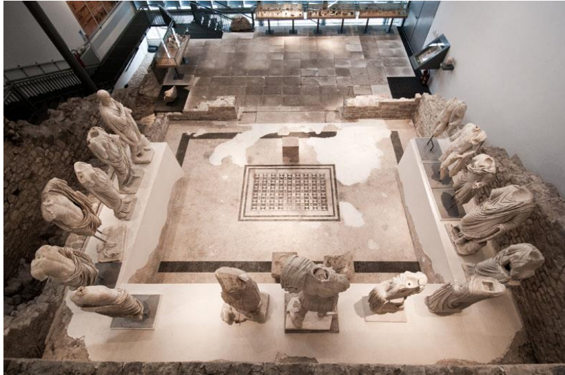
Slika 9. Pogled na Augusteum