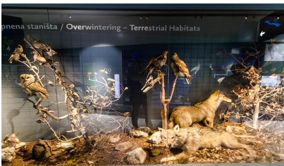
Slika 11. Kopnena staništa