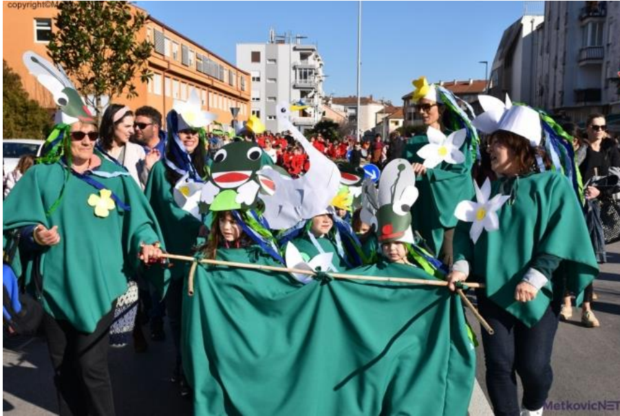
Slika 16. Pokladna povorka

učenici žele sudjelovati i u kojima mogu povezati likovnost i baštinu. Učenici komentiraju kostime ostalih učenika i hvale njihov rad i trud. Pitamo učenike ima li nešto što bi drugačije napravili u ovom projektu, potičemo ih da kritički zaključuju i daju svoje prijedloge.