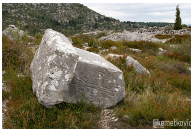
Slika 5. Slivno – Prović