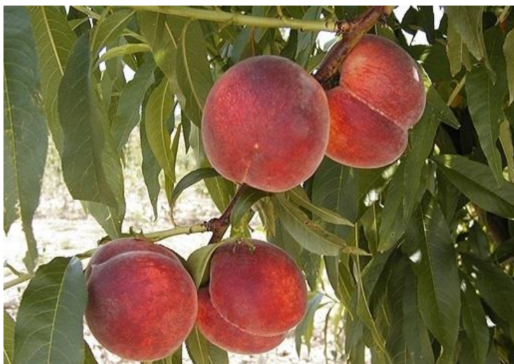
Slika 8. Sorta 'Spring Lady'

'Royal Glory' sorta je proizvedena u SAD-u. Nastala je slobodnim oprašivanjem sorte 'May Granda'. Ima bujno i vrlo rodno stablo (Medin, 1998.). Plod je krupan, okruglog oblika, osnovna boja pokožice je žuta, a dopunska koja prekriva površinu ploda 80 do 100% je crvena. Meso joj je žute boje, čvrsto i srednjeg okusa i ne odvaja se od koštice. Sazrijeva u prosjeku 5 dana prije Redhavena. Odlične je otpornosti na transport. Mratinić (2012.) preporučuje njezin uzgoj u toplijim krajevima zbog osjetljivosti prema proljetnim mrazovima, a Medin (1998.) navodi da se zbog dobrih bioloških i gospodarskih svojstava nalazi u proizvodnji u jadranskom području Hrvatske.