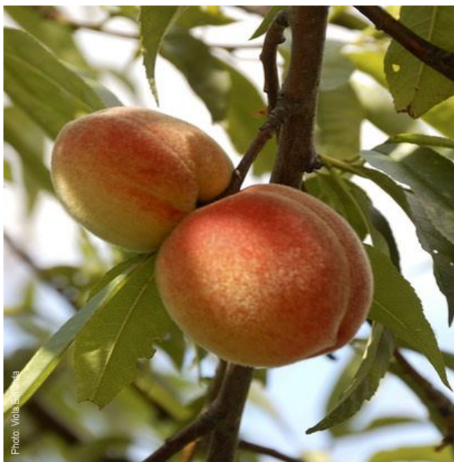
Slika 16. Sorta 'Maria Marta'

'Lisbeth' sorta čije je porijeklo SAD se uzgaja od 1972. Sazrijeva otprilike 3 dana poslije 'Redhavena'. Ima srednje bujno i rodno stablo. Plod joj je srednje krupan i okrugao, pokožica je žute boje s 90-100% dopunske crvene boje. Ima meso žute boje, vrlo čvrsto i dobrog okusa. Razvrstana je u kalanke i dobre je otpornosti na manipulaciju i transport. Medin (1998.) navodi da u nekim dijelovima Italije i drugim zemljama zamjenjuje 'Redhaven' zbog bolje obojenosti i veće čvrstoće mesa koja joj omogućuje uzgoj na većim udaljenostima od tržišta.