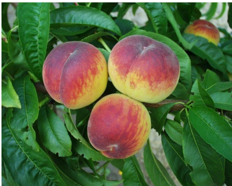
Slika 14. Sorta 'Dixired

'Flavour Crest' sorta je porijeklom iz SAD-a, uzgaja se od 1974. Ima bujno i vrlo rodno stablo koje redovito rađa. Plod joj je srednje krupan, okruglog oblika, osnovne boje pokožice žute, dopunska crvena boja pokriva 80 do 100% površine ploda. Meso ploda je žuto s crvenim prugama, čvrsto i srednjeg okusa. Relativno je osjetljiva na niske temperature i proljetne mrazeve. Sazrijeva prosječno 3 dana prije 'Redhavena' te spada u kalanke. Mratinić (2012.) i Medin (1998.) potvrđuju odličnu otpornost na manipulaciju i transport te da zbog dobrih svojstava može u nekim krajevima zamijeniti 'Redhaven'. Medin (1998.) još navodi da je vrlo dobra sorta za srednje i južne krajeve Italije te da se kod nas uzgaja u zadarskoj regiji, dolini Neretve i Istri.