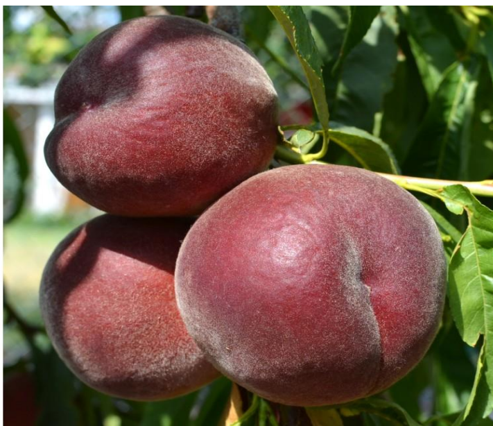
Slika 11. Sorta 'Royal Gem'

Sorta 'Rich May' je porijeklom iz SAD-a, sadi se u nasade od 1991. god. Dozrijeva otprilike 34 dana prije 'Redhavena'. Ima bujno stablo i vrlo je rodna. Plod je krupan, okruglastog oblika. Osnovna boja pokožice ploda je žuta, dopunska je intenzivna crvena i prekriva skoro cijelu površinu. Meso je žute boje, spada u polukalanke i pokazuje dobre karakteristike u transportu (Mratinić, 2012.).