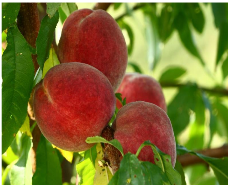
Slika 15. Sorta 'Flavour Crest'

Sorta 'Maria Marta' je porijeklom iz Italije, u nasade se sadi od 1990. god. Nastala je samooplođnjom 'Glohavena' te je prema podacima Mratinić (2012.) zadržala sva dobra svojstva sorte od koje je nastala. Stablo je bujno i vrlo rodno, plod je srednje krupan i okrugao. Osnovna boja pokožice je žuta te je pokrivena 70% dopunskom crvenom bojom. Ima meso žute boje koje je uz košticu crvenkasto, čvrsto i dobrog okusa. Spada u kalanke. Pokazala je odličnu otpornost na manipulaciju i transport. Vrijeme dozrijevanja plodova je u prosjeku od 8 do 10 dana poslije 'Redhavena' (Mratinić, 2012.). Vrsaljko (1999.) u svom istraživanju provedenom na području Ravnih Kotara navodi da je sorta pokazala relativno veliku otpornost na niske zimske temperature i proljetne mrazeve. Medin (1998.) navodi da se u našoj zemlji proizvodi u zadarskoj regiji gdje se od novijih kultivara izdvojila po rodnosti, obojanosti ploda i manipulativnim svojstvima.