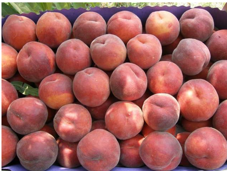
Slika 10. Sorta 'Rich Lady'

Sorta 'Rich Lady' je porijeklom iz SAD-a, roditelji su nepoznati, a uzgaja se od 1990. Mratinić (2012.) navodi da dozrijeva u prosjeku 2 dana prije 'Redhavena'. Ima bujno stablo, visoke i redovite rodnosti. Plod je srednje krupan do krupan, osnovna boja pokožice joj je zlatnožuta, dopunska boja je crvena i pokriva čitavu površinu ploda. Meso je žuto s malo crvene boje, odlične kvalitete, okusa i arome. Kalanka je i otporna na transport.