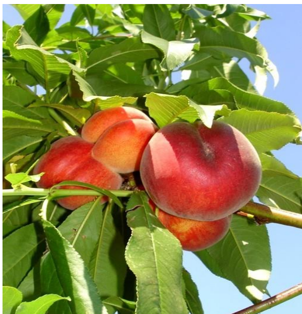
Slika 7. Sorta 'Springcrest'

Sorta 'Spring Lady' je porijeklom iz SAD-a, stvorena je od slučajno izdvojenog sjemenjaka. Proizvodi se od 1979. (Medin, 1998.). Bujna je sorta, ima dobru i redovitu rodnost, plod joj je srednje krupan, žutozelene pokožice, pokrivena sa skoro 100% crvenilom. Ima meso žutonarančaste boje koje je čvrsto i dobrog okusa. Durancija je i dozrijeva 17 dana prije 'Redhavena' (Krpina i sur. 2004.). Pokazala je vrlo dobru otpornost na manipulaciju i transport. Mratinić (2012.) navodi da je jedna od najboljih sorti u svom vremenu zrenja te da ju također treba širiti u komercijalnoj proizvodnji. Prema Medinu (1998.) bolje rezultate daje u južnijim, toplijim krajevima.