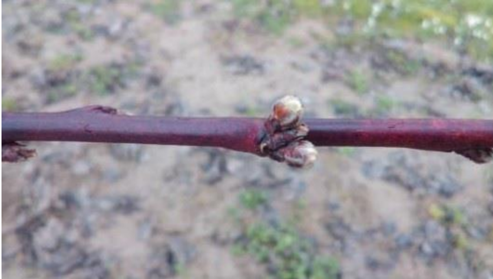
Slika 1. Primjer jednogodišnjeg mješovitog izboja breskve

nove rodne mladice. Na vrhu izboja formira se drveni pup, cvjetni i lisni su smješteni postrano. Na slici 1. prikazan je dugi rodni izboj s vegetativnim i generativnim pupovima.