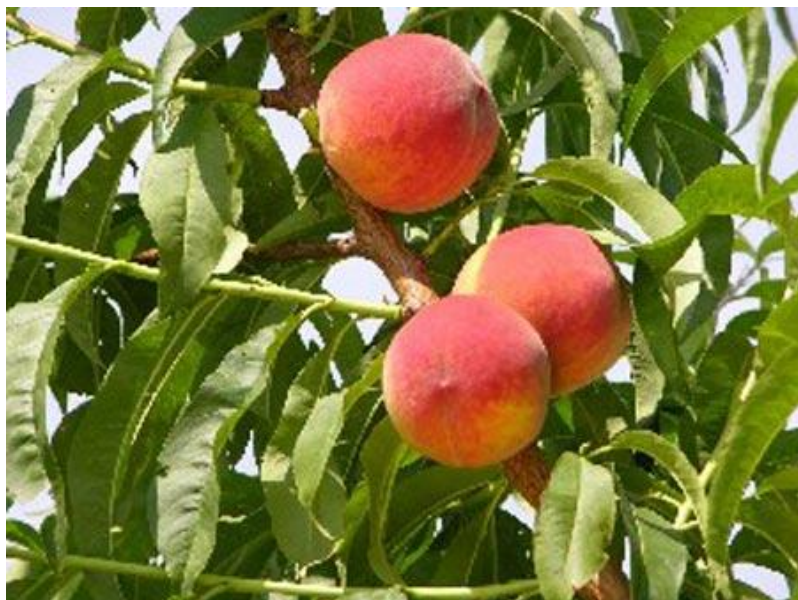
Slika 12. Sorta 'Rich May'

Sorta 'Rich May' je porijeklom iz SAD-a, sadi se u nasade od 1991. god. Dozrijeva otprilike 34 dana prije 'Redhavena'. Ima bujno stablo i vrlo je rodna. Plod je krupan, okruglastog oblika. Osnovna boja pokožice ploda je žuta, dopunska je intenzivna crvena i prekriva skoro cijelu površinu. Meso je žute boje, spada u polukalanke i pokazuje dobre karakteristike u transportu (Mratinić, 2012.).