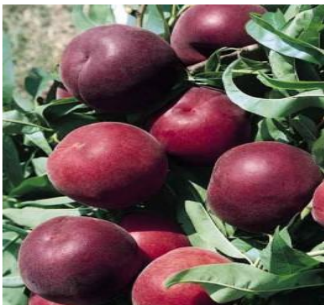
Slika 9. Sorta 'Royal Glory'

'Royal Glory' sorta je proizvedena u SAD-u. Nastala je slobodnim oprašivanjem sorte 'May Granda'. Ima bujno i vrlo rodno stablo (Medin, 1998.). Plod je krupan, okruglog oblika, osnovna boja pokožice je žuta, a dopunska koja prekriva površinu ploda 80 do 100% je crvena. Meso joj je žute boje, čvrsto i srednjeg okusa i ne odvaja se od koštice. Sazrijeva u prosjeku 5 dana prije Redhavena. Odlične je otpornosti na transport. Mratinić (2012.) preporučuje njezin uzgoj u toplijim krajevima zbog osjetljivosti prema proljetnim mrazovima, a Medin (1998.) navodi da se zbog dobrih bioloških i gospodarskih svojstava nalazi u proizvodnji u jadranskom području Hrvatske.