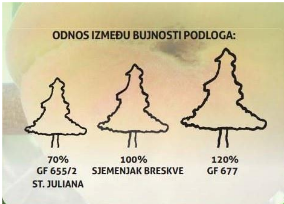
Slika 2. Odnos bujnosti podloga

ST. Juliana GF 655/2 je francuska podloga za šljivu i breskvu. Puno se prakticira kao podloga za breskve i nektarine s kojima ima dobru podudarnost. Prikladna je za uzgoj bresaka u gustom sklopu, a dobro uspijeva i na karbonatnim tlima. Vrlo je otporna na rak korijena i olovnu bolest. Sorte bresaka na ovoj podlozi imaju za 20 do 30% slabiju bujnost od običnog sjemenjaka breskve (Slika 2.) (Miljković, 1997.).