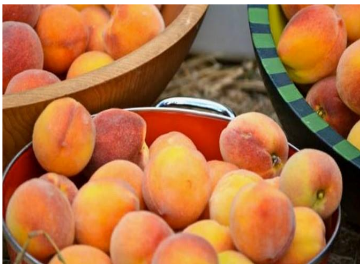
Slika 13. Sorta 'Early Redhaven'

Sorta 'Early Redhaven' je porijeklom iz SAD-a, nastala mutacijom pupova 'Redhavena'. Plodovi joj dozrijevaju otprilike 12 do 14 dana prije 'Redhavena'. Ima umjereno bujno stablo, rađa vrlo dobro i redovno. Mratinić (2012.) navodi da je razlika između 'Early Redhavena' i 'Redhavena' u tome da je 'Early Redhaven' znatno vitalniji od 'Redhavena'. Isti autor navodi da je relativno otporna prema niskim zimskim temperaturama. Plod je srednje krupan, okruglastog je oblika, osnovna boja pokožice je žuta, a dopunska je crvena. Ima žuto i kvalitetno meso, spada u polukalanke i dobro podnosi transport.