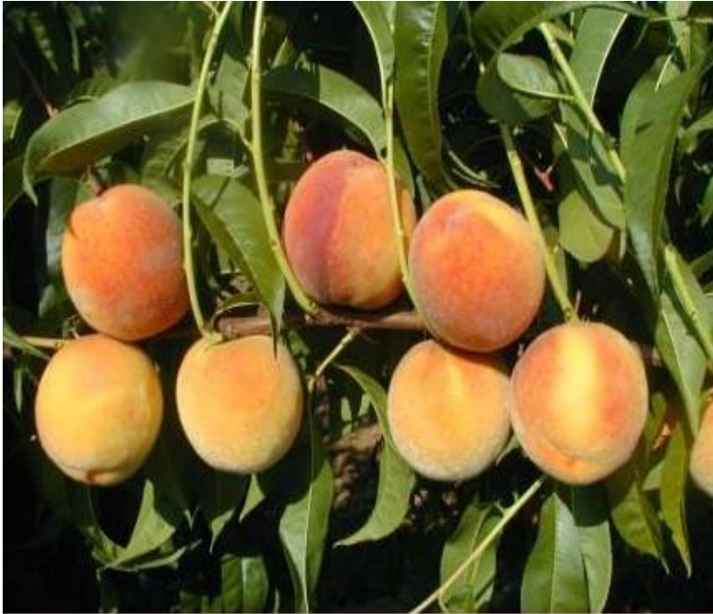
Slika 6. Sorta 'Redhaven'

navodi s obzirom da sazrijeva na sredini vremena dozrijevanja bresaka, uzima se kao standard za određivanje vremena dozrijevanja kod drugih sorti. Isti autor navodi da je vrlo zastupljena u uzgoju i ekonomski značajna sorta, navodeći kao razloge dobru otpornost na manipulaciju, transport i kvalitetu plodova. Vrsaljko (1999.) navodi da je ova sorta u području Ravnih Kotara pokazala najmanju osjetljivost prema pozebi. Medin (1998.) još dodaje da je u Hrvatskoj vodeća sorta u svim krajevima.