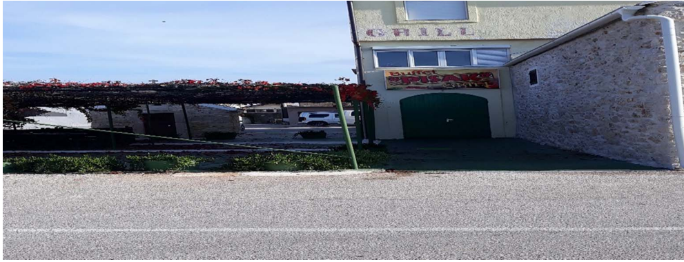
Slika 4. Lokacija prvog groblja (autor: Lucija Prpić)