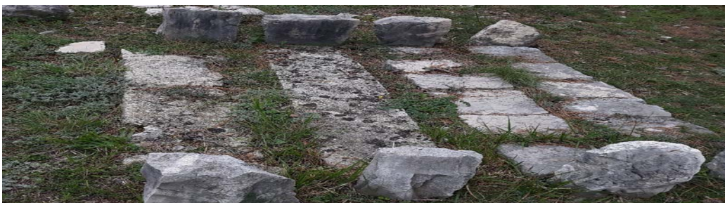
Slika 2. Mirila kod današnjeg groblja (autor: Lucija Prpić)