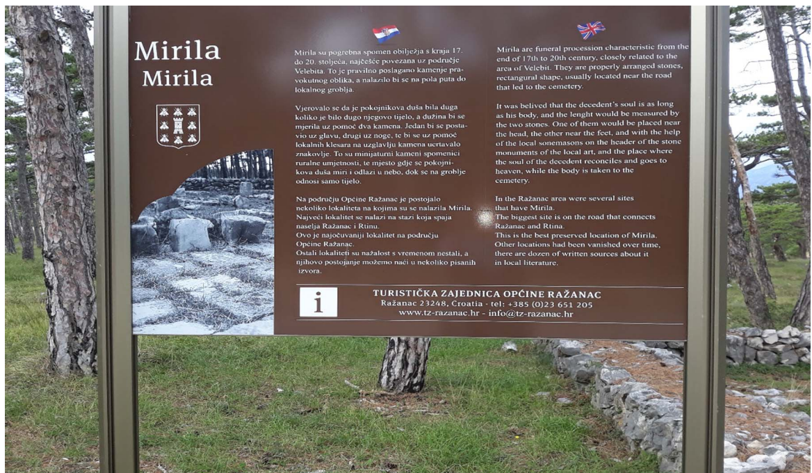
Slika 7. Informativna tabla o mirilima

(usp. Keleman i Lončar, 2011: 204) Naime, zajednici koja je nekada prakticirala mirila, njihova praksa može biti obična i svakodnevna, ali kada bi se to „obično“ ispričalo turistu koji je došao na odmor, njemu bi nepoznat način života zajednice bio itekako zanimljiv i neobičan. Iz ovoga proizlazi da nešto što je okarakterizirano kao „obično“ ne mora biti turistički nezanimljivo. (usp. Isto, 2011: 204) Za turističku promidžbu ne moraju se koristiti nestvarni, idilični prizori koji na prvu ostavljaju bez daha. Upravo je to jedan od nedostataka kulturnog turizma. (usp. Isto, 2011: 204) Svakako je bolje napraviti raznoliku turističku ponudu s kojom se zajednica poistovjećuje, tako da se dobije otvoreniji i novi pristup koji će se za sobom povlačiti stručnjake za osmišljavanje kulturno – turističkih strategija. (usp. Isto, 2011: 205)