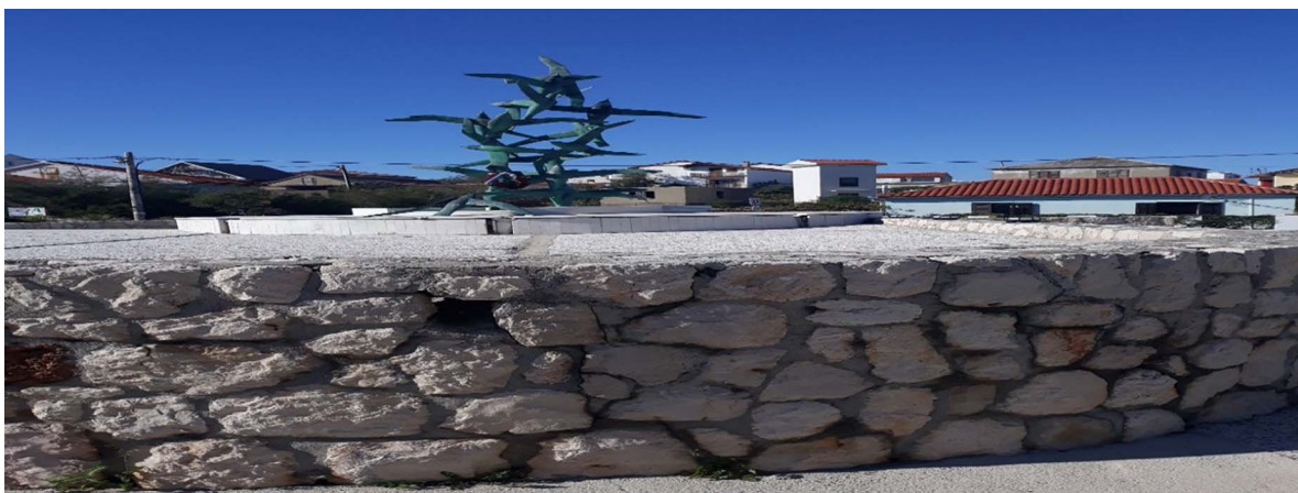
Slika 6. Drugo je groblje bilo smješteno na mjestu gdje je danas spomenik palim borcima

Dok neki mještani smatraju da su komunisti zbog nekih svojih svjetonazora naredili premještanje groblja na današnju lokaciju, on smatra da je to u domeni crkvenih vlasti da odlučuju o tome.