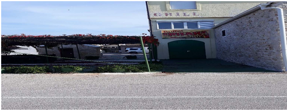
Slika 4. Lokacija prvog groblja (autor: Lucija Prpić)