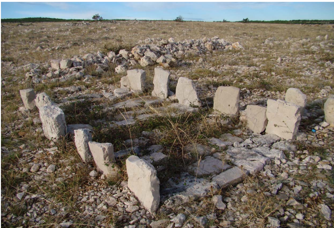
Slika 1. Rtinska mirila u Razdolju

Temu koju sam odabrala smatram aktualnom i vrlo važnom. Smatram da je važno osvještavati mlađe generacije o nekadašnjim značenjima koja su mirila imala. Sam pogled na mirilo i upisano ime na njemu, podsjeti nas da je tim putem prošao netko koga više nema u tjelesnom obliku, ali je i dalje prisutan kroz sjećanja zahvaljujući upravo mirilima.