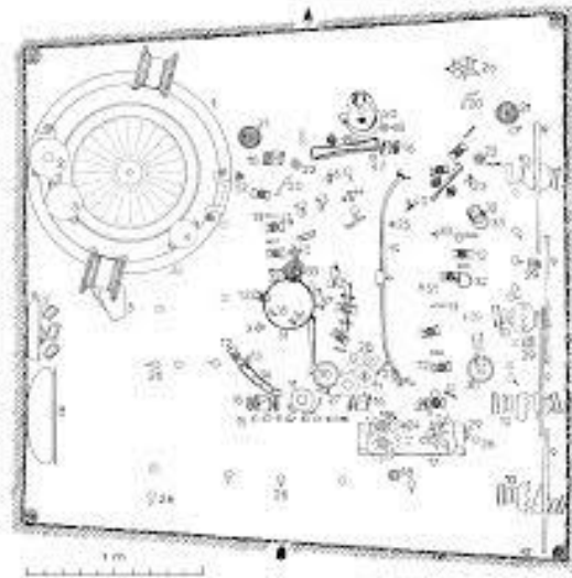
Slika 7. Grob kneginje iz Vixa (C. J. KNÜSEL, 2002:282)

S obzirom na to da je lubanja pripadala nordijskom robusnom tipu lubanje, Spindler je pretpostavio kako bi ova lubanja mogla pripadati i mediteranskom gracilnom tipu lubanje lokalnih muškarca. 65 Nakon što je Rene Langlois proveo posljednja osteološka istraživanja, utvrđeno je da je riječ o jedinki ženskoga spola čija lubanja zaista ne odgovara lokalnom tipu lubanja. Neki su znanstvenici pretpostavili, na osnovu pronađenoga grčkog kratera u grobu, da je pokopana žena kći grčkog visokopozicioniranog trgovca ili člana grčke elite koja je tu došla udajom za lokalnog kralja radi stvaranja političkog saveza. 66 S druge strane, izučavajući ovu i sličnu pojavu bogatih ukopa žena u željeznom dobu pod tumulima, Bettina Arnold tvrdi da su zaključci o ovakvim pojavama pojednostavljeni te da bi se ozbiljnije trebalo osvrnuti na pretpostavku da su i žene imale mogućnost steći visok društveni status. Mogle su ga steći brakom, ličnim naporom ili rodbinskim vezama te su imale važnu i ponekad ključnu ulogu u donošenju važnih odluka unutar željeznodobnog latenskog društva. 67