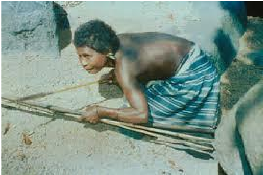
Slika 6. Žena-lovkinja, članica zajednice Agta

Hipoteza o muškarcu-lovcu više je puta dekonstruirana kasnijim antropološko-etnološkim istraživanjima. Goodman i Griffin u studiji o kompatibilnosti lova i majčinstva među Agta lovcima-sakupljačima navode niz primjera gdje lov nije ograničen na muškarce. 56 Prije svega, navodi se primjer Mbuti zajednice s područja Konga u kojoj žene aktivno sudjeluju u lovu uz pomoć mreža te sudjeluju u prenošenju mesa do naselja. Osim toga, ističe se primjer i žena iz starosjedilačke zajednice Ainu s područja Japana gdje žene povremeno love koristeći užad i pse, slično kao i žene iz aboridžinskih zajednica zapadne Australije koje također koriste pse pri lovu. Na području Filipina, unutar zajednice Pinatubo Negritos sa Zambales planine, žene aktivno love koristeći luk i strijele. Konačno, zabilježeno je kako žene iz zajednice Agta na sjeveroistoku provincija Luzon i Cayagan aktivno love divlje svinje i jelene (slika 6.). Njihova lovna aktivnost nema utjecaja na njihove reproduktivne mogućnosti, štoviše, žene unutar ove zajednice love uglavnom na vrhuncu svoje reproduktivne dobi. Love uz pomoć pasa i najčešće u grupama koje se sastoje od sestara, majki, muževa, braće i sl. Na primjeru Agta žena jasno je da žene nisu ograničene niti brigom o djetetu niti biološkim predispozicijama te da lovna aktivnost generalno nije uvjetovana spolom jedinke nego geografskom pozicijom i ekološkim mogućnostima okoline u kojoj zajednica obitava. 57