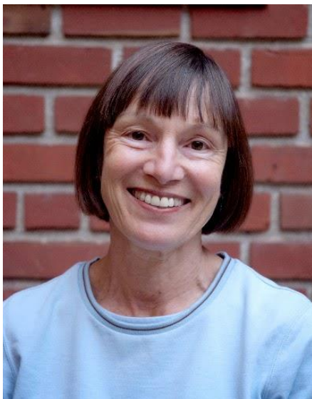
Slika 2. Margaret W. Conkey ( http://www.pevreblanque.org/p/the-team.html )

Do trenutka prepoznavanja važnosti stvaranja novog teorijskog okvira ili korištenja postojećeg na novi način, arheološka su istraživanja bila poglavito androcentrična te je postojala potreba za isticanjem onog što nedostaje, a to je ženska uloga, doprinos i perspektiva prilikom konstruiranja prošlosti i kulturne promjene. Ove ideje, barem djelomično, nastaju pod utjecajem tadašnjih društvenih pokreta, posebice drugog vala feminizma koji je utjecao i na antropologiju, primatologiju, povijest te prirodne znanosti i potaknuo niz kritika usmjerenih ka pristupu proučavanja njihove građe. 1 Feministička konferencija pod nazivom Were They All Men? održana je 1979. godine od strane norveškog arheološkog kolektiva te predstavlja prvi potez u smjeru diskusije o problemu žena u struci i prošlosti. 2 Nedugo nakon, 1984. objavljen je članak Margaret W. Conkey (slika 1.) i Janet D. Spector (slika 2.) iz 1984. godine (prvi takvih razmjera) u kojemu autorice kritiziraju androcentrizam prisutan u znanosti i upozoravaju na posljedice i opasnosti korištenja takvog pristupa te primjene postojeće metodologije nekritički. 3 Nakon toga, uslijedio je niz drugih publikacija, debata, konferencija, simpozija i radionica posvećenih izučavanju arheologije roda. 4