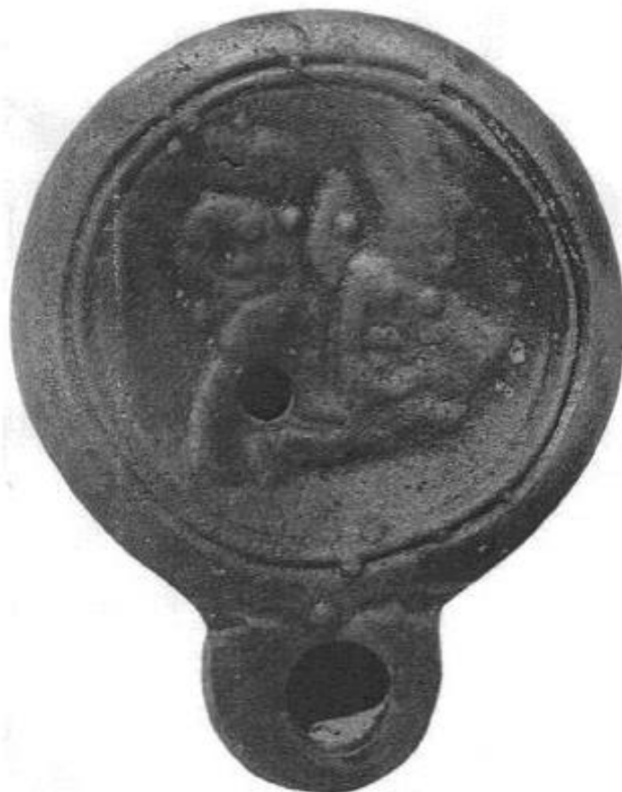
Slika 8. Lucerna s prikazom gladijatorica u borbi (MIĄCZEWSKA, A. B. 2012:22)

Osobe su prikazane u gladijatorskoj opremi i nema sumnje da je riječ o gladijatorima. Figura s desne strane prikazana je u trenutku pada, dok je druga prikazana u položaju spremnom na borbu s mačem i štitom. Temelj za pretpostavku da je ovdje riječ o ženama jest prikaz prsnoga koša, odnosno golih grudi što ukazuje na to da je cilj majstora bio prikazati žene na ovoj lampi. Autorica tvrdi, temeljeno na činjenici da su žene prikazane gole, da je riječ o Amazonkama. 70 Dakle, žene-gladijatori vjerojatno su bile posebna pojava koja je inspirirala mnoge druge žene da se upuste u ovakav pothvat koji je u osnovi pripadao muškarcima i simbol je maskuliniteta.