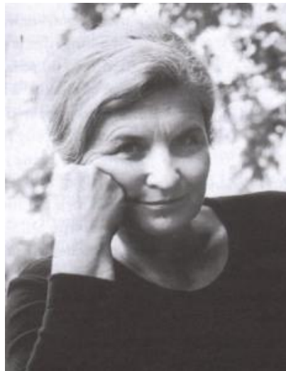
Slika 3. Marija Gimbutas