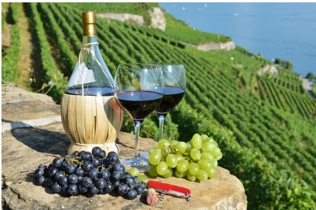
Slika 2. OPG Antunović Pelješac