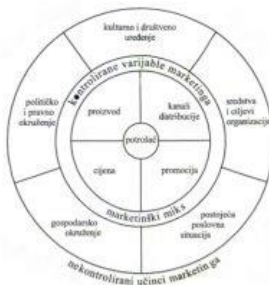
Slika 4. Funkcioniranje marketinga (Senečić J., 2002:5)

"Kao oblik tržišnog poslovanja marketing je rezultat općeg razvoja znanosti i tehnike, odnosno povećana mogućnost proizvodnje dobara. Pojam marketinga, povijesno gledano, determinirana je stupnjem razvoja proizvodnih snaga, društvenim ciljevima, podjelom rada i tržištem." (Senečić J., Vukonić B., 1997:2)